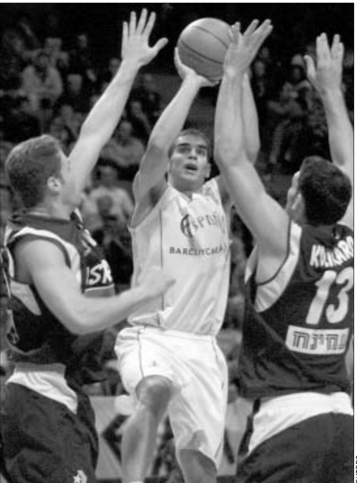
ესპანელი ხოსე კალდერონი ებრაელთა ფარს უტყვის

"ამ ჩემპიონატზე ესპანეთმა არაერთხელ დაადასტურა, რომ ევროპის ერთ-ერთი საუკეთესო გუნდია და უმაღლეს ჯილდოებს იმსახურებს. იტალიელებს ძლიერ