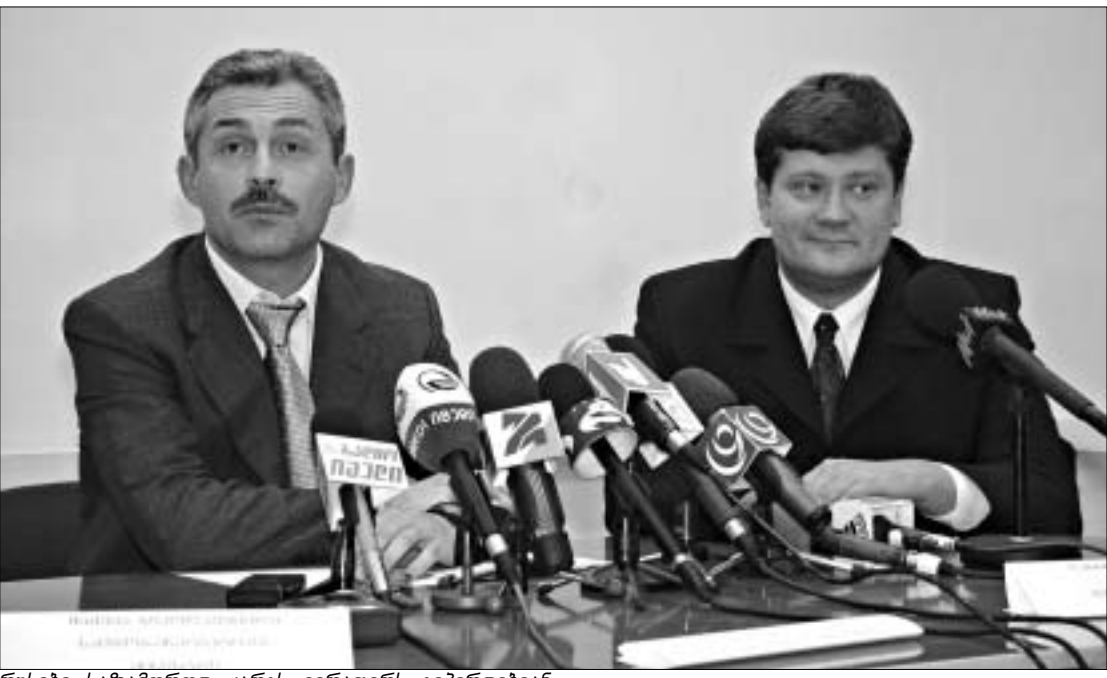
რუსები საზამთროდ კარგს ვერაფერს გვპირდებიან.

რაც შეეხება ელექტროენერჯის ტარიფს, რაპაპორტის ახალი დედა, თავისი ხელმძღვანელის - ანატოლი ჩუბაისის სიტყვებითა-გან განსხვავებული არაფერი უთქვამს: "ტარიფი მხოლოდ ელექტროენერჯის საფასურ-