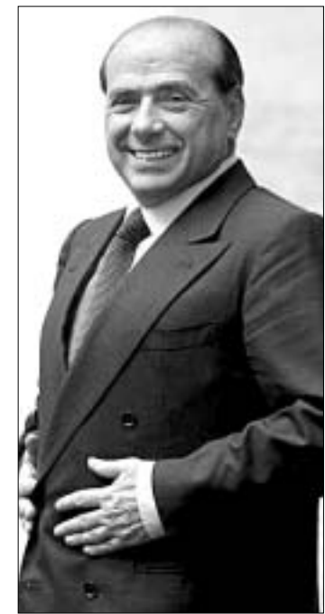
სილვიო ბერლუსკონი ხუმრობს.

იტალიის პრემიერი სილვიო ბერლუსკონი აგრძელებს თავისი "დაუფინყარი" გამოსვლების სერიას. გუშინდელი ინტერვიუს დროს, მან კიდევ ერთხელ გააოგნა საზოგადოება. ჯერ იყო და, ბერლუსკონიმ განაცხადა, რომ იტალიელი მოსამართლეები "ანთროპოლოგიურად განსხვავებულნი ჩვეულებრივი ადამიანებისაგან" და ისინი "გონებრივად განუვითარებულნი" არიან.