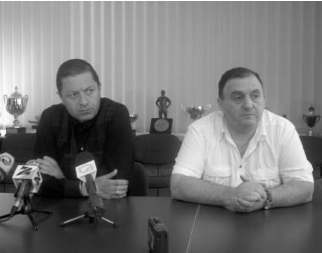
მერაბ ჟორდანიას ახალ მწვრთნელს დეკემბერში წარმოავლინებენ

"პირველ ტაიმში არ იგრძნობოდა იმის საშუალება, რომ ნაკრები ასე სამარცხვინოდ დამარცხდებოდა. მარჩიელობა იქნება იმის თქმა, თუ რა მოხდებოდა, ქემოლიძეს რომ ტრავმა არ მიეცოდა. მაგრამ ფაქტია, რომ ფეხბურთელი, რომელიც პერსონალურად მუერვეობდა მეტოქის საუკეთესო თავდასხმელს იგლო ტარეს, პირველივე ტაიმში დაგვემტყარა და ითულებოდა შეცვლა მოგვიხდა. მის ნაცვლად გულშემოტყვევარს ვაპირებდით ვერ იფარგა და დაცვის მარჯვენა ფეხზე ჩაგვიყარდა. ახლა ვერ ვიტყვით, ქემოლიძეს რომ ტრავმა არ მიეცოდა, რა მოხდებოდა."