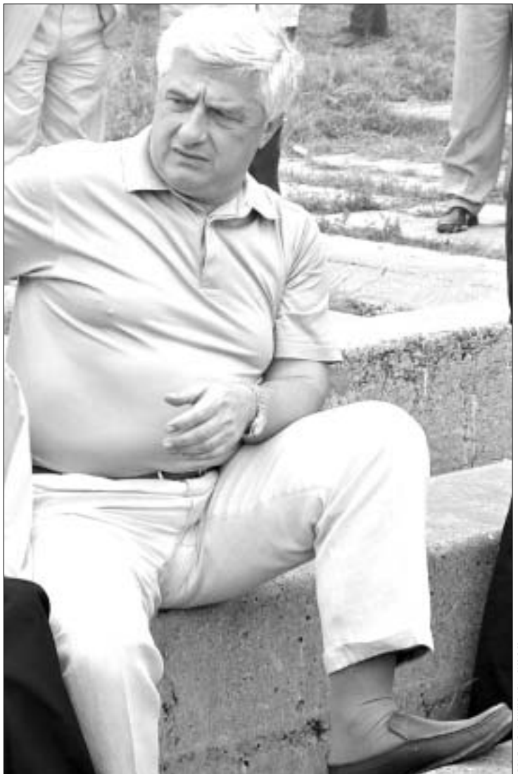
უკმაყოფილო ვარ, რომ დღეს ვერ ხერხდება ელექტროენერჯისთან. პენსიებთან დაკავშირებული საკითხების გადაწყვეტა.

- თქვენ აზრით, ვინ აწყობს ამ საბოტაჟს? - მე რომ უშიშროების მინისტრი ვიყო, ამ კითხვაზე პასუხს ვაგვცემდით. ისინი იმ ძალეში უნდა მოექცნენ, ვინც ამერიკული კომპანიის არსებობით ფინანსურად იყო დანიტერესებული. კონკრეტულად, იყვნენ თუ არა ფენა და სააკაშვილი იმ დროს დანიტერესებული, ამის მონაცემები არ მაქვს. ამიტომაც ეს საქმე უშიშროებამ უნდა შეისწავლოს და მასალები სრულად წარმოადგინოს. - რატომ არ აკეთებს უშიშროება ამას? მით უმეტეს, რომ იგი „ჭიათურმანგაშვიტთან“ დაკავშირებით საკმაოდ მკვეთრ ნაბიჯებს დგამს. ენერგოსისტემაში არსებული ვითარების