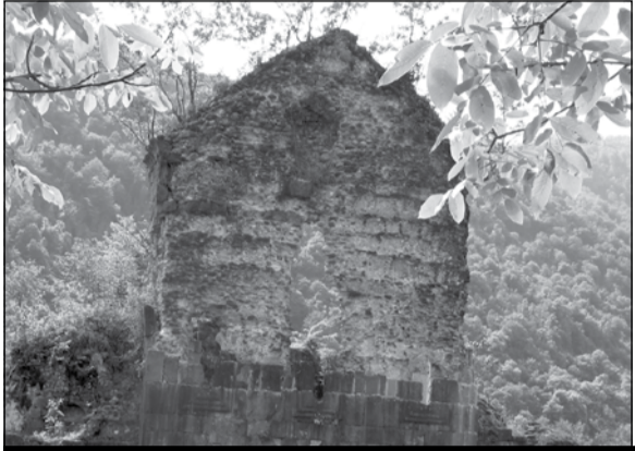
სქურის ტაძრის ხედები აღმოსავლეთიდან, სამხრეთ-დასავლეთიდან; ტაძრის დასავლეთი პორტალი და საკურთხევის აბსიდი

ტოპონიმია. უფრო ძველი ფორმა ოსინჯალე უნდა იყოს, რაც სასიძო ალაგს ნიშნავს. როგორც სოფელში ამბობენ, ქორწილის წინ სიძის მყარიონი დოღს სწორედ ოსინდალესთან ამთავრებდა და ალაგს იმიტომ დაერქვა ეს სახელი.