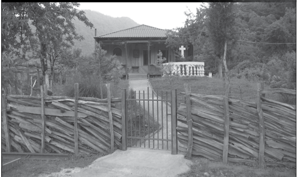
სქურის მონასტერი ვიკონიის ხეობა