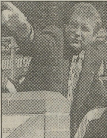
უპირი უკვე ტრიუმფატორია