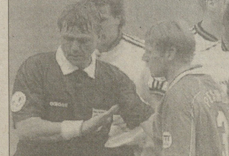
გერმანელთა მწვრთნელის აზრით უნგრელი მანდორ პულის ზოგი ვადანგვეტლებია საკამათო იყო