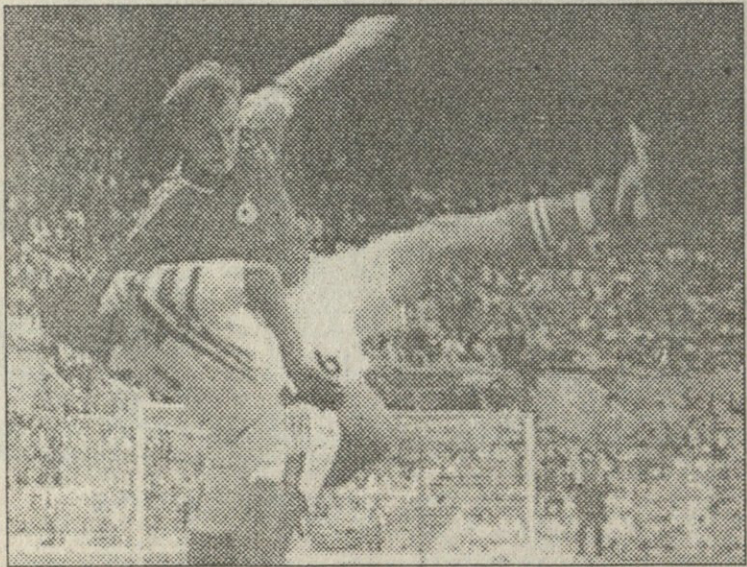
დები-ნემტევის უშვალათო დუელი ხშირად იმართებოდა