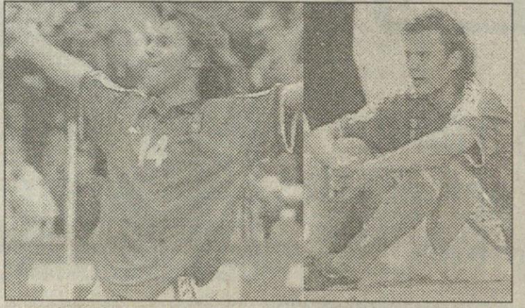
ბერგერი, ჟამი ტრიუმფისა და ჟამი „უეცარი სიკვდილისა“

„უდინეზეს“ 28 წლის ზომბარ დირმა, გერმანელმა ოლივერ ბირჰოფმა ფინალურ მატჩში ორი გოლი გაიტანა. ეს ფაქტი თავისთავად იმდენად მრავალმხედველია, კომენტარს არც საჭიროებს. თუმცა, შეუძლებელია, არ აღინიშნოს, რომ ბირჰოფმა, რომელიც ნაკრებში მხოლოდ ნულს მიიღო, ჩეხთა დამამართება 37 წუთში მოახერხა. თამაშის დამთავრებამდე 20 წუთით უფრო ბირჰოფმა შოლი შეცვალა, ხან წუთში ანგარიში ბრწყინვალე თაურით გაათანაბრა და საქმე დამატებით დრომდე მიიყვანა, იქ 7 წუთზე არ აცვალა ჩეხებს თანაბარ პირობებში ყოფნა და ევროპის ჩემპიონატის პირველი და ერთადერთი „უეცარი სიკვდილი“ გამოიღო. მის მიერ კლინსმანის ჩანოვებით გატანილი გოლი ამ ჩემპიონატისთვის ბოლო და გერმანელთათვის გამარჯვების მომტანი აღმოჩნდა. გერმანიის „შეუძლია უსაზროოდ, რომ კლინსმანს თავდასხმამ ბრწყინვალე მენჯივლე გამოუჩინა. ილიი შესაძლებელია, მომავალში მისი შემცვლელიც გახდეს. ბირჰოფმა ჩემპიონატი მიმდებ კი დაიწყო, მაგრამ ფინალში უზადლო იყო ორი გოლი, ორივე უღამაზესი და, რაც მთავარია, უმნიშვნელოვანესი.