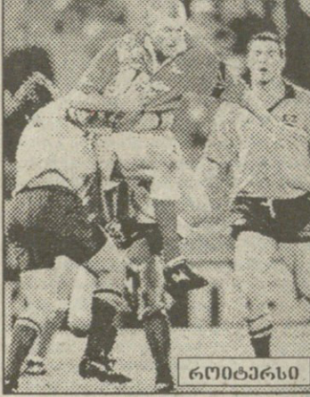
ქულასაც ვერ გაუტანოთ. ვერ გამოიციონ „მეკრებლები“ შესვენებამდე გაუფალიანდნენ მასპინძლებს...