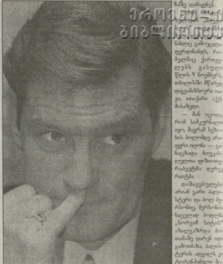
ეს ცხვირი რა გახდაო, დაღონებულია გლენ ჰოლდი