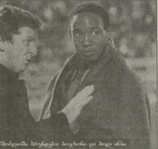
ორივე სამშობლოში ბრუნდება: პოჯისონი და პოლი ინსი

ქვეთმობიარ ყოველთვის იყო დიდი, რომ ინგლისში უნდა დაბრუნებულყოფით? — არა. ეს უბრალოდ ერთი კარგი საბუშაო ადგილის მთხოვნიება ბრძოლა იყო. ინგლისში მუშაობას ერთადერთი უპირატესობა ის აქვს, რომ ენა სრულყოფილად ვიცი, მეტი არაფერი. თავს უფრო ვგროვებდით მოინვეთ თუ ინგლისში? — ევონბეს, უფრო ვეროვალად არ დაგაფუყდეთ, ინგლისი 22 წლის წინ დატოვე. თქვენ „ბლეკბერნში“ უმდიდრეს ვეროვალ გამოცდილებას მიიტანთ, მაგრამ აღუღებენ სხვა მეთოდებს მიჩვეული ინგლისელი მოთამაშები ახლოს მუშაობის თქვენიულ სტილს? — „ინტერში“, სახელმძღვანელოდ ურთულეს კლუბში, ორი წელიწადი გაე