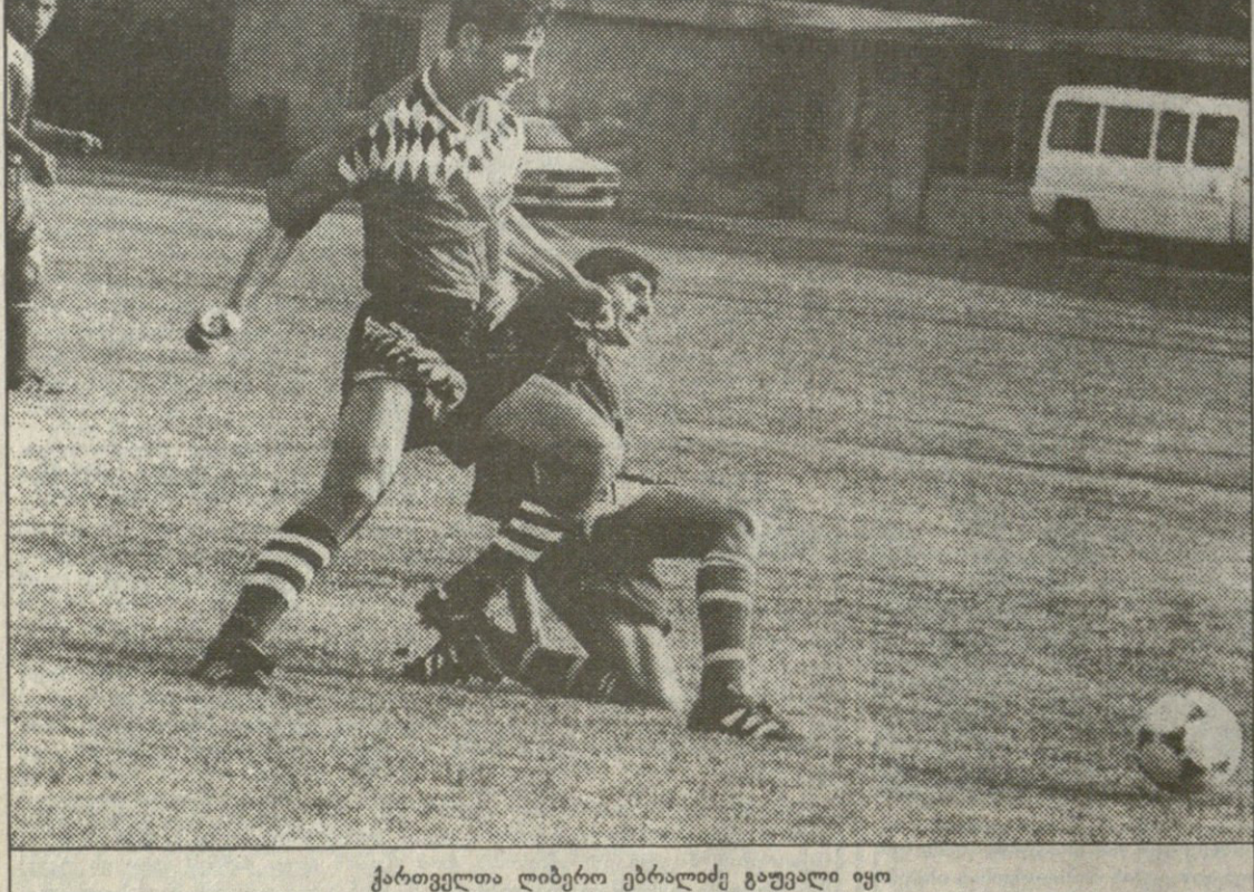
ქართველთა ლიბერო ებრაძისე გაუვალა იყო