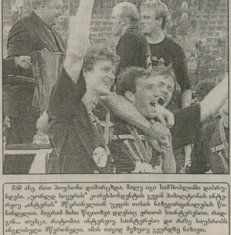
მამ ასე, რთი პოჯესონი დამარცხდა. მალე იგი სამშობლიოში დაბრუნდება. „სუორდ სიკერის“ კორესპონდენტის გვერდის პაპილტონის ინტერვიუ „ინტერის“ მწვრთნელთან უეფას თასის ნახევარფინალის წინანდელია, მაგრამ მისი წაკითხვა დღესაც ერთობ საინტერესოა, რადგან... თუმცა, რატომაც ინტერვიუ საინტერესო და რაზე საუბრობს ინგლისელი მწვრთნელი, ამას თავად მუხუთე გვერდზე ნახავთ.