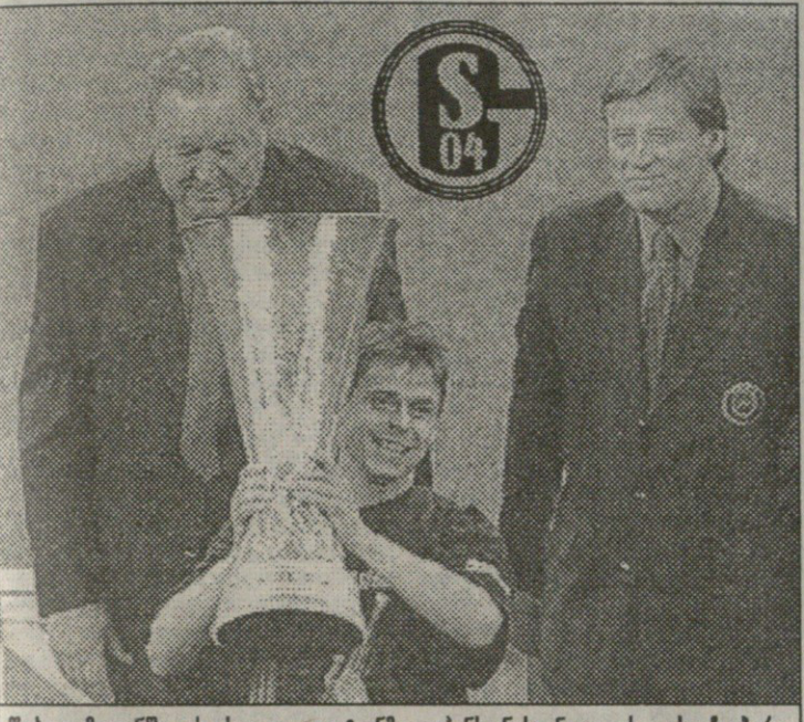
წუხელ მილანში: ეს-ესაა ოლაფ ტონმა იუჰანსონისგან უეფას თასი წაიბარა

საორტულო გაზეთი გამოცემა 1990 წლის 28 დეკემბრიდან ხუთშაბათი, 22 მაისი 1997 №58 (423) ფასი 40 თეთრი