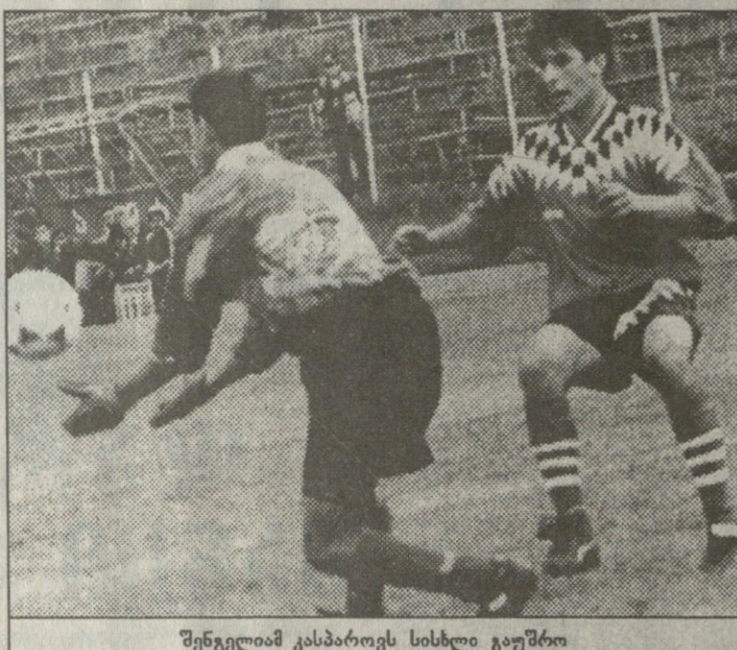
შენგელიამ კასპაროვს სისხლი გაუშრო