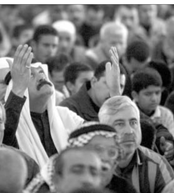
ერაყელები დახმარებას ითხოვენ.