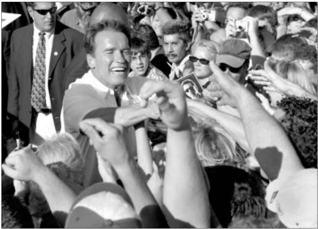
მე თქვენი პრეზიდენტობის შანსი მაქვს

მიუხედავად იმისა, რომ კალიფორნიის გუბერნატორის არჩევნები ერთი წლით გადაიდო, ტერმინატორის კანდიდატურის გარეშე