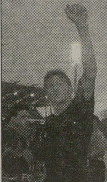
შტუტგარტი ვოლფსბურგი და ნანატრი მოგება უხარია

რეპრეზენტაციის მატჩები ევროპის ჩემპიონატის ფარგლებში გაიმართა. პირველი მატჩი გერმანია-სლოვაკია გაიმართა. გერმანია 2:1 სლოვაკიას დაამარცხა. მატჩი 15 წუთში დასრულდა, პირველი გოლი გერმანიის მწვერვალურმა ნახევარდელმა კარლსონმა გაიტანა. მატჩი 15 წუთში დასრულდა, პირველი გოლი გერმანიის მწვერვალურმა ნახევარდელმა კარლსონმა გაიტანა. მატჩი 15 წუთში დასრულდა, პირველი გოლი გერმანიის მწვერვალურმა ნახევარდელმა კარლსონმა გაიტანა.