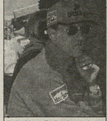
შუმი ჩრდილში მიექცა პირველ რბოლას ბოქსებიდან უყურა

საბოლოოდ, მრბოლები სტარტზე ასე განლაგდნენ: პაკინენი (მაკლარენი) 1:30,010; კულპარი (მაკლარენი) 1:30,053; მ. შუმახერი (ფერარი) 1:30,767; ვილნევი (უილიამსი) 1:30,919; პერბერტი (ზაუბერი) 1:31,284; ფრენცენი (უილიამსი) 1:31,397; ფიზიკელა (ბენეტი) 1:31,733; ირვინი (ფერარი) 1:31,767; რ. შუმახერი (ჯორდანი) 1:32,392; პილი (ჯორდანი) 1:32,399; ვურცი (ბენეტი) 1:32,726; ალფი (ზაუბერი) 1:33,240; ტაკაჯი (ტირელი) 1:33,291; ბარჩელი (სტიუარტი) 1:33,383; ტრული (პროსტი) 1:33,739; სალო (ეროუსი) 1:33,927; ტურერი (მინარდი) 1:34,646; მაგნუსენი (სტიუარტი) 1:34,906; როსტრი (ტირელი) 1:35,119; პანი (პროსტი) 1:35,255; ნაკანი (მინარდი) 1:35,301.