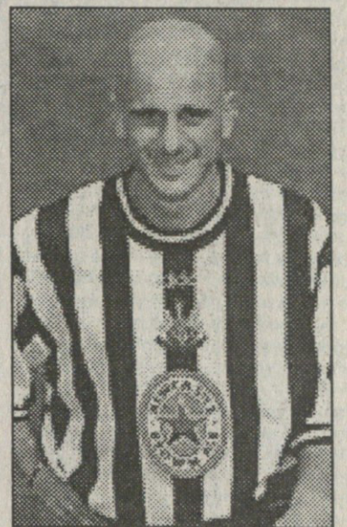
თემურმა ისევ გაიტანა

დავლგოში კარგ ხასიათზე გახლდათ. ან კი რატომ უნდა ყოფილიყო ცუდ გუნებაზე, რიცა გუნდმა კიდევ ერთი ნაბიჯი გადადგა თასისკენ.