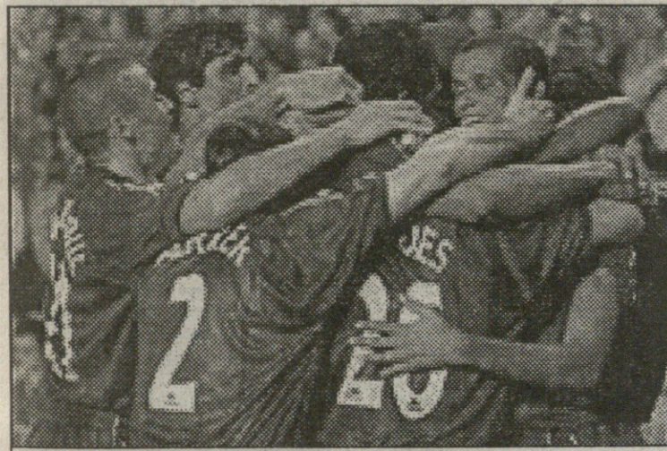
ვივა, კატალონი! — „ბარსელონამ“ „რეალს“ მოუგო

როგორც ამასწინათ არჩილმა, გუმინ შოთამაც საუბარი ისე არ დამამთავრებინა, რომ არ ეკითხა, ნაკრების ამხანაგური