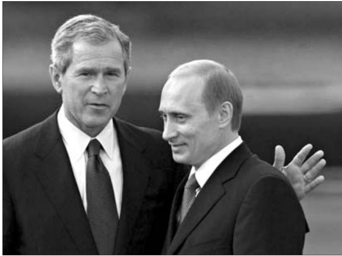
ჯორჯ ბუში და ვლადიმირ პუტინი.