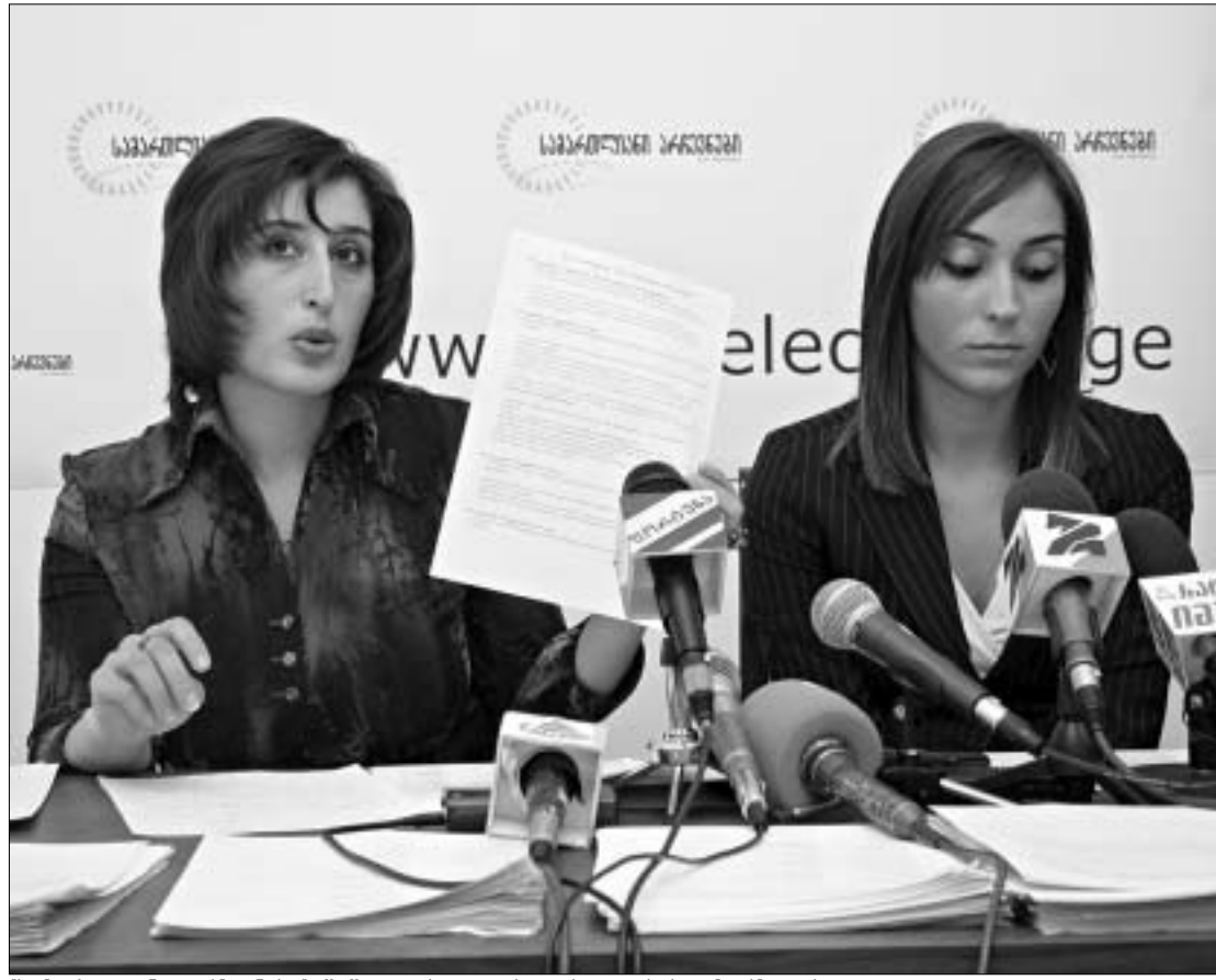
"სამართლიანი არჩევნები" შემოთავაზებულია ხელისუფლების უმოქმედობით.