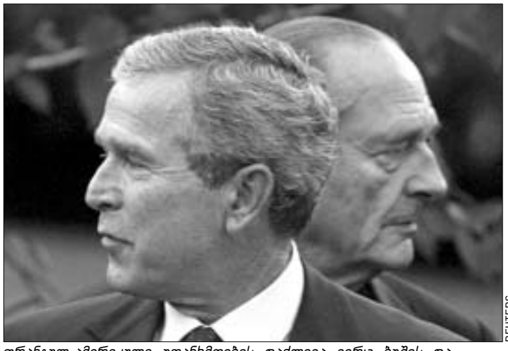
ფრანკულ-ამერიკული უთანხმოების დაძლევა ვერც ბუშის და შირაკის კერძო შეხვედრამ შეძლო.

გაერო-ს გენერალური ასამბლეის სხდომაზე გამოსვლისას აშშ-ს პრეზიდენტმა ჯორჯ ბუშმა ერთგვარი კოალიციის ჯარების მოქმედება კიდევ ერთხელ გაამართლა. „ კოალიცია შედეგობის დაცვის ინტერესებში მოქმედება და ამის წყალობით ერაყი დღეს თავისუფალია. გენერალურ ასამბლეას გაითავსებულელებული წარმოადგენელიც ესნდება, “ - განაცხადა ბუშმა. ამასთანავე, მან კიდევ ერთხელ მოუწონა გაერო-ს სევერ ქვეყნებს ომის შემდგომი ერაყის რეკონსტრუქციის საქმეში აქტიური მონაწილეობისაკენ. რაც შეეხება ერაყში დამოუკიდებელი მთავრობის შექმნას და ქვეყნის სუვერენიტეტის აღდგენას, ბუშმა განაცხადა, რომ ეს პროცესი არც ძალიან ნელა და არც ძალიან სწრაფად არ უნდა წარიმართოს. თერთი სახლის მეთაურმა განაცხადა, რომ ერაყი დემოკრატიის გზაზე დგას და პალესტინელებმა მათ მთავალით უნდა მიზამონ.