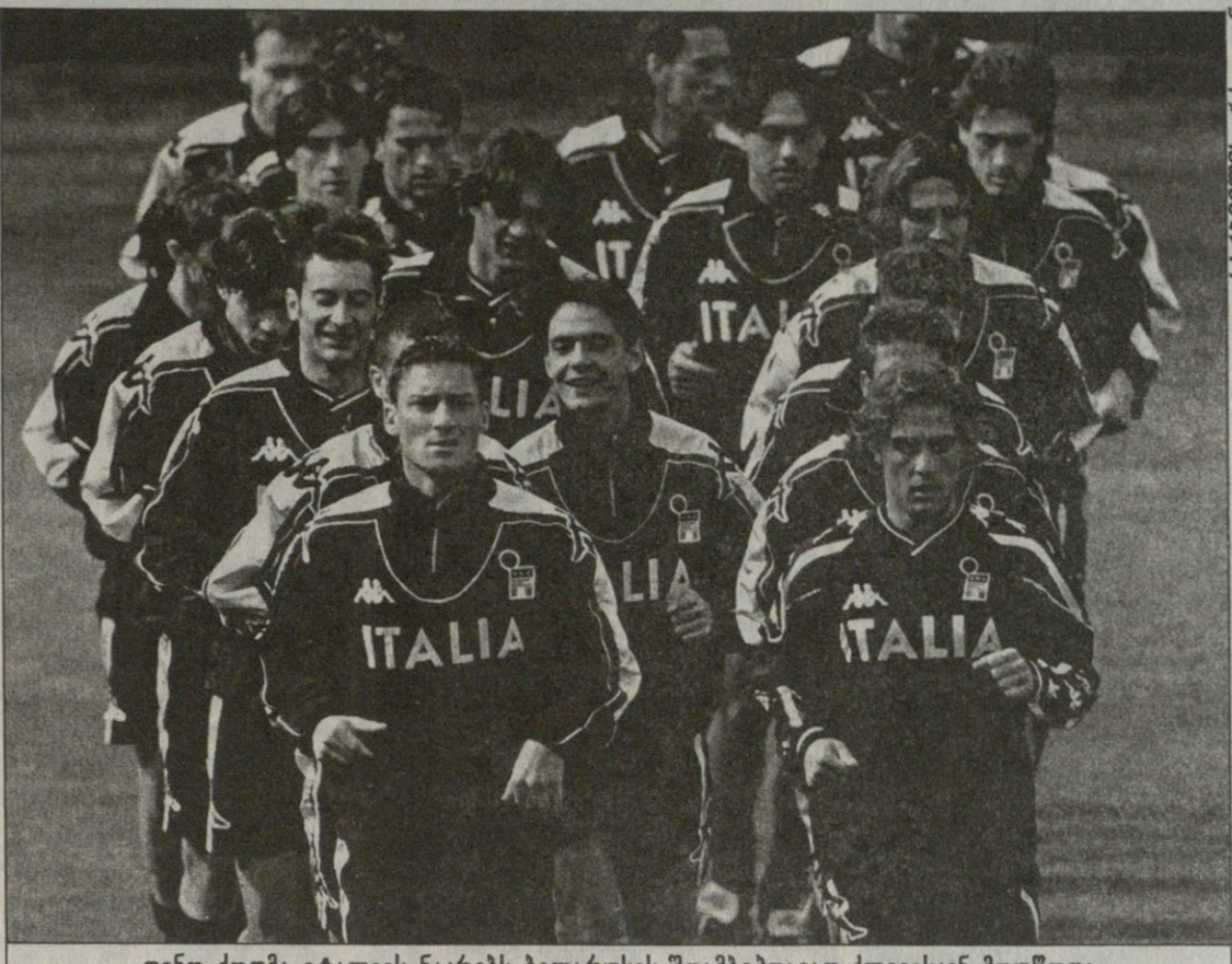
დინო ძოფმა იტალიის ნაკრებს ბელარუსის შთამბეჭდავად ძღვევისკენ მოუწოდა