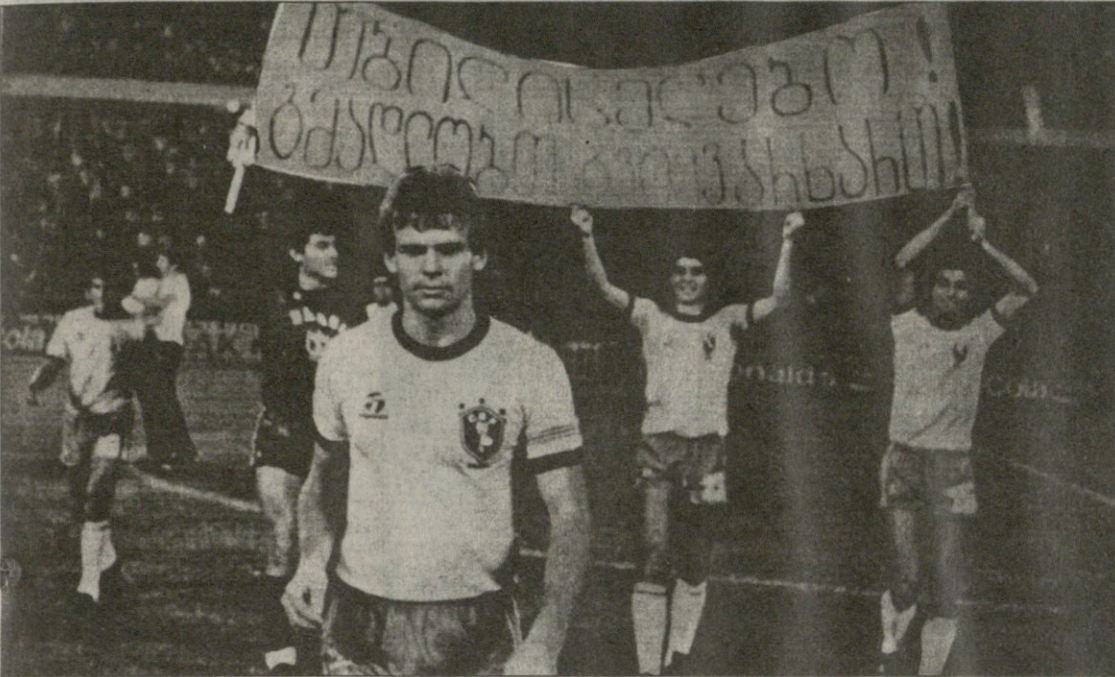
1985 წელი. ბრაზილიის ნაკრები მსოფლიოს ჩემპიონატის მეოთხედფინალის შემდეგ

საგარეო ურთიერთობების მინისტრის განცხადებით