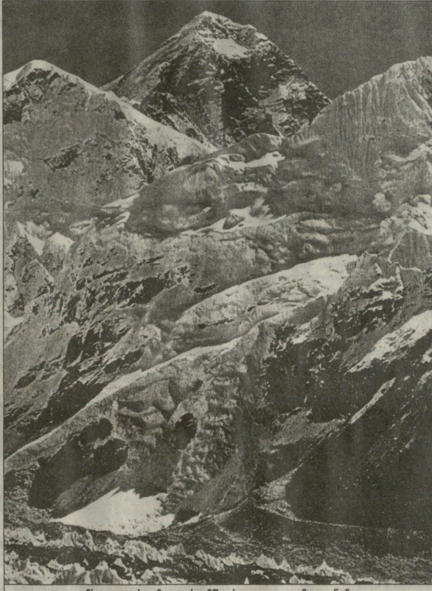
მსოფლიოს უმაღლესი მწვერვალი — ჯომოლუნგმა