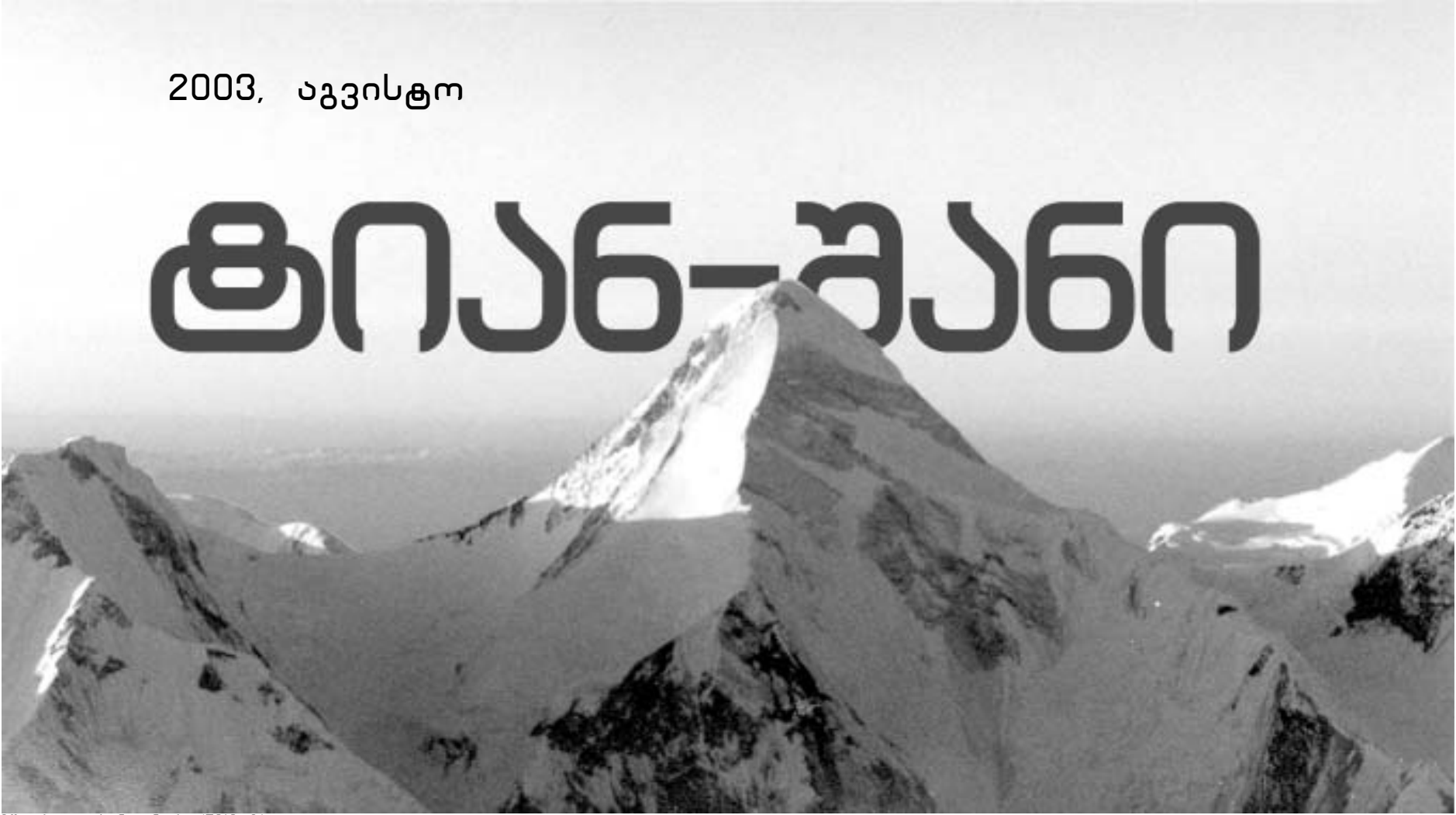
მწვერვალი ხან-ტენგრი (7010 მ)

30-40 წლის წინ პრეფექსიდან აქამდე ქარავანს თვენახევარი სჭირდებოდა ამოსასვლელად.