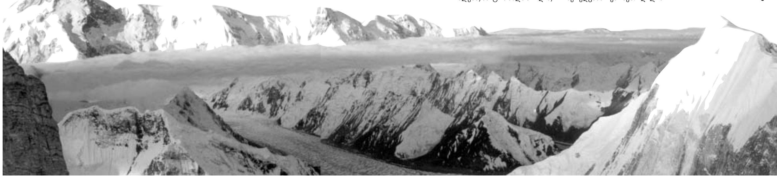
გამარჯვების პიკი, ვაჟა-ფშაველა, ნერუ.