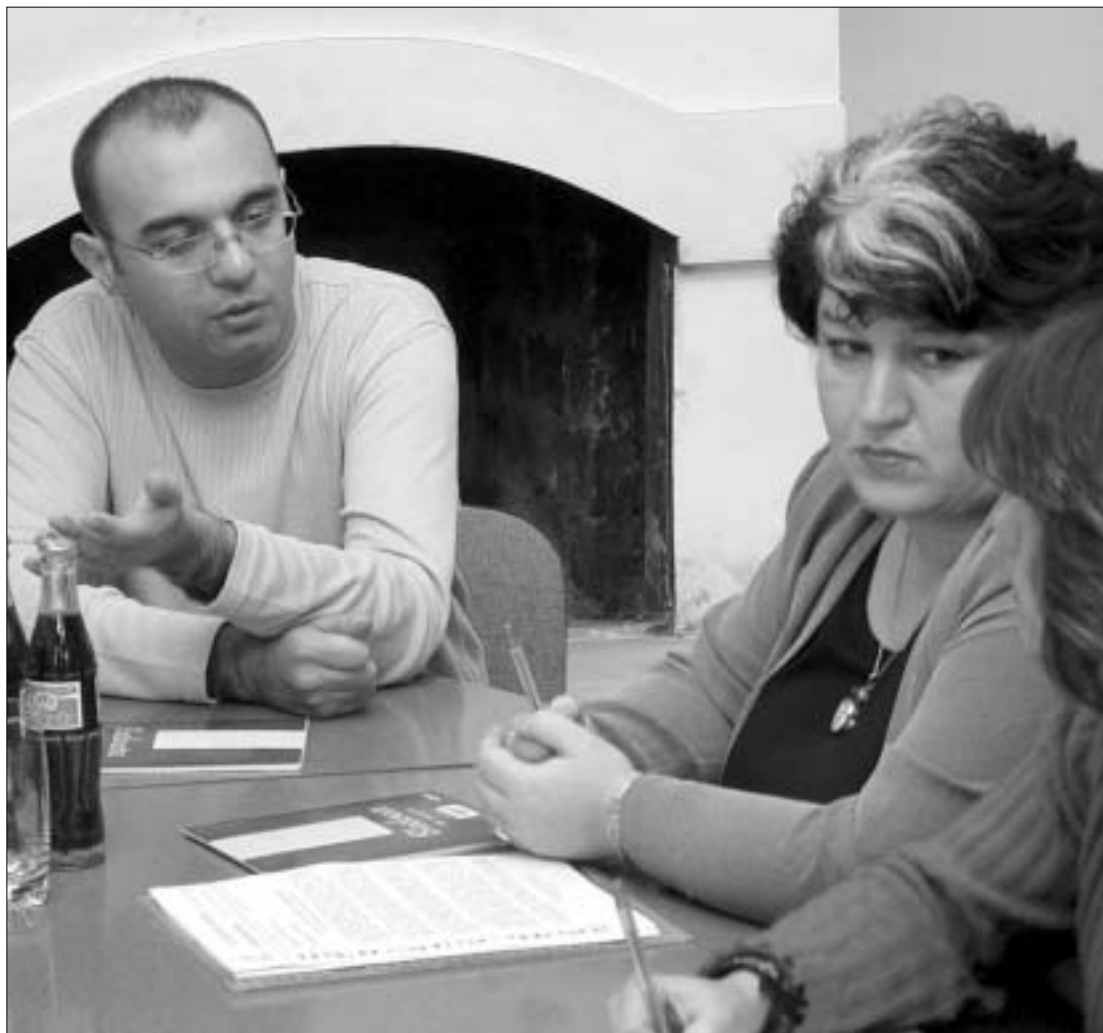
“თავისუფლების ინსტიტუტი” “სოლიდარობის” სოლიდარულია.

ჯარო ინფორმაცია არც N1 ქსპერიმენტალურმა სკოლამ არ წარმოადგინა. ამის მიუხედავად, პროექტის განმახორციელებელ ჯგუფს მაინც გაურკვეველია, რომ აღნიშნულ სკოლას არა აქვს ლიცენზია, ე.ი უკანონო. იგი სახელმწიფო დანესტელებთან და ფინანსდება ბიუჯეტიდან. თუმცა, ამის მიუხედავად სკოლაში დანესტელებია სასამართლოდ ერთჯერადი-100 ლარი, ხოლო ყოველიოთურად-15 ლარი მოსწავლეზე. გადასაცემა მოითხოვა. უზუნავს სასამართლომდე მიხული საქმე ოქტომბრის თვეში დასრულდება.