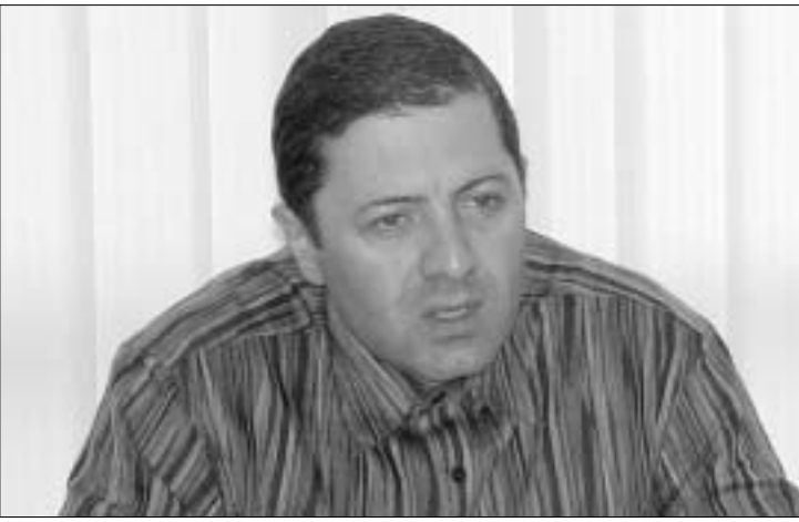
ჟორდანიას ახალი მწვრთნელის ვინაობას კერ არ ახებდას

- სატურნირო თვალსაზრისით, რუსეთში გამარჯვება ჩვენს ნაკრებს ვერავითარ სარგებელს ვერ მოუტანს. თუ რუსეთის ნაკრები გამარჯვებს, ქვეჯგუფში პირველ ადგილს თუ არა, პლეიოფის საჯგუფო მაინც მიიღებს. ასეთი სიტუაციის გამო ხმა დაირჩა, რომ ჩვენი გუნდი მოსკოვში 3-ქულიანი ხონინი მიემგზავრება... - ასეთი დონის ნებისმიერ მატჩს, როდესაც მსგავსი სატურნირო სიტუაციაა შექმნილი, ყოველთვის თან ახლავს ეჭვები. თუმცა, მინდა კატეგორიულად განვაცხადო, რომ საქართველოს ნაკრები მთელი სერიოზულობით და პასუხისმგებლობით მოემზადება ამ თამაშისთვის. მიუხედავად იმისა, რომ ჩვენი ძალიან პრესტიჟულია და, გარანტუდებით, ყველა ფეხბურთელი ამ მატჩს ისე მოუდგება, როგორც ქართული ფეხბურთის ყველა ვაჟსემატკივარი მოელოს.