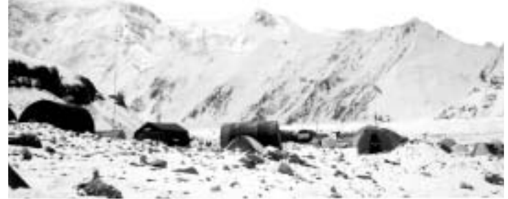
45 წთ-ში მყინვარ ენილჩეკზე ვართ, საბაზოში. 30-40 წლის წინ პრეფექსიდან აქამდე ქარავანს თვენახევარი სჭირდებოდა ამოსასვლელად.

უძირო ნაპრალებზე გვიწევს გადახტომა, ან თოვლის თხელ ხიდებზე ფორთხვით გადასვლა. კარგი იქნებოდა, ახლა რომ თოვის პატარა ნაგლეჯი მაინც გვექონდეს თან, დაცვისთვის. 1994 წელს, 70-იანი ნაპრალიდან ყარაგანდელი მთამსვლელი ვერც კი ამოიღეს. ნაპრალი ფართო იყო, კიბის გადაბა გვექონდა გადაწყვეტილი. დროებით თოკი დავამაგრეთ. ყარაგანდელი არ ჩაება, მხოლოდ ხელი ჩაავლო. მონყვეტის მერე რამდენიმე წუთი