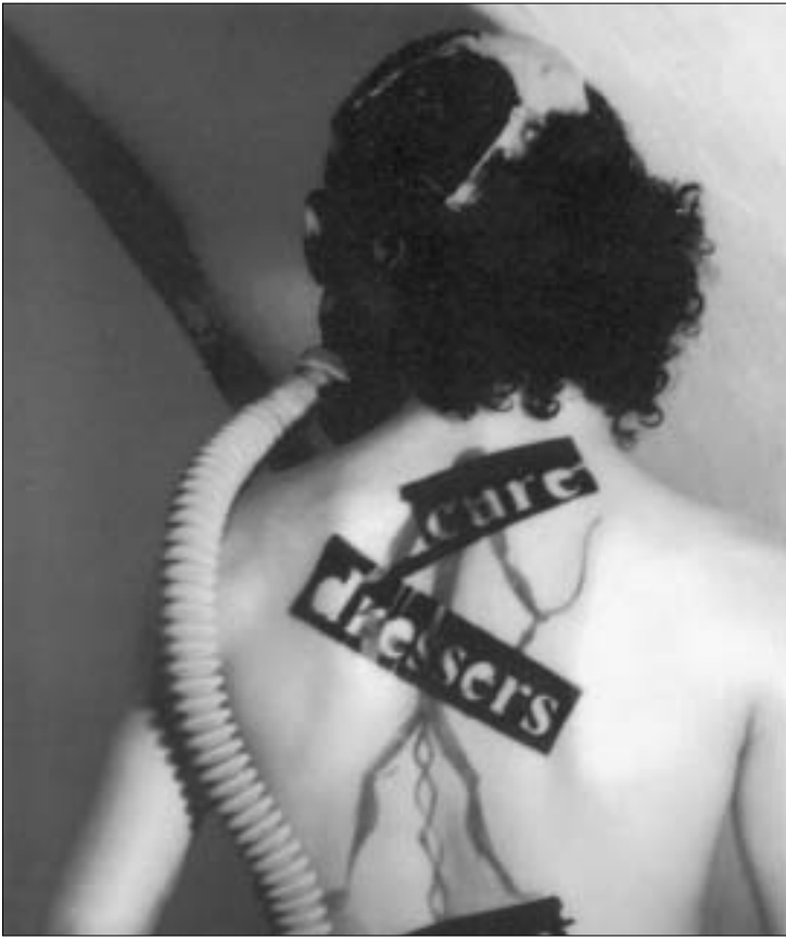
ილია ზაუტაშვილი, აღმოსავლეთი - დასავლეთი