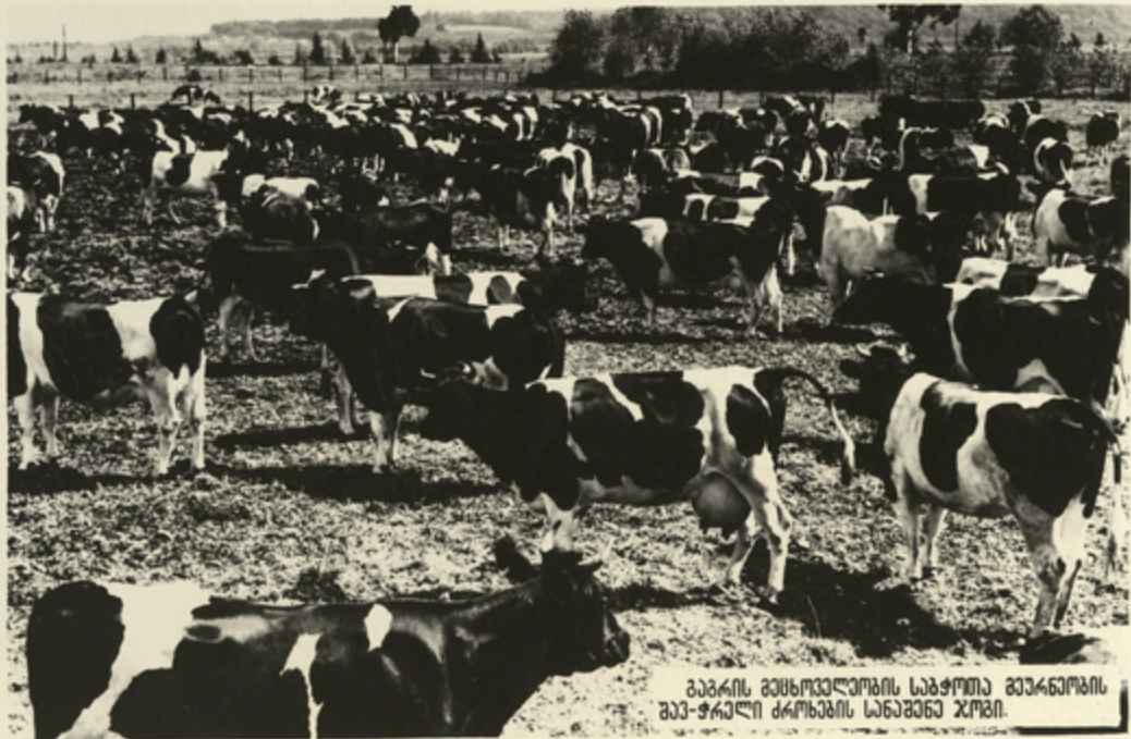
გაგარის მესხოვლეოვის საზოთთა მუარნოვის მუ-ჭრალი კრონების სანაშენე ჯოში.

პარკიის ღონისძიებებში სულ უფრო მეტი ადგილი ეთმობა მესხოვლეოვის შექმნის განვითარებას. მიმდინარეობს დაკაბული მუშაობა პირუჭყვისა და ურინველის კროლე-ჯიულოვის აგალეებისათვის, მათი სულადობის ზრდისათვის, გალე დანიყება მესხოვლეოვის თანამიმდევრული გადაყვანა სემრინველო საუზუკველზე.