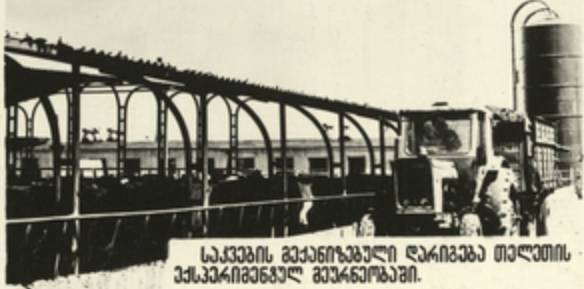
სკკვის გეგმგეული ღარიგბა თალითის ვესკარიგვგულ გეგმგეული.