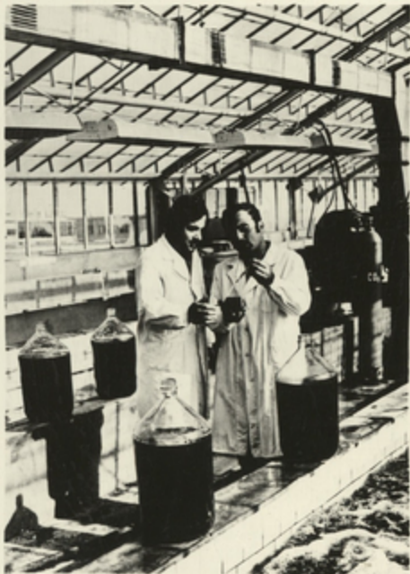
ქლოკლას სუპენსიის საბჰკოში ბიოლინა- რაობს ყუათიანი სილოვანი სკკვის გეგმგება.