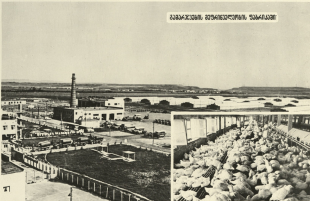
ბაბარჯევის მეურნეობის უბრიაში

განუხრალად ვითარდება სოფლის მეურნეობის ყოველგვარი ინჟინერიული და მისი მეგარილურ-გაქნიური ბაზის შემდგომი განვითარების. მესხიარების მიღწევათა უარყო გამოყენების ქარსი.