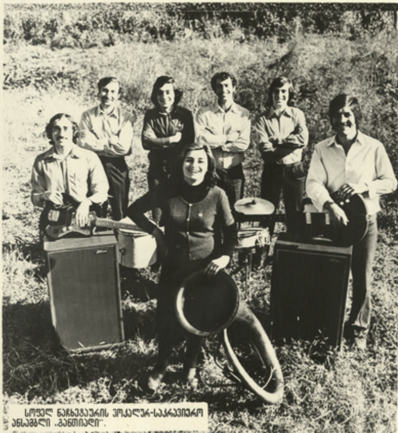
სოფელ ნაჩხავაზის უკალკ-საკავშირო ანსაგლი „განთიარი“.