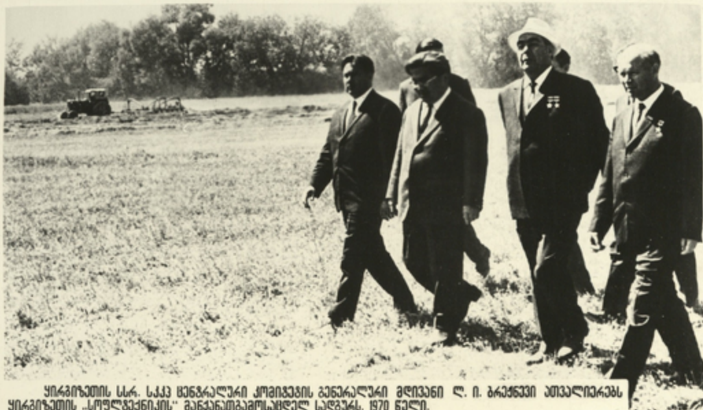
ყირგიზეთის სსრ. სკკპ მხარეაღმშენებლის კომიტეტის გენერალური მდივანი ლ. ი. ბრეჟნევი ათვალისწინებს ყირგიზეთის „სოფლმშენიკის“ განაწესებამოსაზღვრულ საღვჯას. 1970 წელი.