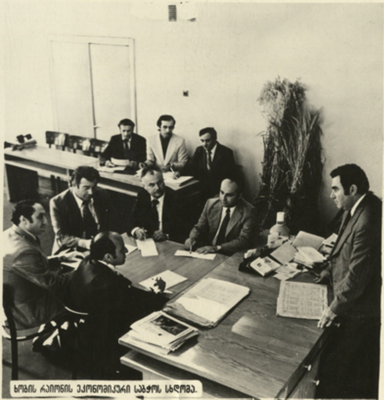
სოფლის მეურნეობის ეკონომიკური საბჭოს სხდომა.