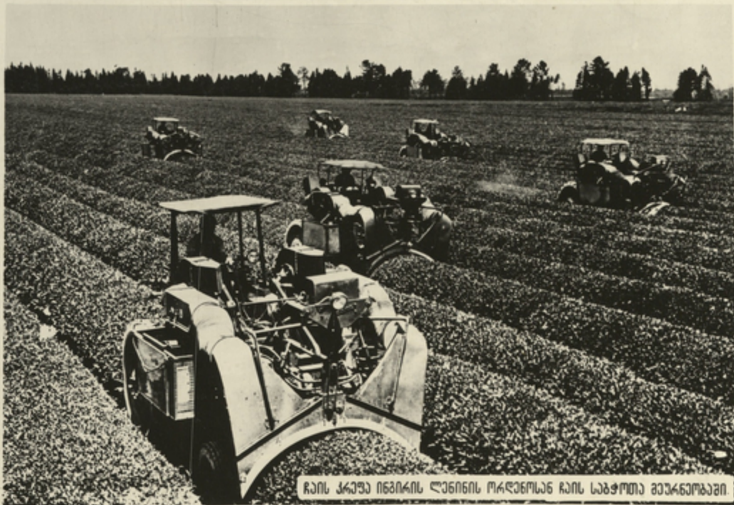
ჩაის ქაფა იმპიის ლენინის ორდენისა ჩაის საბჭოთა მწარმოებელი

საქართველო ჩაის ძირითადი მწარმოებელი საბჭოთა კავშირში. რესპუბლიკის ღირსების, პრესტიჟის საქმეა მივაღწიოთ არა მარტო წარმოებული ჩაის მოყვანის ბაზრებს, არამედ უზრუნველყოთ მისი ხარისხის გვეტერი გაუმჯობესება.