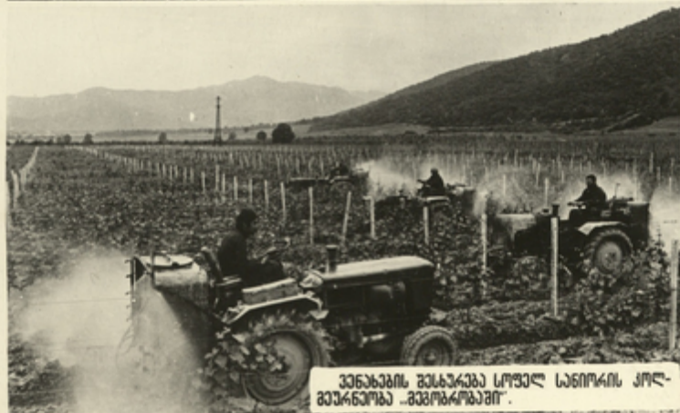
კულტურების მოსავლიანობა სოფელ სანთის კოლ- ხეობაში „მედიკალიზაცია“.