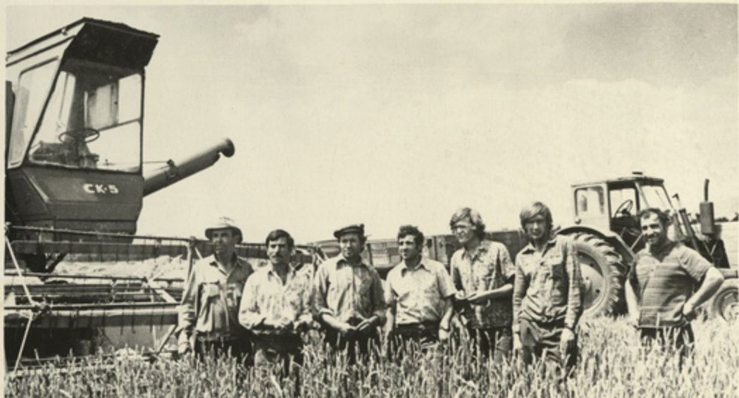
საბარაქოს რაიონი. გეგეი თავი იხახლა ი. სახოლუჩის (გარახნიდან გესაგი) ყოგელქესურმა გრიგაგამ. ამ ურთულქვენი ქოლქვიჩის თითოეულმა წვერმა ქვე- ვარგა 28-28 ხანგნარი გარცხელელი გალენა.

ქვეყანაში სოციალურ-საეკონომიკური ღონისძიებით მთელი სიღრმე- და. როგორც მიზანია ხალი გუფონ ქვეყნის სიღრმე უზრუნველყოფას სასურსათო და სასოფლო-სამეურნეო ნაღველით და ქალაქისა და სოფლის სხოვრების გავრცელები და ქალგურულ-საყოფასხოვრებო პირობების სულ უფრო გეგ დაახლოებას.