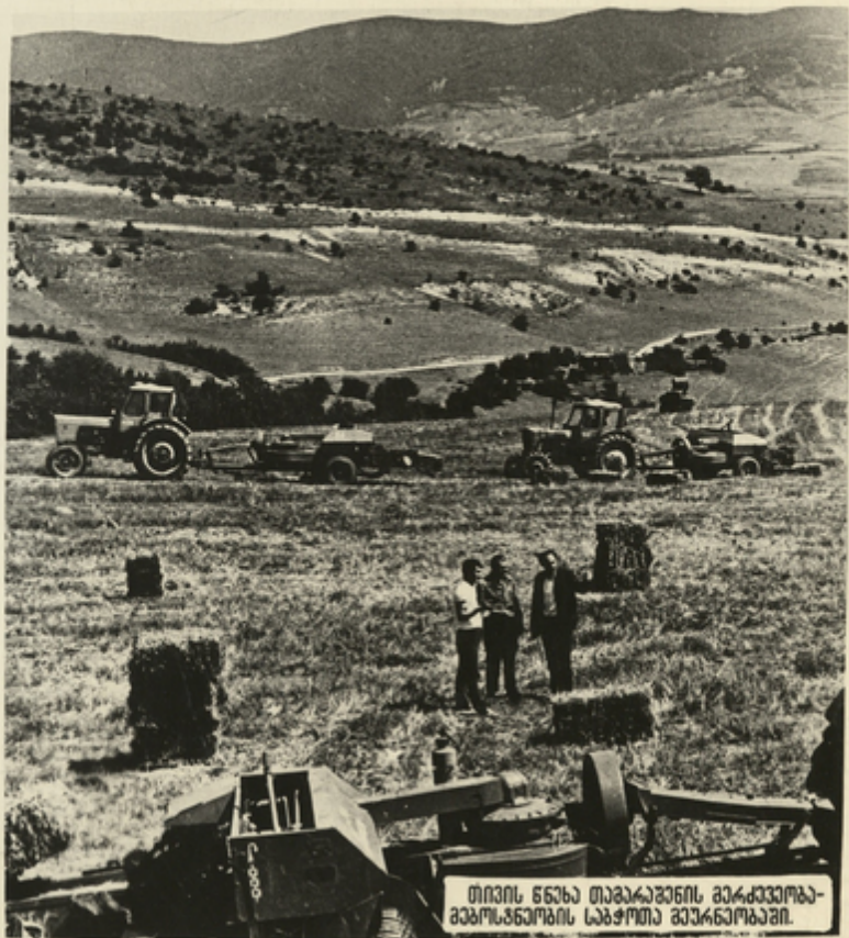
თივის ნახე თაბაგაშენის მექანიკური მანქანათმშენებლის საბჭოთა მეურნეობაში.

პარტია მოგვინოვლებს, რომ გავუუმჯობესოთ საქვეზნარყოფა. შევიქმნათ თითოეულ მეურნეობაში მეცხოველეობის სიძველე. გვკიცხე საქვეზნის გზაზე.