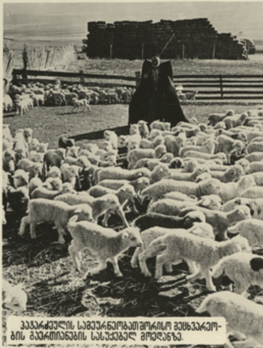
პეპარკეულის საგეარნობათმორისო გეგეარკო- ბის გეარტიანების სასეპეებელ გოღღანა.

სკკ სენგრაღური კომიზეში გელა ზეუნსებას აძლავს საგეარნობათმორისო კო- ოპერაციისა და აგროსაგეარნო ინგეგრაშიის ბაზაზე სასოფლო-საგეარნო წარმოების სეპეილიზაციისა და კონსენგრაშიის უღიღეს ეკონომიკურ და სოშიალურ გნიშვნელობას.