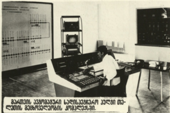
გარტის ვგომგზარი სარსუვგარო კული თა- ლითის გეგმგელოვის კოგვლესი.