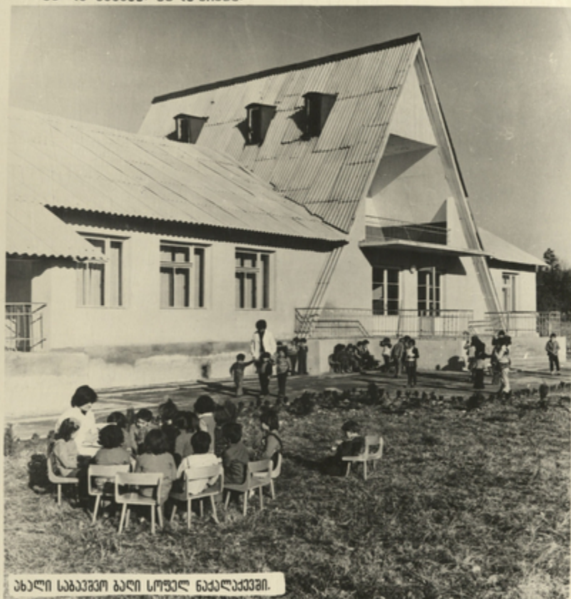
ახალი საბავშვო ბაღი სოფელ ნაქალაქებში.