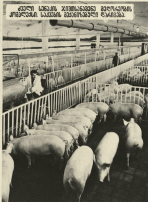
ქველი სენაქის ჯიშისნაგეარნო გელოკოგის კოგეღესი. საკეგის გეარნიზებელი ღარიგება.