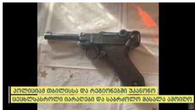
პოლიციამ თბილისსა და რეგიონებში უკანონო ცეცხლსასროლი იარაღები და საბრძოლო მასალა ამოიღო

14 წლის წინ, 2008 წლის აგვისტოში, საომარი მოქმედებების დროს, შინაგან საქმეთა სამინისტროს 14 და