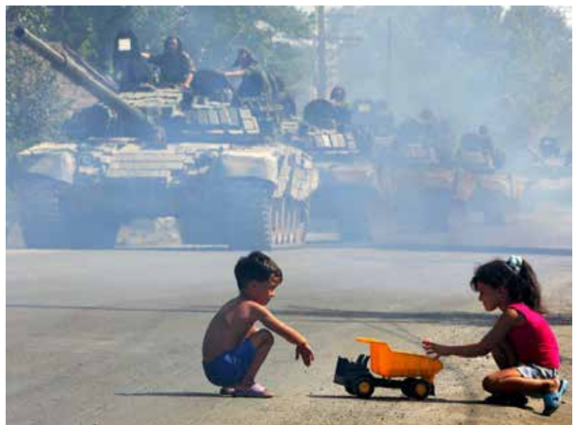
დასასრული მე-6 გვერდზე

რაც შეეხება ჰააგის სასამართლოს, იცით, რომ სანქციები გაიცა და ძებნა გამოცხადდა 2008 წლის ომის მონაწილეებზე, მაგრამ სამართლებრივად, რაღაც მომენტებში, იქაც არასწორი გზით წავედით.