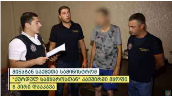
შინაგან საქმეთა სამინისტრომ „ქურდულ სამყაროსთან“ კავშირში მყოფი 8 პირი დააკავა

„ქურდული სამყაროს“ წევრობის, „ქურდული სამყაროს“ წევრისთვის მიმართვისა და „ქურდული სამყაროს“ საქმიანობის მხარდაჭერის ფაქტებზე გამოძიება საქართველოს სისხლის სამართლის კოდექსის 223-ე პრიმა მუხლის პირველი ნაწილით, 223-ე მე-3 პრიმა მუხლის მე-2 ნაწილით და 223-ე მე-4 პრიმა მუხლის პირველი ნაწილით მიმდინარეობს.