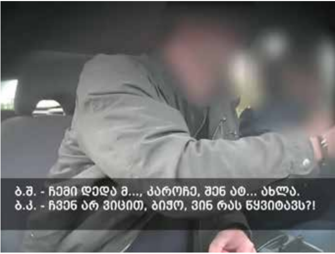
ბ.შ. - ჩემი დედა მ..., კაროჩა, შინ აბ... ახლა. ბ.პ. - ჩვენ არ ვიცით, გიჟო, ვინ რას წყვიტავს?!

შინაგან საქმეთა სამინისტროს ცენტრალური კრიმინალური პოლიციის დეპარტამენტის ორგანიზებულ დანაშაულთან ბრძოლის მთავარი სამმართველოს დამნაშავეთა სამყაროს წინააღმდეგ ბრძოლის სამმართველოს თანამშრომლებმა, მთავარ პროკურატურასთან ერთად ჩატარებული კომპლექსური ოპერატიული და საგამოძიებო ღონისძიებების შედეგად, მოქალაქეთა შორის არსებული ფინანსური დავის „ქურდული წესით“ გარჩევის ფაქტები გამოავლინეს და მოსამართლის განჩინების საფუძველზე, თბილისში, ქიათურასა და საჩხერეში რვა პირი დააკავეს.