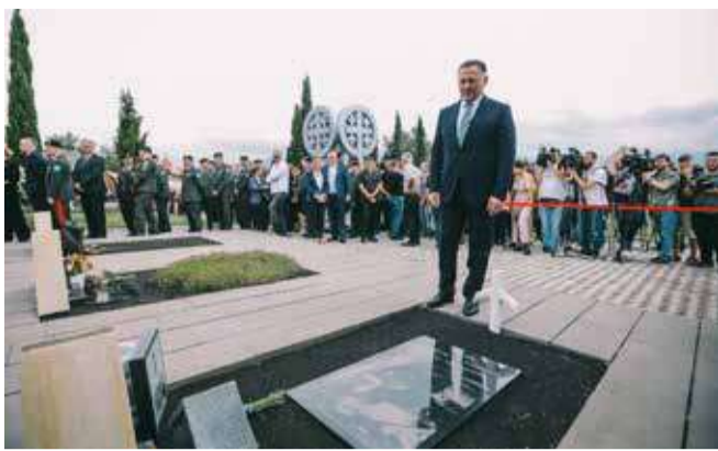
სანაპირო დაცვის 5 თანამშრომელი დაიღუპა.

14 წლის წინ, რუსეთ-საქართველოს ომის დროს, შინაგან საქმეთა სამინისტროს 14 და სანაპირო დაცვის 5 თანამშრომელი დაიღუპა. ვახტანგ გომელაურის გადაწყვეტილებით, დაღუპული თანამშრომლების შეილებსა და ოჯახებს, ტრადიციულად, მატერიალური დახმარება გაენიათ.