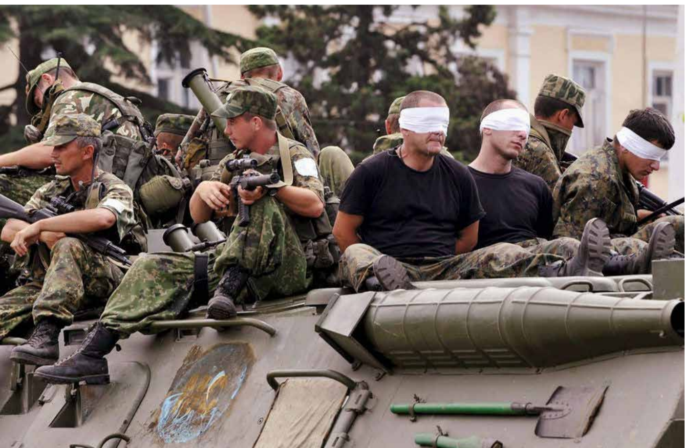
ბოლო დღეებში აგვისტოს ომი

პარალელურად, მწვავდებოდა ვითარება ცხინვალის რეგიონში. ქართული სოფლების დაბომბვა თითქმის ყოველდღე მიმდინარეობდა. 30 ივლისს, რუსეთის საგარეო საქმეთა მინისტრომ საგანგებო განცხადება გაავრცელა, რომელშიც ნათქვამი იყო, რომ საქართვე-