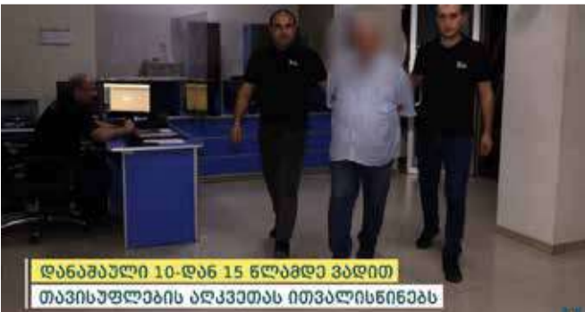
დანაშაული 10-დან 15 წლამდე ვადით თავისუფლების აღკვეთას ითვალისწინებს

შინაგან საქმეთა სამინისტროს თბილისის პოლიციის დეპარტამენტის დიდუბე-ჩუღურეთის მთავარი სამმართველოს თანამშრომლებმა, ჩატარებული ოპერატიულ-სამძებრო ღონისძიებებისა და საგამოძიებო მოქმედებების შედეგად, 1942 წელს დაბადებული თ.ბ., განზრახ მკვლელობის მცდელობის ბრალდებით, თბილისში დააკავეს.