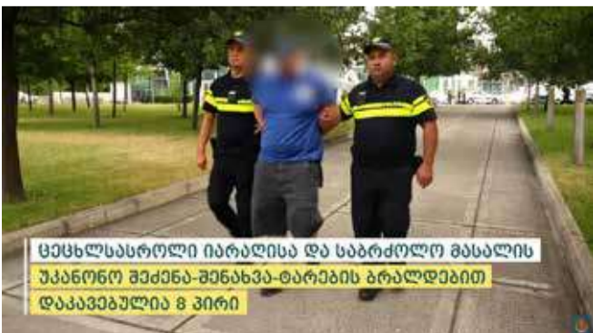
ცეცხლსასროლი იარაღისა და საბრძოლო მასალის უკანონო შექმნა-შენახვა-ტარების ბრალდებით დააკავებულა 8 პირი

ცეცხლსასროლი იარაღისა და საბრძოლო მასალის უკანონო შექმნა-შენახვა-ტარება ედება ბრალად აჭარის პოლიციის დეპარტამენტის თანამშრომლების მიერ დაკავებულ, წარსულში ნასამართლევი, 1974 წელს დაბადებულ რ.დ.-საც. სამართალდამცველებმა, ბრალდებულის პირადი ჩხრეკის შედეგად, ნივთმტკიცების სახით ამოიღეს ცეცხლსასროლი პისტოლეტი და 11 საბრძოლო ვაზნა.