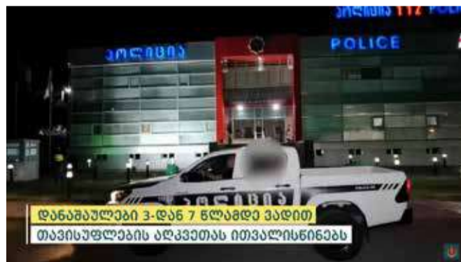
დანაშაულები 3-დან 7 წლამდე ვადით თავისუფლების აღკვეთას ითვალისწინებს

დაღუპულნი 3-დან 7 წლამდე ვადით თავისუფლების აღკვეთას ითვალისწინებს.