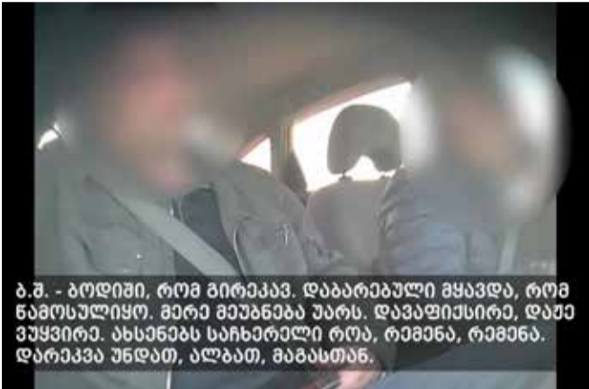
ბ.შ. - გოდიო, რომ გირაკავ. დაბარებული ყავდა, რომ ნამოსულიყო. მირა მუხანაბა უარს. დავაფიქსირა, დავა ვწყვიტა. ახსენებს საჩხერელი რთა, რემენა, რემენა. დარაკავა უნდათ, ალბათ, გაბასტა.

კომპლექსური გამოძიებით დადგინდა, რომ ბრალდებულები – „ქურდული სამყაროს“ წევრები და „ქურდული სამყაროს“ საქმიანობის მხარდაჭერები, აქტიურად მონაწილეობდნენ სხვადასხვა დანაშაულებრივ საქმიანობაში. ისინი, მოქალაქეების მიმართვის საფუძველზე, მოდავე მხარეებს შორის არსებული ფინანსური დავების მოგვარების, სადავო საკითხების „ქურდული წესების“