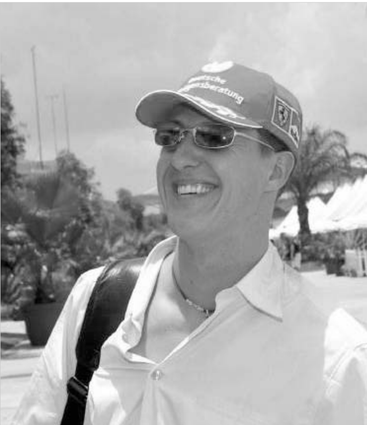
შენახერი ფორმულა 1-დან წასვლას არ აპირებს

ზოგიერთი სპეციალისტის აზრით, "ფერარის" გერმანულ-ოტოს მისიონერს, არ სურს სამეფო რბოლიდან წასვლა, რადგან, უბრალოდ, ვერ წარმოუდგენია, რა უნდა აკეთოს კარიერის დასრულების შემდეგ.