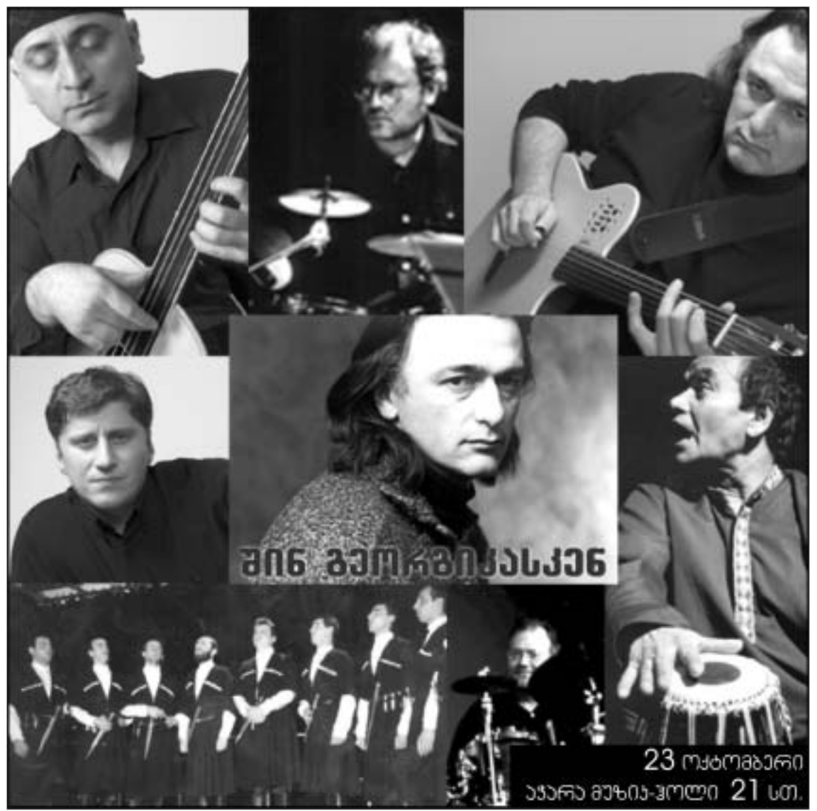
მინ გარსკვლავისკენ 23 ოქტომბერი აქარა მუხიან-პოლი 21 სთ.

ის დროს ძალიან გაუჭირდა, შეუგადაკლული თეატრალი, რომელიც შექმნილია "მეფე ლირზე" მიწვევით, საზოგადოების მიწვევით და აღიარეს. საზოგადოებაც ძანახავად, თუმცა მასზე მოხედვრა ყველას არ შეუძლია. საქმიანია, რომ მერიტაიმ პილის საზოგადოებრივი საპირფარეოში, დიდი-დიდი, ოც ადამიანს იტყვის: მაგრამ, ერთი მხრივ, ეს ძალიან კარგია. ამ გარემოების წყალობით, ბილეთის ფასების გაზრდა მოხერხდა. სწობები და გურმანები - თეატრალური - ამ "ექსკლუზიური" სანახაობისთვის არაფერს იმუშავებენ.