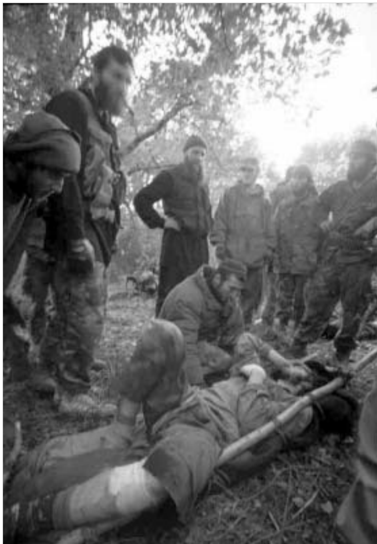
გელაევის რაზმი საომარი მოქმედებებს დროს.