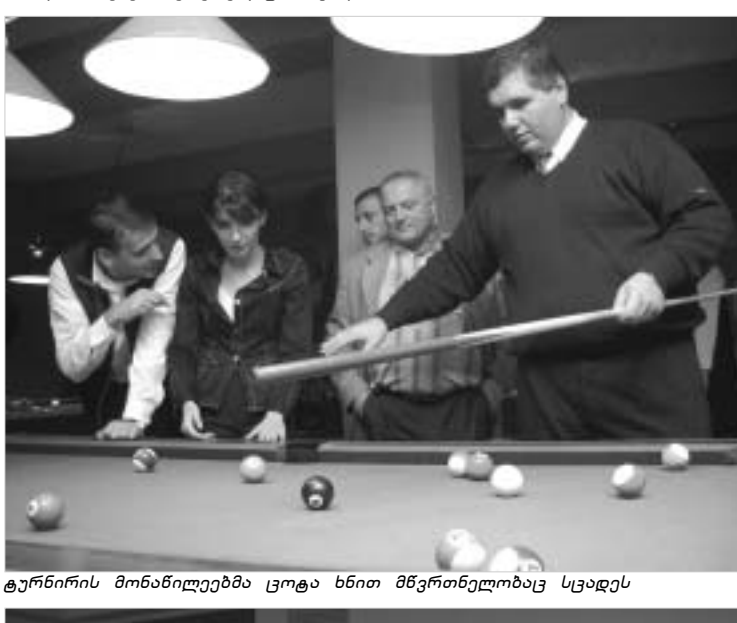
ტურნირის მონაწილეებმა ცოტა ხნით მწვრთნელობაც სცადეს