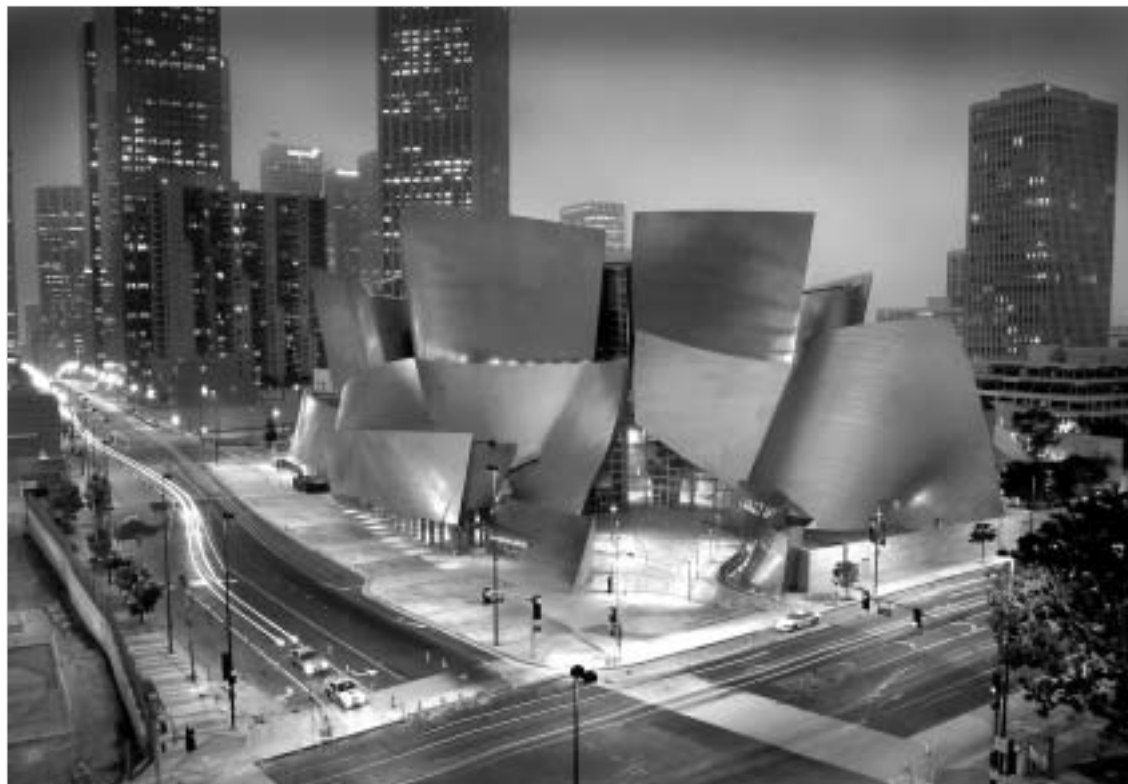
ლოს ანჯელესის ახალი დისნეის პარკი

პოლი ლოს ანჯელესის ფილარმონიის ორკესტრის ახალი სახლია. 1988 წელს კომპანია "დისნეი" პროექტის მთავარ არქიტექტორად ფრენკ გერი - ბილბაის გუგენჰაიმის მუზეუმის ავტორი აირჩია. მშენებლობა უოლტ დისნეის ქერივის ლილიან დისნეის პირველი გრანტი (50 მილიონი დოლარით) დაიწყო და სხვადასხვა დონორისგან შენარჩუნდა თანხებით გაგრძელდა. საბოლოო ჯამში, 15-წლიანი მშენებლობა 270 მილიონი დოლარი დაჯდა.