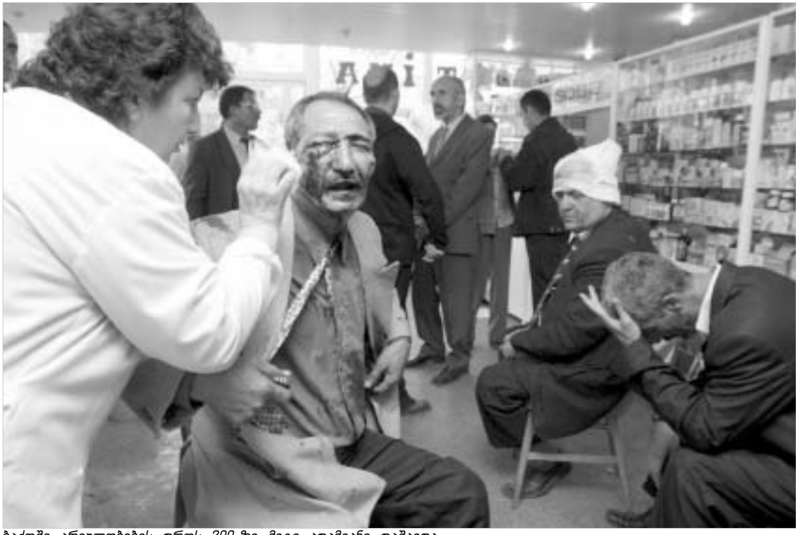
ბაქოში არეულობების დროს 300-ზე მეტი ადამიანი დაზარდა.