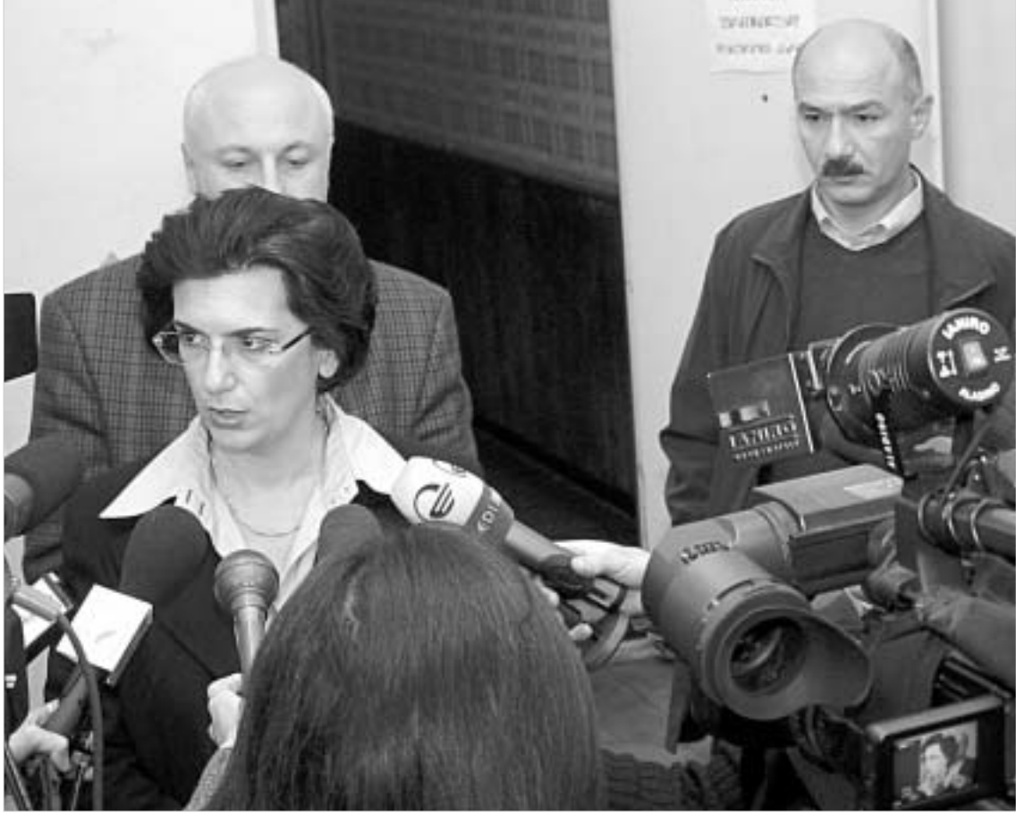
ნინო ბურჯანაძე და "დემოკრატები" ცესკო-ში არჩევნების გადაარჩენის წინადადებაზე ნარდგენენ.