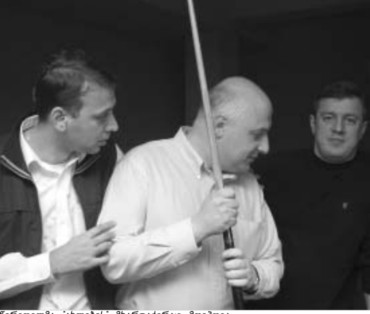
წერეთელმა "ახლების" მხარდაჭერაც მოიპოვა