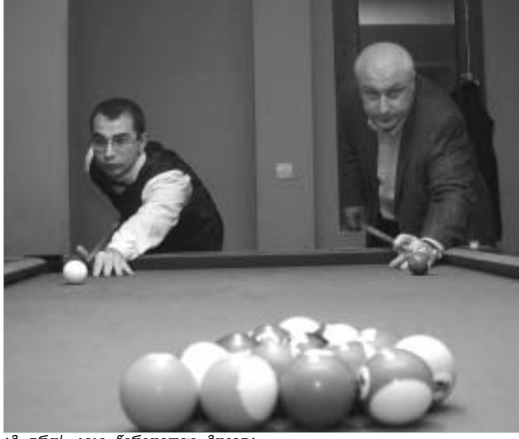
ამ დროს გიგი წერეთელიც მოვიდა...