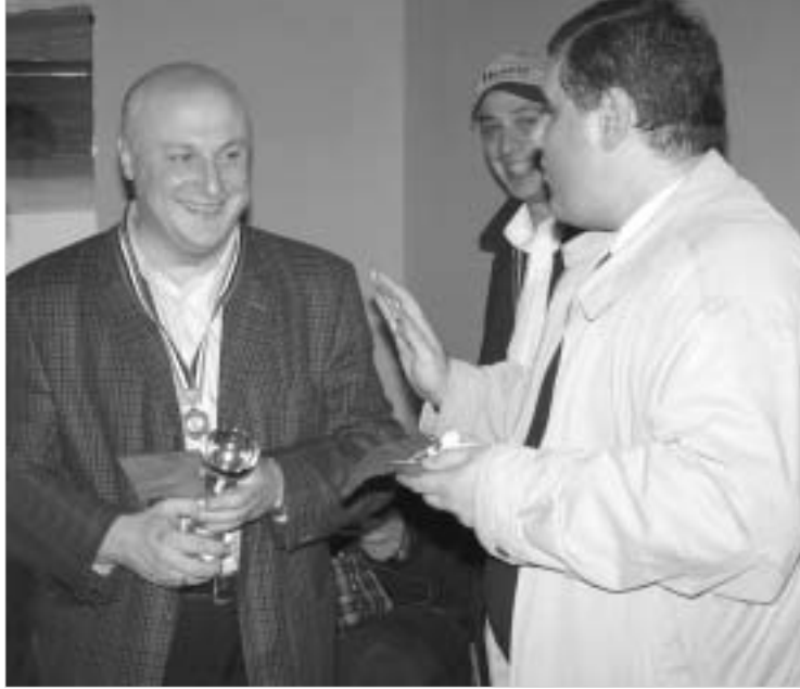
წერეთელი და დავითაშვილი ბოლოს მაინც შეთანხმდნენ