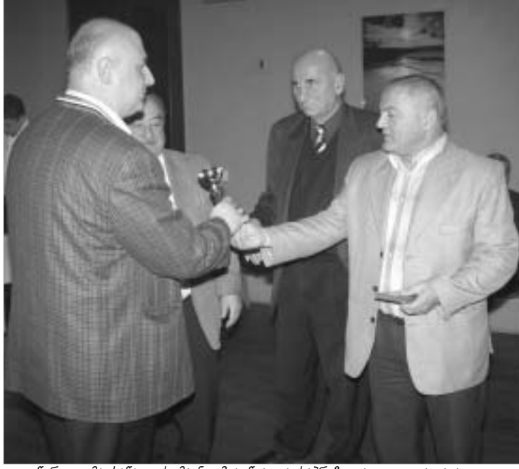
გიგი წერეთელმა სანადელს მიანიჭ მიღწეა და საპრტიო ადგილი დაიკავა