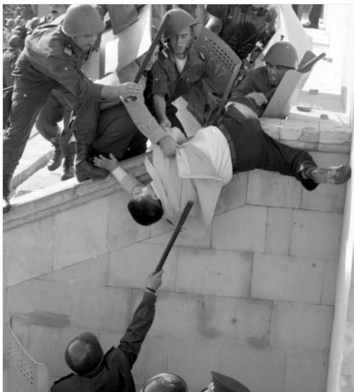
სისხლისღვრა ბაქოს ქუჩებში.

- ჩვენს მიერ ორგანიზებულ მიტინგებში, დაახლოებით, ათჯერ მეტი კაცი მონაწილეობდა, ვიდრე ის რაოდენობა, რაც ჩემს ამომრჩეულად არის ნაჩვენები. ჩემს მხარდა-