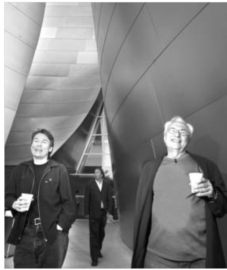
დირიჟორი ესა-პეკა სალონი და არქიტექტორი ფრენკ გერი რეპეტიციის მიმართებით