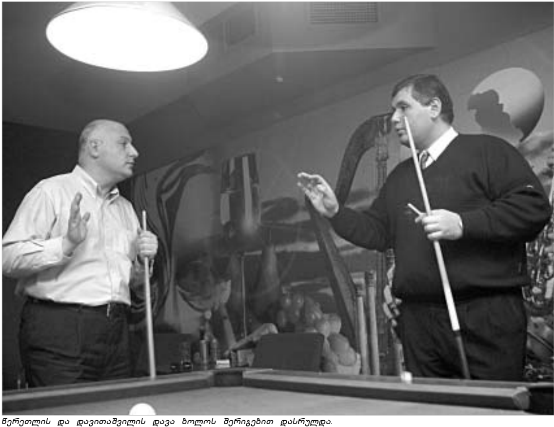
წერეთლის და დავითაშვილის დავა ბოლოს შერიგებით დასრულდა.