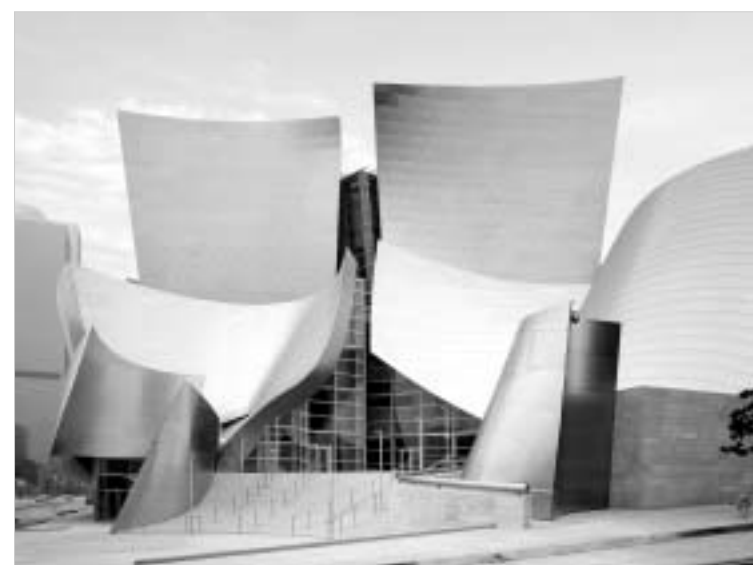
დისნეის საკონცერტო პოლი დისნეის შუქზე