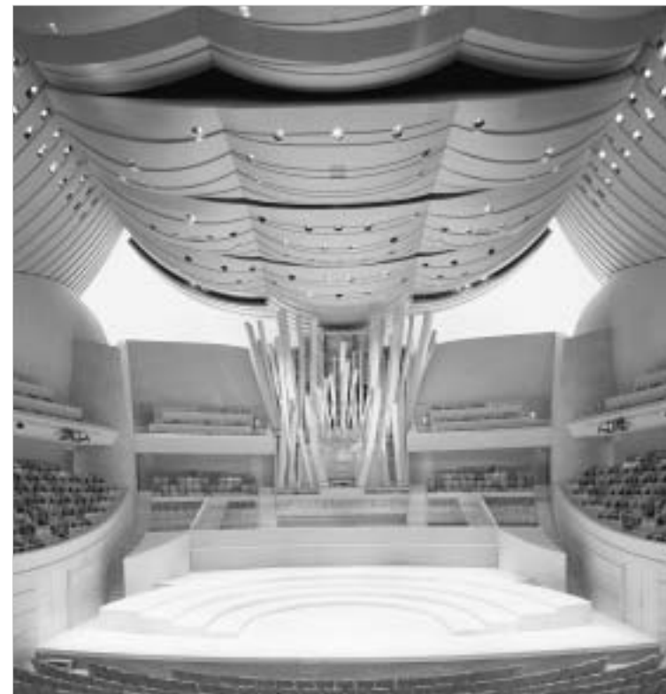
უნიკალური საკონცერტო დარბაზი ორლანის ფორში

არქიტექტორი დიდხანს უთანხმდებოდა სპეციალისტებს, კერძოდ კი, "ნაგაკა აკუსტიკის" წარმომადგენლებს დარბაზის სრულყოფილი აკუსტიკის შესაქმნელად და, როგორც ჩანს, მიზანს მიაღწია კიდევ. შენობის ოფიციალური ვებ-გვერდზე ვკითხულობთ: "ეს დარბაზი, აკუსტიკის თვალსაზრისით, ყველაზე კომპლექსური სტრუქტურისაა. იქ მუსიკის მოსმენას დღემდე მიღებულ ვერცერთ შთაბეჭდილებას ვერ შეადარებთ". ერთ-ერთი ჟურნალისტი კი დარბაზის შესახებ წერს: "ცხადია, დისნეის ცენტრის შესაძლებლობები მაყურებელმა თავად უნდა შეაფასოს. თუმცა, ის, რაც მე შემემთხვა, ამ გამოცდის ფრთაზე დასრულების წინაპირია გახლავთ: "რეპეტიციის დროს ბალ-