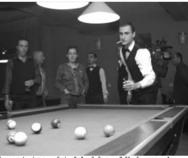
ოქდათხელ" აკა ტონიას გზაზე მომავალი ჩემპიონი გადაეღობა