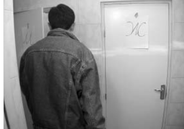
ტუალტი მრავალფუნქციური დანიშნულებით

თავისი თეორიული პოსტულატები ვეანსმა უკვე პრაქტიკულად განახორციელა. მან ამომწურავი სახელწოდების მქონე პიესა "ფესხალავი" ფესხალავში დადგა. აბა, სად უნდა დაედგა? საზოგადოებრივი ტუალეტია, მერიტაიმ პილზე, სან ფრანცისკოში. კრიტიკოსები ცხვირს სულაც არ იზრუნენ, რადგან მისი ნოვატორული სული შეიგრძნეს და აღიარეს. საზოგადოებაც ძანახავად, თუმცა მასზე მოხედვრა ყველას არ შეუძლია. საქმიანია, რომ მერიტაიმ პილის საზოგადოებრივი საპირფარეოში, დიდი-დიდი, ოც ადამიანს იტყვის: მაგრამ, ერთი მხრივ, ეს ძალიან კარგია. ამ გარემოების წყალობით, ბილეთის ფასების გაზრდა მოხერხდა. სწობები და გურმანები - თეატრალური - ამ "ექსკლუზიური" სანახაობისთვის არაფერს იმუშავებენ.