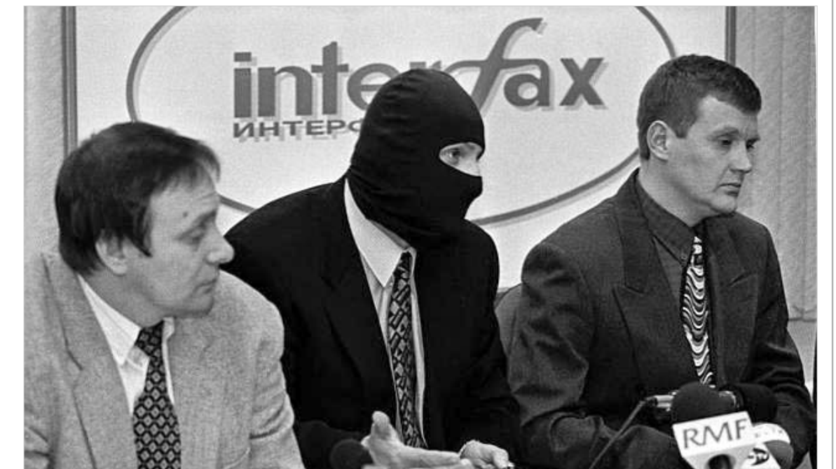
ალექსანდრე ლიტვინენკო (მარჯვნივ) 1998 წელს ტელეეიშორი გამოსვლის დროს

კვირას ბრიტანულმა გამოცემამ „სანდი ტაიმსმა“ სენსაციური მასალა გამოაქვეყნა. კერძოდ, ლონდონში მცხოვრები რუსი ოლიგარქის ბორის ბერეზოვსკის დახმარებით, სკოტლანდ-იარდმა რუსეთის პრეზიდენტზე ვლადიმირ პუტინზე თავდასხმა აღკვეთა. სკოტლანდ-იარდმა ეს ინფორმაცია ნაწილობრივ დაადასტურა. „სანდი ტაიმსმა“ სკოტლანდ-იარდში არსებულ საიდუმლო წყაროზე დაყრდნობით განაცხადა, რომ ოქტომბრის დასაწყისში მოსკოვიდან ლონდონში ორი რუსი მოქალაქე ჩავრინდა, რომლებიც ფედერალური უშიშროების სამსახურის ყოფილ ვიცე-პოლიკოვნიკს ალექსანდრ ლიტვინენკოს შეხვდნენ. შეხვედრის მიზანს ჩვენების დახმარებით ვლადიმირ პუტინის ფიზიკური განადგურების გეგმის განხილვა წარმოადგენდა.