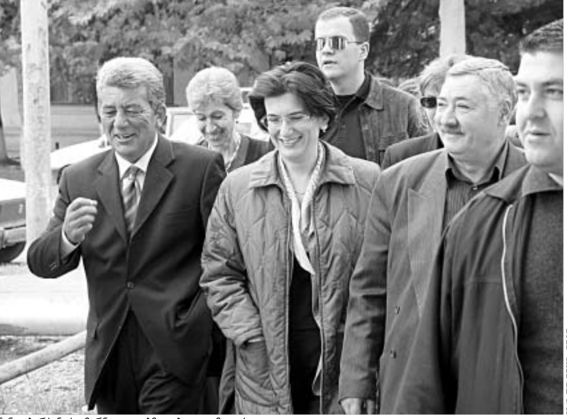
ნინო ბურჯანაძე მარხულაზე მიიღეს

პარლამენტის თავმჯდომარის მიმართ ხელისუფლებასა და უზრალო ადამიანებს რადიკალურად განსხვავებული დამოკიდებულება აქვთ. თუ მმართველი ძალის მხრიდან ნინო ბურჯანაძე ლამის ყოველდღიურად განიცდის შანტაჟსა და შეურაცხველ რიტორიკას, რიგითი მოქალაქეები ბლოკ "მურჯანაძე-დემოკრატების" ლიდერს "სოლიდარობას უტყობენ" და 2 ნოემბრის არჩევნებში მხარდაჭერას პირადებთან. ასე არა მარტო "ოპოზიციურ" და შედარებით "ნეიტრალურ" რეგიონებში, არამედ ქვემო ქართლშიც კი, რომელიც ბოლო დრომდე ხელისუფლების ციტირებად იყო მიჩნეული. გუმბორის მარხულა და დმანისში სტუმრობის დროს, პარლამენტის სპიკერი თავად დარწმუნდა იმაში, რომ ხალხს ის "თავისიანად" მიანჩნია და ხელისუფლებასთან არ იბეჭდებს. ამის დასტურია თუნდაც ის აპოლიტიკური რეგიონები, რომელიც პარლამენტის ხელმძღვანელობა არაერთხელ დაიმსახურა. ეს, ძირითადად, მამინ ხდევნიდა, როდესაც ნინო ბურჯანაძე შევარდნაძის გუნდის უნითობაზე საუბრობდა.