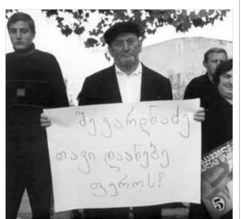
ასე დახვდნენ ზესტაფონში პრეზიდენტს.