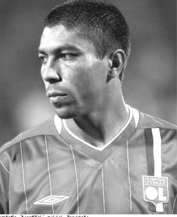
ელბერი "ბაიერნის" დისკას შეეცდება

ჩვენდა სამწუხაროდ, ისევე როგორც მის თანაგუნდელებს, ჯერ გული არ გაუტანია მიხეილ აშვითისა. "არსენალის" მსგავსად, მოსკოვის "ლოკომოტივიც" უფროდ ხვდება "ინტერთან" მატჩს. თუმცა, უკანასკნელ დღეებში მიღებული რიგებში მომხდარი ამბები მოსკოველთა ნისქ-