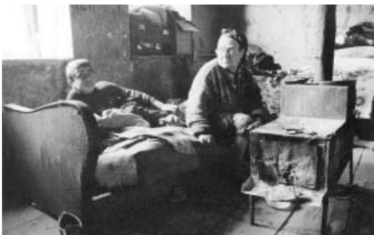
ამბავი, რომელსაც 28 ფერადი ფოტო გვიამბობს. "დილოზზე სა- მუშაოდ სპეციალურად საქარ- თულად ყოველ დღე გადდიდი, რე- ტეგორიას მიაკუთვნებენ. მაგ- რამ, მოვლენებს წინ ნუ გაუვსნ- რებთ....