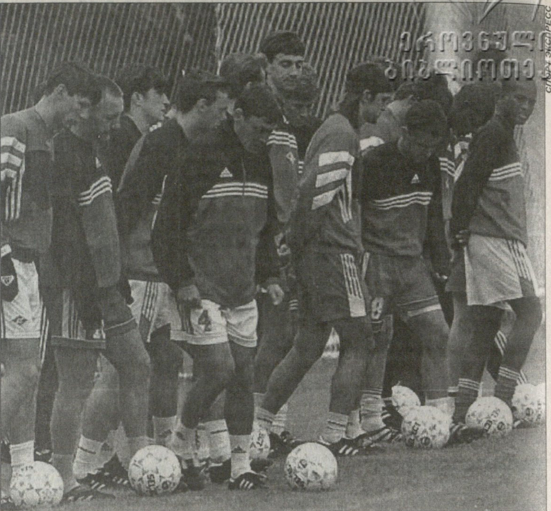
ვიღრე რუსეთის ჩემპიონი „ტარასოვკას“ ბაზაზე ჩემპიონთა ლიგის შეხვედრისთვის ემზადება, „ლოკომოტივი“ მოსკოვის „სპარტაკთან“ ქულათა სხვაობას ამცირებს