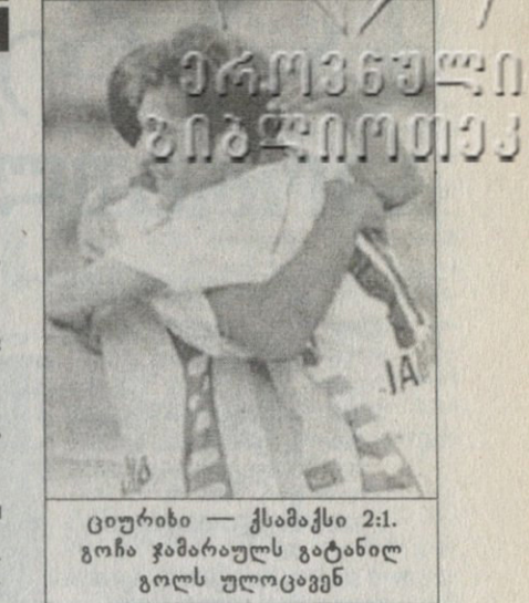
ციურიხი - ქსამაქსი 2:1. გონა ჯამარაულს გატანილ გოლს ულოცავენ