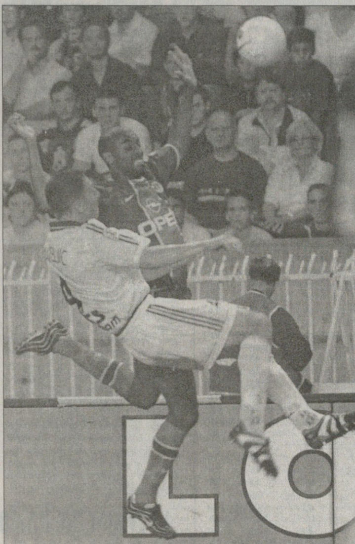
პსჟ - ბორდო 2:1. მეტოქეები ერთმანეთს ჰაერშიც არაფერს უთმობდნენ

VI ტური. რენი 2:1 მონაპო 0:1 გალიარდო (23), 1:1 და კოსტა (25ს.კ.), 2:1 ნონდა (55) პსჟ 2:1 ბორდო 1:0 მადარი (22), 2:0 ოკოჩა (80), 2:1 ვილტორდი (83ა) მონაპოლი 3:1 მარსელი 0:1 დიუგარი (1), 1:1, 2:1 დელვი (54, 62), 3:1 უედევი (64) ლანსი 0:3 სეაანი 0:1 კენი (32ა), 0:2 დებოკი (38), 0:3 მიონე (90) ბასტია 1:1 ნანსი 1:0 ანდრე (75), 1:1 კორეა (85) ტრუა 1:0 ნანტი 1:0 საიფი (53) სენტ ეტიენი 3:3 ლე აპრი 1:0 ალექსი (7), 2:0 გუელი (15ა), 2:1 ბუფე (35), 2:2 დენიო (57), 2:3 ვებერი (63), 3:3 პოტიონი (70) ლიონი 0:0 მსპარი 0:0 სტრასბური