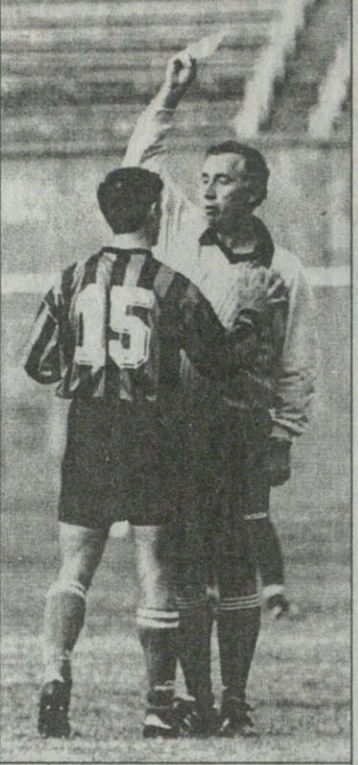
სკანდალი ამით დაიწყო