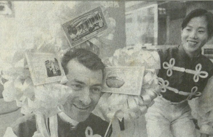
REUTERS ჰონ კონგდან

ათასწილი რამეებში მონაწილეობა უხდებათ ხოლმე პრეზიდენტებს. ბოლინგე რა, იმასაც უნდა დაეხსნო, თუკი განრივი მოითხოვს. ჰოდა, საფრანგეთის პრეზიდენტი ჟაკ შირაკიც სანავსადგურო ქალაქ მარსელს რომ სწევია ორი დღით, ბავშვთა ბოლინგის შეჯიბრის მთავარი დამჯილდოებელი შექნილა. რა სჯობს ბავშვებთან ლაღობას?