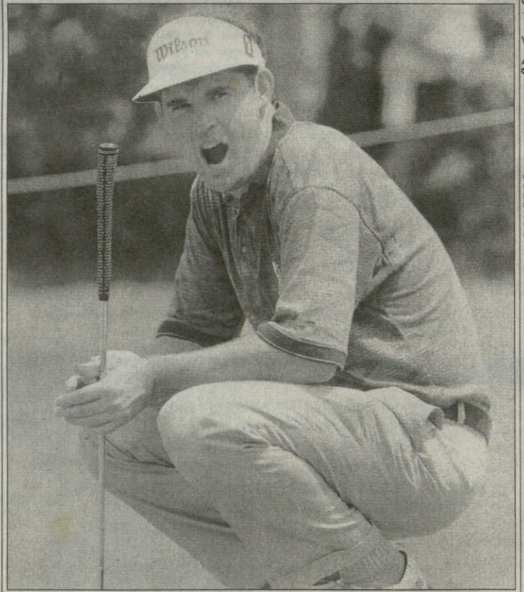
კუალა ლუმპურში

დიდი გულმზიარული კაცია ეს კევი კიგანი. კარგა ხანია, ინგლისის ნაერებს არ ჰყოლია ამგვარი პაიპარა მუნეჯერი, რომელმაც ბიუფე ების (ინგლისის ნაერების საშინაო ბანკის) კარი ფართოდ გაუღო განთქმულ ბრიტებს — აქათდა, ნაერებში ღია და ხალისიანი ვითარება უნდა სუფევდესო. ჩოგბურთელი ტიმ ჰენმანიც ამიტომ მოსულა ბიუფეში. კიგანი მასთან საუბრით ერთობა, ფეხბურთელები კი თავისთვის ვარჯიშობენ. რაც ივარჯიშეს გამოხნდა — სქოთებმა სულ ჯივარი დაუწვეს „უემბლიზე“ და რომ არა მისტერ დევიდ სიმენი... ეპ, ვისაც სქოთები არ შეეცოდა! მაგრამ ინგლისი მაინც ინგლისია და კიგანიც არ არის მთლად ხელწამოსაკრავი.