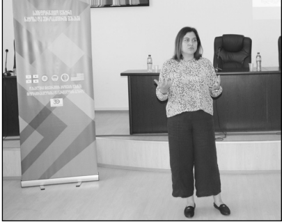
ლანჩუთის მუნიციპალიტეტის საკრებულოს სხდომათა დარბაზში საკრე-

ბულოს და მერიის სავარო მოხელეებისთვის საინფორმაციო შეხვედრა გაიმართა - „საქართველო - ნათეს ურთიერთობები და სამომავლო პერსპექტივები“. შეხვედრას ეროვნული უსაფრთხოების საბჭოს აპარატის თავდაცვის საკითხთა დეპარტამენტის უფროსი მრჩეველი ნათია აფრეტაძე წარუძღვა. შეხვედრას ადგილობრივი ხელისუფლების წარმომადგენლები ესწრებოდნენ. შეხვედრა კითხვა-პასუხის რეჟიმში წარიმართა.