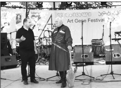
წელია მისი ყოველწლიური, საპატიო სტუმარი და მონაწილეა.

18 ივლისს, თბილისის ეთნოგრაფიულ მუზეუმში გაიმართა ქართული ტრადიციული და თანამედროვე ხელოვნების საერთაშორისო ფესტივალი „არტ-გენი“. ფესტივალის მიზანია ტრადიციული და თანამედროვე კულტურული ფასეულობების პოპულარიზაცია ქვეყანაში და მის ფარგლებს გარეთ.