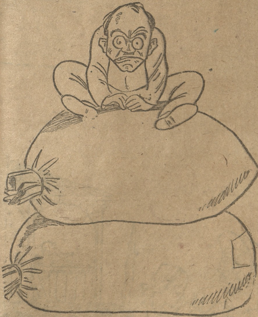
იპორტ:—თუ კი სახელმწიფო ჩვენს კოლმეურნეობას დაეხმარა,—მე რომ ჩემს თავს დავეხმარო დაკოლექტივის ეს ტონარები სახლში წავიღო, ამით რა დაშავდება?!