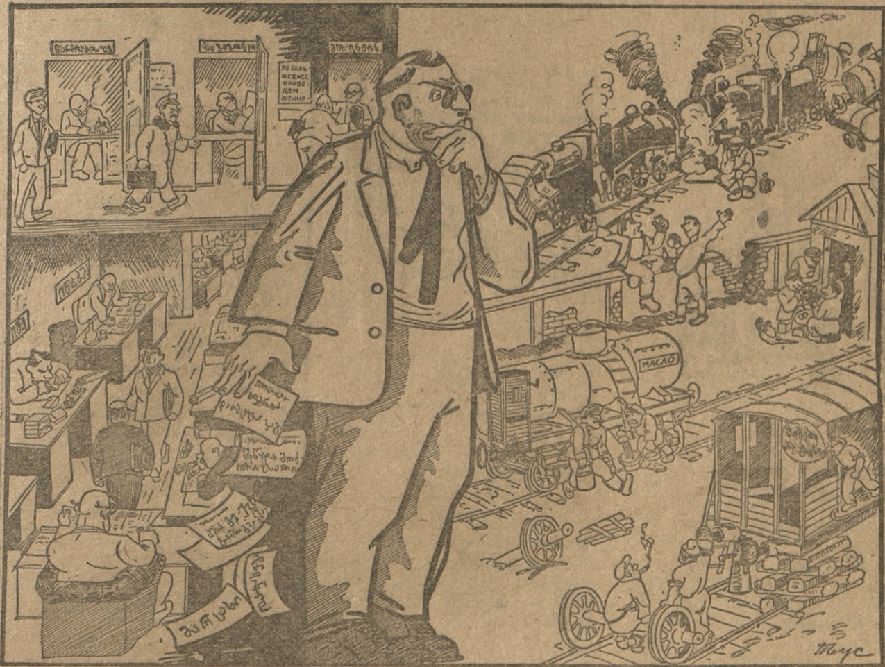
ოპორტ:—საკვირველია! ყველაფე რი რიგზეა, ყველა თავის ალაგასარის, მაგრამ მაინც რომ არ გასვერ ნებენ ცნობებით რკინის გზაზე და-უღვევობის შესახებ?