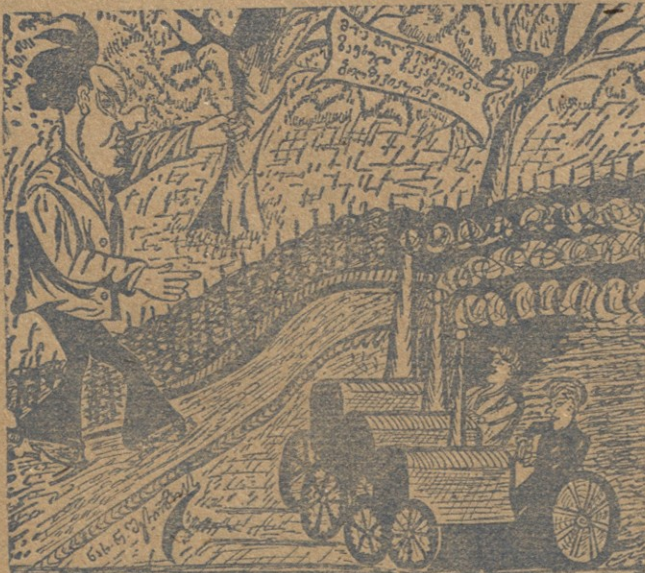
კულაკი: — დასწყევლოს ღმერთმა! თი ოონ ზოლმეცეკები მეჯავრება, და ახლა გა ზაფხულიც გააბოლმეცეკეს!