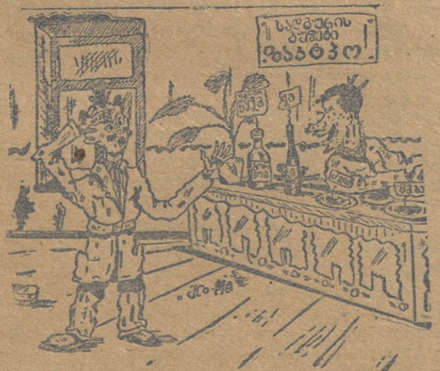
— რატომ ყველაფერს ასე ძვირად ჰყიდი, ეს რომ კოოპერატივია? — ეს „ზაქტაო“ არის, ამხანაგო!