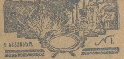
პირველი საბჭოთა იუმორისტული ჟურნალის ყდა.