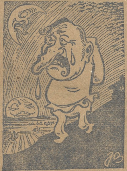
— სიხარულითაგან ვტირი რაღა, სხე გამახარა „ნიანგის“ იუბილეომ!