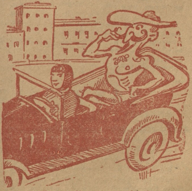
ტფილისში ლევარსი ავტოთი დაბრუნდა. ზმუკი.

— რისი გაქურდვა! ვინ გაბედავდა ჩემს გაქურდ-ვას? სპორტსმენობა დავიწყე; მერწმუნეთ—ჯანმრთე-ლობისთვის ასე სჯობია.