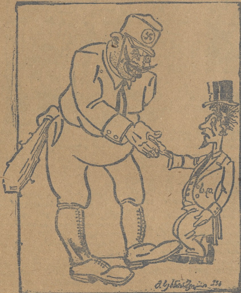
გერმანიის ნაციონალ-სოციალისტი და სოციალ-ფაშისტი კულაკის დიდიკა