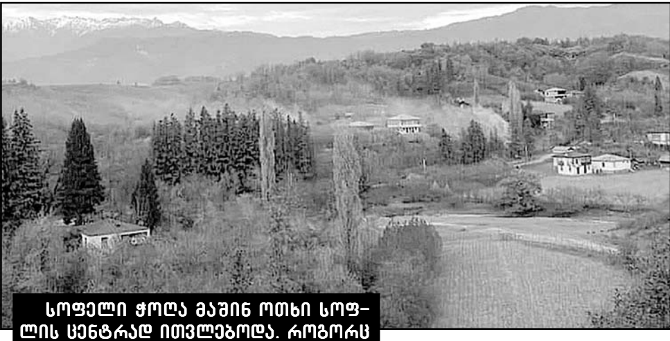
სოფელი ჭოლა გაშინ ოთხი სოფლის ცენტრად ითვლებოდა. როგორც ჩანს, პროტესტის გამოსახატად ქალთა აჯანყება იმდენად აქტიური იყო.