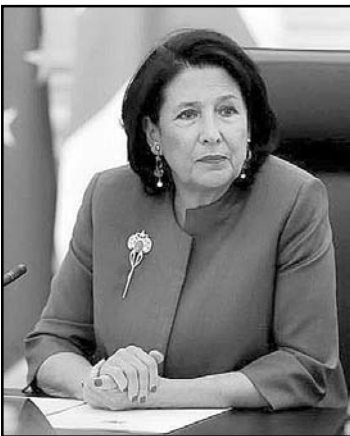
საქართველოს პრეზიდენტი სალომე ზურაბიშვილი „ყირიმის პლატფორმის“ მეორე სამიტში მონაწილეობს, რომელიც უკრაინის პრეზიდენტის ინიციატივით შეიქმნა.

პრეზიდენტის ადმინისტრაციის ინფორმაციით, სამიტი ონლაინ-ფორმატში ჩატარდა და მიზანდასახვად ყირიმის მიმდინარე ოკუპაციაზე საერთაშორისო რეაგირების ეფექტიანობის გაუმჯობესებას, უსაფრთხოების მზარდ საფრთხეებზე რეაგირებას, კრემლზე საერთაშორისო ზეწოლის გაზრდას, ყირიმის დეოკუპაციისა და მისი უკრაინისთვის დაბრუნებას.