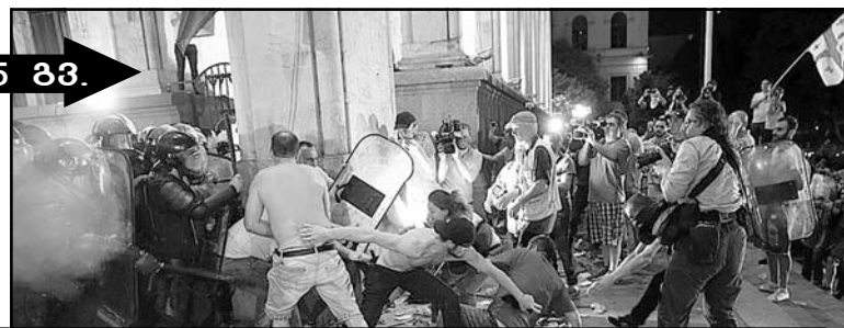
ივ. 4-5 გვ.

როგა ქაიბოლიუმში შეჭრა შეიქმნა დანაშაულია, ხოლო საქართველომ პარლამენტში შეჭრის მხდლობას და პოლიციებზე თავდასხმებს დამოკრებიული პროსების ნაწილად მიიჩნევ, სადაური სამართალია?!