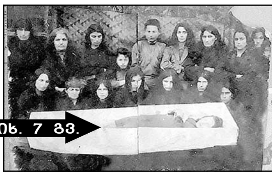
ივ. 7 გვ.

კივილით გაბრტყვებული საბჭოთა ოკუპაცია გებრელ ქალთა აგროსი ჭოლაში