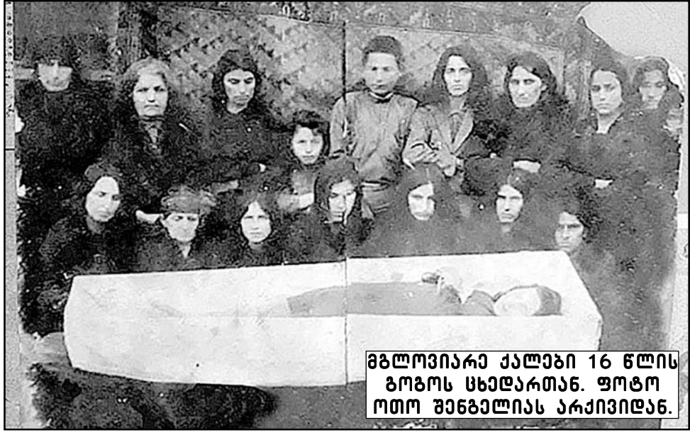
მგლოვიარა ქალები 16 წლის გოგოს სხედატან.