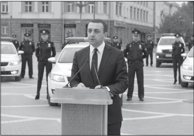
ქვემო ქართლის რეგიონში საპატრულო პოლიციის რეგისტრაციის განხორციელება

23 ოქტომბერს საპატრულო პოლიციის დეპარტამენტის ქვემო ქართლის მთავარ სამმართველოს ახალი საპატრულო მანქანები გადაეცა. რუსთაველი ლონის-ძიებას შს მინისტრი ირაკლი ღარიბაშვილი და საპატრულო პოლიციის დეპარტამენტის ხელმძღვანელები დაესწრნენ. მინისტრის თქმით, საპატრულო პოლიციის რეგისტრაციის პირველი ეტაპი ქვემო ქართლის რეგიონით დასრულდა და ამჟამად, აქტიურად მიმდინარეობს მუშაობა რეგისტრაციის მეორე ეტაპის განხორციელებაზე. ქვეყნის მასშტაბით ჩამოყალიბდება საპატრულო პოლიციის ახალი რეგიონული დანაყოფები, რომლებიც განთავსდება ახალ კომფორტულ და თანამედროვე შენობებში; დაიხვეწება საპატრულო პოლიციის მართვის სისტემა. უახლოეს დღეებში შეიქმნება გურიის რეგიონის საპატრულო პოლიციის მთავარი სამმართველო. მინისტრი თავის სიტყვაში ასევე შეეხო საპრეზიდენტო არჩევნების თემას და ხაზგასმით აღნიშნა, რომ გასული წლის მთავარი მიღწევა თავისუფალი არჩევანის უფლება და თუ ვინმე შეეცდებოდა მის დარღვევას, კანონის სრული სიმკაცრით დაისჯება. მინისტრმა მოახლოებული საპრეზიდენტო არჩევნების მნიშვნელობაზე ისაუბრა და თანამშრომლებს არჩევნებში მონაწილეობისკენ მოუწოდა.