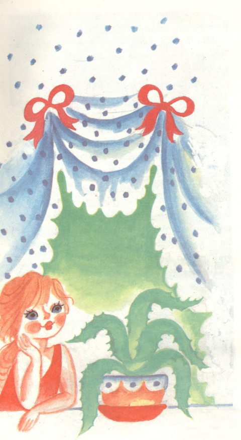
ᲒᲝᲠᲘᲡ Ჟ ᲘᲢᲙᲝᲕᲘ

ერთხელ ნასტიას ქოთნით მცენარე აჩუქეს. გოგონამ შინ მიიტანა და ფანჯრის რაფაზე მიუჩინა ადგილი.