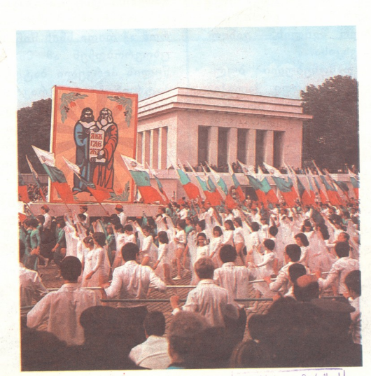
საქ. სსრ კ. მარქსის სახ. სახ. რ.სპუბ.

აქ, ამ ადგილებში, დაიბადა პოეტი-რევოლუციონერი — ხრისტო ბოტევი. 1876 წელს, 28 წლისა, დაიღუპა იგი ბრძოლაში თურქ დამპყრობთა წინააღმდეგ, მაგრამ ცოცხალ ლეგენდად