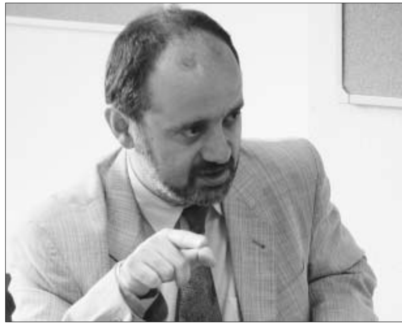
ომბუდსმენი შეგიძლიათ დაუკავშირდეთ შაბათობით. ტელ.: 20 24 24 ან ნებისმიერ დროს ელ-ფოსტით: niadaria@24hours.ge

ასე რომ, იკითხეთ "24 საათი" და არც უშორებოდეს სკოლაგამოვლილი ნუსხურის სპეციალისტები...