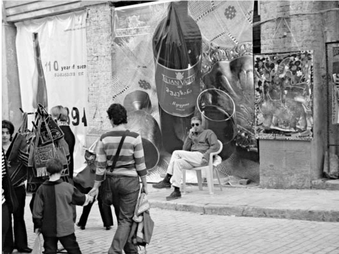
პაპი ბაბუაძის ფოტო

რუსეთის მოსახლეობის 64 პროცენტის დღეისთვის ჯერ კიდევ განიცდის ე.წ. „nostalgia positive“-ს (დადებითი ნოსტალგია) საბჭოთა იმპერიასთან მიმართებაში. რუსეთის მოქალაქეთა დიდი ნაწილი, რომელსაც საბჭოთა კავშირში მოუწია ცხოვრება, სსრკ-ს დაშლის უდიდეს შეცდომად და ტრაგედიად მიიჩნევენ (ერთი შეხედვით ისეთი უმნიშვნელო რამ, როგორცაა საბჭოთა კავშირის შიმშილი, რომელსაც საბჭოთა კავშირმა აღდგენის ფაქტი, ლუბანკის მოედანზე საბჭოთა უშიშროების სამსახურის დამფუძნებლისა და „ნიული ტერორის“ შემოქმედის - ფელიქს ძერჟინსკის ძეგლის ხელახალი დადგმის შესაძლო ფაქტად განხილვა, წითელ მოედანზე ლენინის მავზოლეუმისთვის ხელშეუხებლობის გარანტიების მიცემა ხაზს უსვამს იმას, თუ რაოდენ მნიშვნელობას ანიჭებს საბჭოთა დღეისთვის სიმბოლოებს დღევანდელი რუსეთი და მისი ხელისუფლება). რუსი ხალხის დიდი ნაწილი თვლის, რომ ყველა ყოფილმა საბჭოთა რესპუბლიკამ, რაოდენ დიდი პრობლემების წინაშეც არ უნდა იდგნენ ისინი დღესდღეობით (მაგალითად, ეკონომიკური სტაგნაცია, უმუშევრობა, სეპარატისმის შედეგად გაჩენილი უკონტროლო ტერიტორიები),