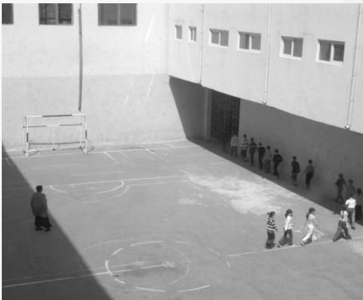
მარკა ამწველამულის ფოტოები