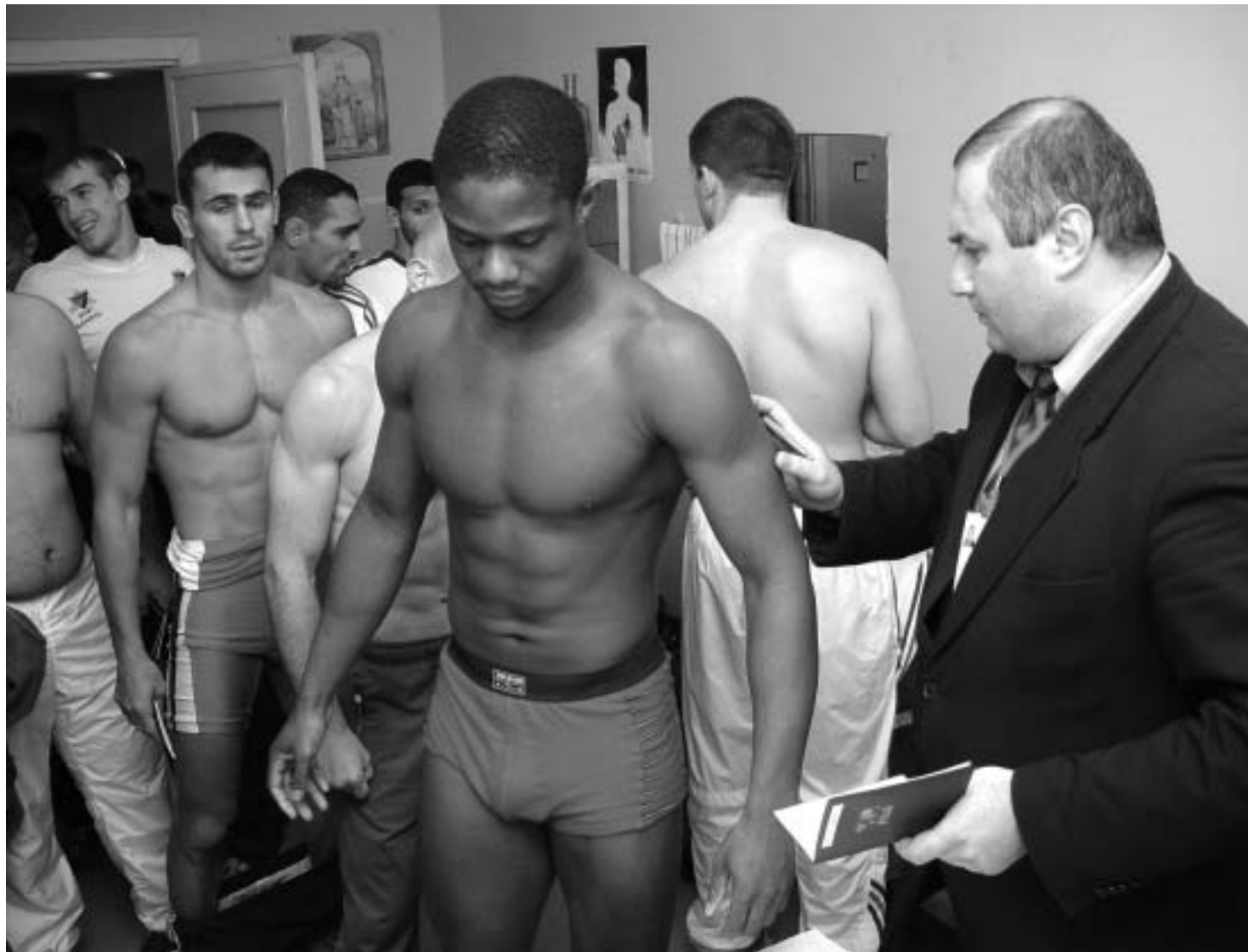
ლევან თედიაშვილის ფოტო

გუშინ ლევან თედიაშვილის სახელობის დიდის სპორტკომპლექსში, მასპინძლებიანად, ტურნირის ხუთივე მონაწილეს მოეყარა თავი. მოჭიდავეებს სამედიცინო კონტროლი უნდა გაეკეთებინათ და ანონილიყვნენ.