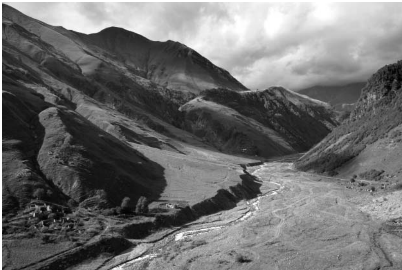
მთის კალთები და ვიწრო ხეობები, რომელიც...