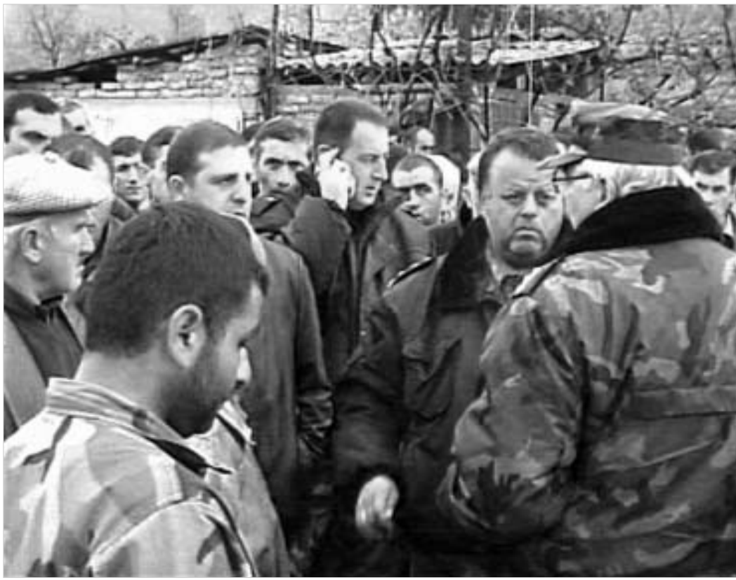
"ქართულ-ოსური კონფლიქტის ზონაში" სიტუაციის გამწვავება მხოლოდ იმის დასტურია, რომ ცხინვალის დე ფაქტო პრეზიდენტს ედუარდ კოკოის კონფლიქტის მშვიდობიანი გზით დარეგულირება არ სურს.