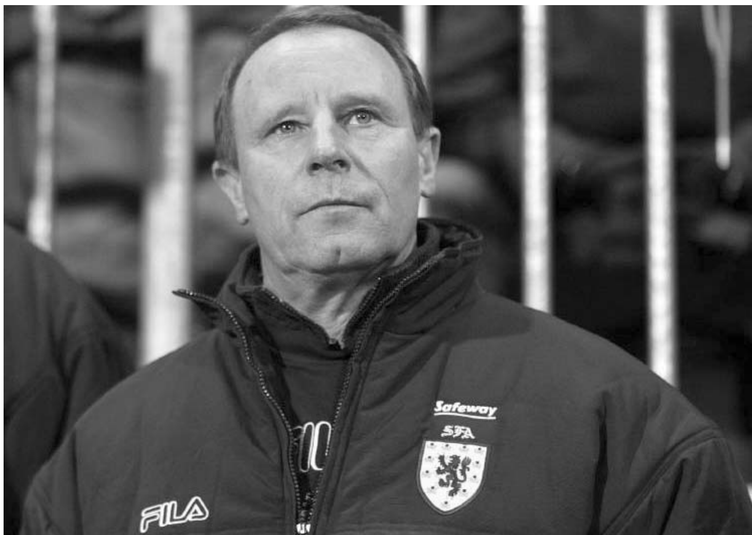
ბერტი ფოტსი: "თანამდებობის დატოვებაზე ჯერ კიდევ 2006 წლის ნოემბერში, შოტლანდიის განვლილი მარცხის შემდეგ ვფიქრობდი".

გერმანიის ნაკრების ყოფილი მწვრთნელი ბერტი ფოტსი ორწელიწადნახევრის წინათ ჩაუდგა სათავეში შოტლანდიის ეროვნულ გუნდს. გასულ ორშაბათს კი დაკავებული თანამდებობიდან გადადგომის შესახებ ვაკეთა განცხადება. შოტლანდიის ნაკრებში მის მოღვაწეობას ნამდვილად ვერ დაეარქმევთ წარმატებულს, თუმცა თავად მწვრთნელი სხვაგვარად ფიქრობს. გერმანული ჟურნალის Kicker-ის რედაქტორთან, პირდი ჰასელბრუხთან საუბარში ფოტსი აღნიშნავს, რომ შოტლანდიელები ჯერაც წარსულით ცხოვრობენ და რომ არაფრით არ უნდათ საკუთარი ფეხბურთის უმწვეობის აღიარება.