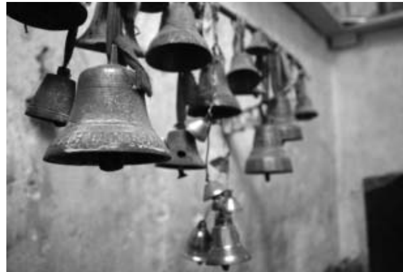
ლომისობაზე ეს ზანზალალები ქვემო მლეთიდან მისი წვერზე ააქეთ