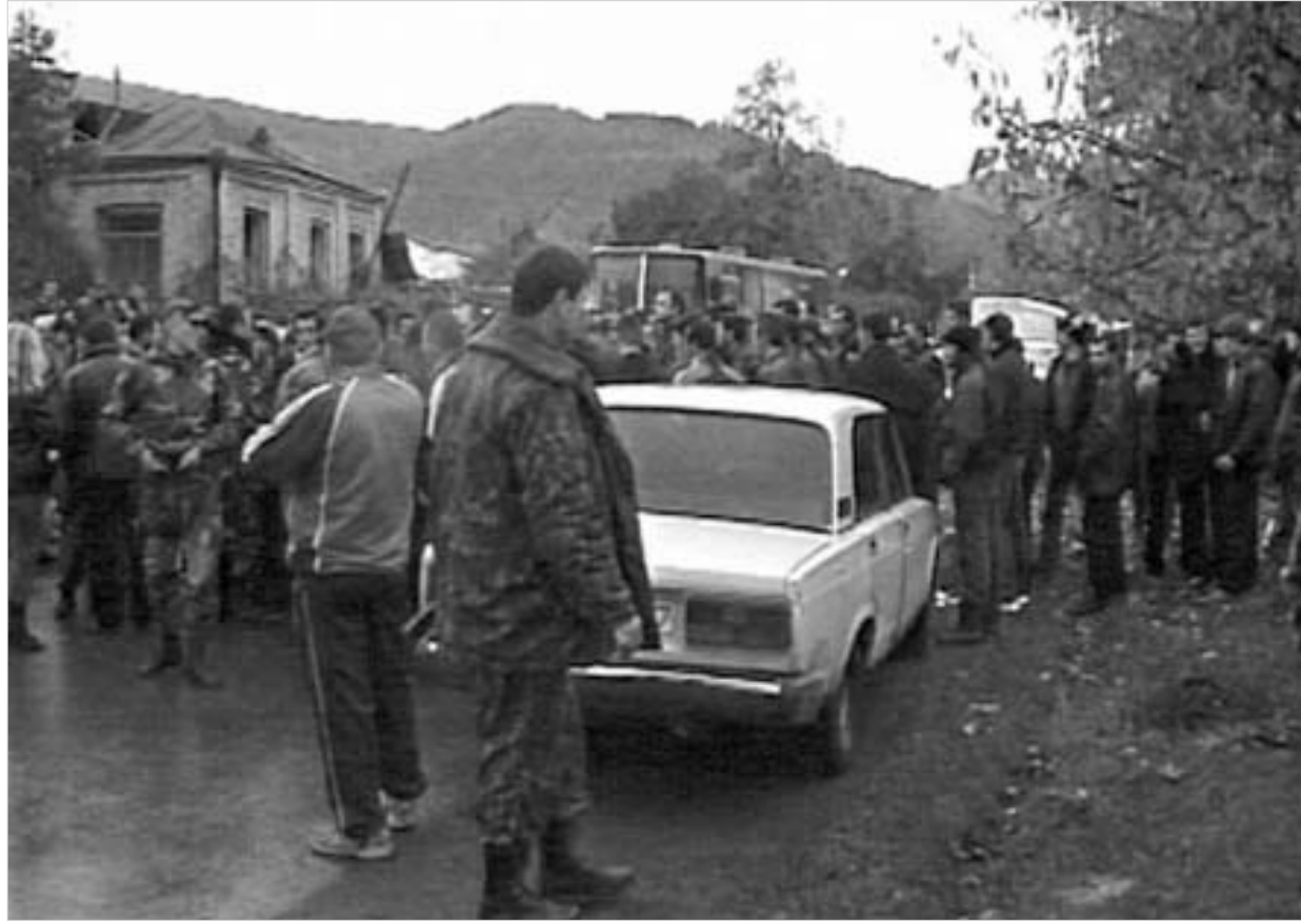
ვიტარება კონფლიქტის ზონაში კვლავ დაძაბულია - გუშინ ცხინვალის ქუჩის გზა ორივე მხრიდან გადაიკეტა.