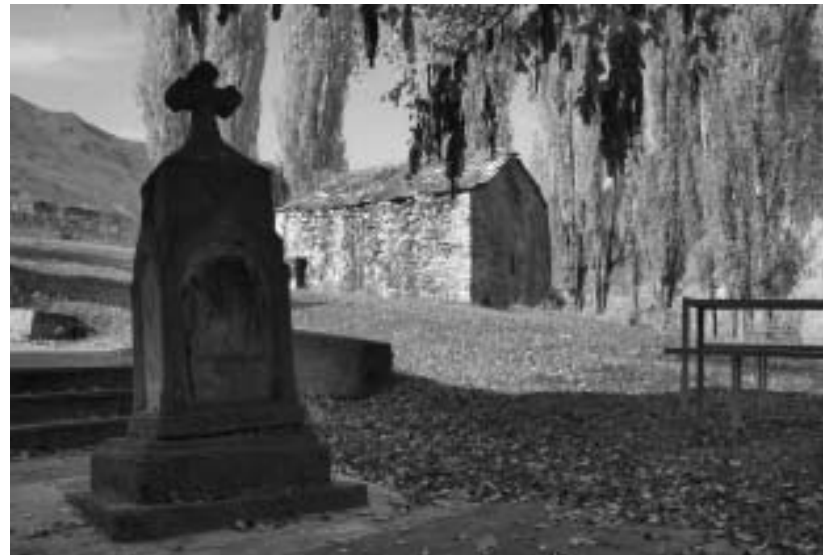
ბურდულების ადგილის დედა

როდესაც საქართველოს ხორას-ნელები შემოსევიან, მათ ტყვედ შეიდი ათასი ქართველი ნაუსხამთ (ხვარასნელები ან ჩვენს მატთანამო ცნობილი ხვარაზმელნი, სულთან ჯალალ ედინის სარდლობით ორჯერ შემოესივნენ საქართველოს: 1226 და 1229 წლებში). ამ ტყვეებს მთიულეთის მთავარი ხატი გზოვანის წმიდა გიორგი თან ნაუსვენებოთ. მას შემდეგ ხორასნელების მინა შევიდნის განამელობაში ნაყოფს აღარ იძლეოდა. ადამიანიცა და საქონელიც გაბეზრებულა. ამ მიზეზის გასაგებად თავზარდაცემულ სულთანს მკითხავენი მიუხმია, რომელთაღ ხორასნელებით, რომ უბედურების მიზეზი გურჯისტინის ხატიაო. სულთანს ბრძანება გაუცია, ხატი ანთებულ საკირეში ჩაეკედოთ. ოღნავ შეტრუსული ხატი საკირიდან ამოვარდნადა და იქვე მოგვლენილი თეთრი ხარის რქაზე დაბრძანებულა. მაგრამ არც ხარი და არც ხატი ადგილიდან არ დაძრულან, ვი-