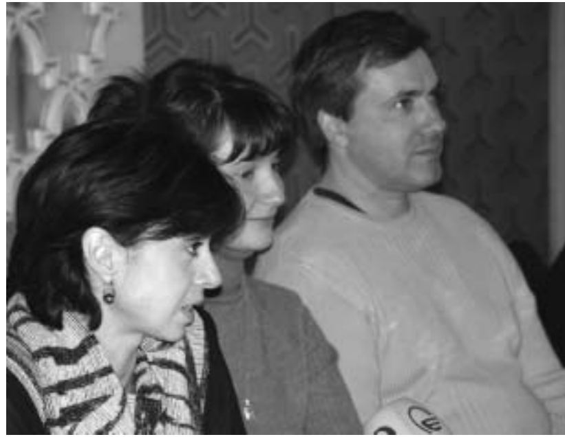
ანანიაშვილი, რასტორგუევა და ფადეიჩევი

დღეს ოპერისა და ბალეტის თეატრში სამი ერთმოქმედიანი თანამედროვე ბალეტის პრემიერა გაიმართება. პირველი მათგანი "წამი გარდასახვამდე" ამერიკელი ქორეოგრაფის - რეი მაკენტაიერის დადგმაა, მუსიკა აფრიკული ფოლკლორის თემზეა, მეორე სპექტაკლი, - რომანტიული ბალეტი GREEN - ავსტრალიელმა ქორეოგრაფმა სტენტონ ველშმა თავის დროზე სპეციალურად ნინო ანანიაშვილისთვის დადგა. ანტონიო ვივალდის არაჩვეულებრივ სავიოლინო კონცერტს ჩვენი თეატრის ორკესტრი შესრულებს, რომელსაც თამაზ ჯაფარიძე უღიროფრებს. მე-სამე დადგმა თბილისელი ბალეტის მოყვარულთათვის კარგადაა ცნობილი. ეს არის "სიზმრები იაპონიაზე",