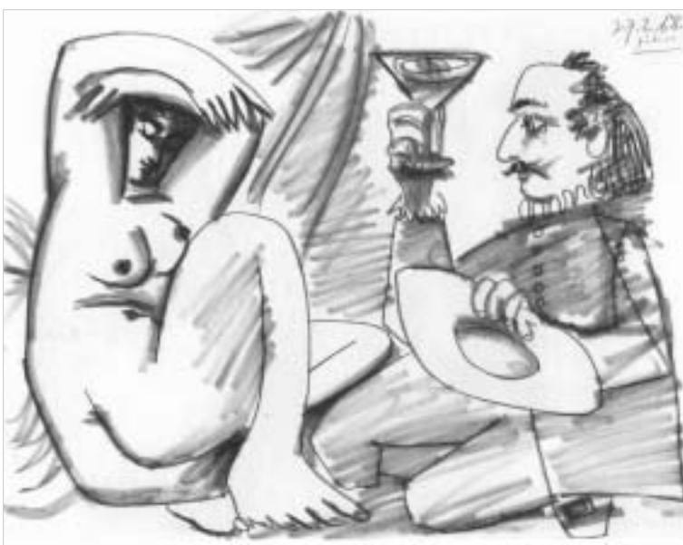
პიკასო. მუშეტიერი მიშელ ქლთან.

სუთმბატის ნიუ იორკში გამართული "სოტის" აუქციონი თავიდან კვირის მოვლენად შეიქცა, თუმცა მალევე დააბრუნეს, რომ იმდენივე დედა ვაჭრობა გაცილებით უფრო გრძელდება ვიდრე იყო. ეს იმიტომ, რომ იმპრესიონისტების და მოდერნისტული მხატვრობის აუქციონის მსგავსი გაყიდვის მანქანებით 1990 წლის შემდეგ არ დასრულებულა.