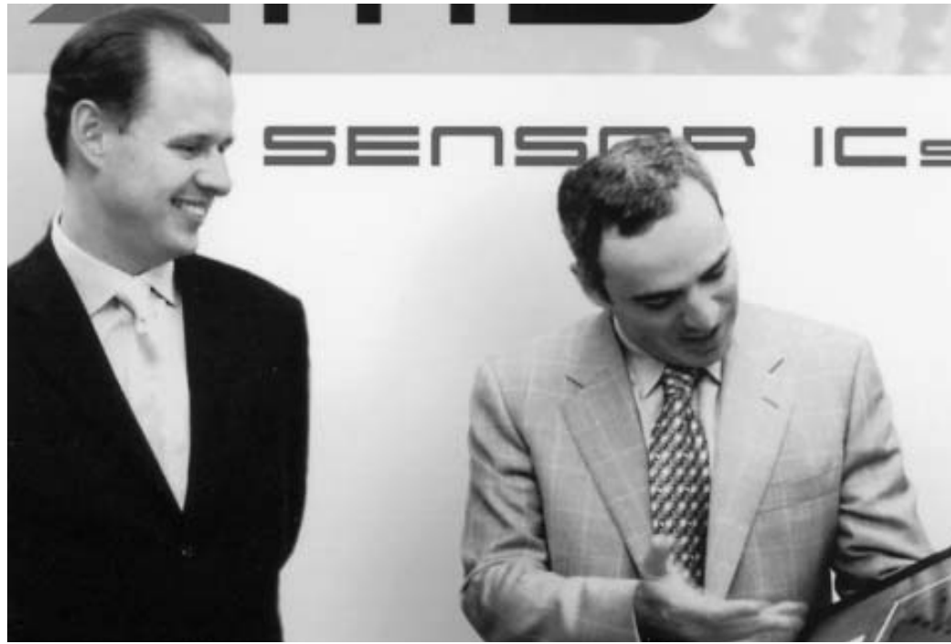
გარი კასპაროვი შეიძლება რუსტამ კასიმჯანოვს აღარ შეხვედეს.

ამავე დროს ფიდეტს ატარებდა მსოფლიო ჩემპიონატებს ნოკაუტის სისტემით. ეს კი არც ისე მართებული იყო. მართლაც, ტურნირში არ მონაწილეობდნენ მსოფლიოს უძლიერესი მოჭადრაკეები გარი კასპაროვი, ვლადიმერ კრამნიკი და სხვა დიდოსტატები. თანაც, ტურნირის ჩატარების სისტემა მეტისმეტად ბუნდოვანი იყო. არ არსებობდა არავითარი დროის კლასიკური კონტროლის მექანიზმი. ჩემპიონი კი "სწრაფ პარტიებში" და ხანგამოშვებით ბლიცებში