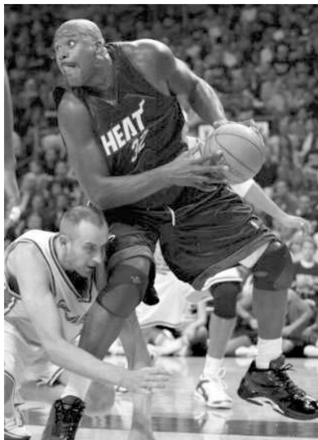
შაკილ ონილს იმჟამინათვე ვერაფერი მოუხერხა.

მეორე შეხვედრა შარლოტში, "შარლოტ კოლინჯეუმში", "შარლოტ ბობქეთის" საშინაო მოედანზე გაიმართა. ერთმანეთის წინააღმდეგ თამაშობდნენ "შარლოტ ბობქეთის" და "ვაშინგტონ უიზარდსი". ეს მატჩი შარლოტელისთვის სადებიუტო იყო, მაგრამ, მათთვის საშინაობა, დებიუტი წარუმატებელი გამოუვიდათ. საექე ის არის, რომ ვაშინგტონელმა ჯადოქრებმა უკანასკნელი წლების ერთ-ერთი