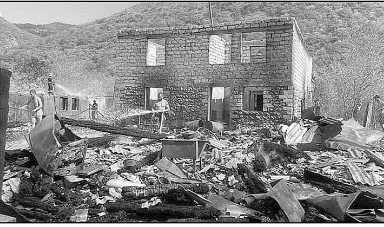
სამხრეთში პროკურატურამ, ქარელის რაიონში ცეცხლის წაკიდებით საცხოვრებელი სახლების, სათავსოების, ხეილის ბაღების დაზიანების და განადგურების ფაქტზე, ერთ პირს ბრალდება წარუდგინა.

სამხრეთში პროკურატურამ, ქარელის რაიონში ცეცხლის წაკიდებით საცხოვრებელი სახლების, სათავსოების, ხეილის ბაღების დაზიანების და განადგურების ფაქტზე, ერთ პირს ბრალდება წარუდგინა. ბრალდების მხარის შუამდგომლობის საფუძველზე ბრალდებულს აღკვეთის ღონისძიების სახით პატიმრობა შეეფარდა, ამის შესახებ ინფორმაციას საქართველოს პროკურატურა ავრცელებს. მათივე ინფორმაციით, შინაგან საქმეთა სამინისტროს მიერ ჩატარებული გამოძიებით დადგინდა, რომ 28 აგვისტოს, ქარელის რაიონის სოფელ ელბაქიანთკარში, მთვრალ მდგომარეობაში მყოფმა ბრალდებულმა ნარჩენების განადგურების მიზნით, საკუთარი საცხოვრებელი სახლის ეზოში ცეცხლი დაანთო. მიუხედავად იმისა, რომ თანასოფლელებმა ხანძრის გაჩენის გამო მოსალოდნელ მძიმე შედეგებზე გააფრთხილეს და ცეცხლის ჩაქრობა სთხოვეს, ცეცხლი არ ჩააქრო და დასახმარებლად მისული მეზობლები სახლიდან გაყარა. ცეცხლი ფართო ტერიტორიაზე გავრცელდა, რის შედეგადაც დაინვა სოფელ ელბაქიანთკარში მდებარე 300 000 ლარის ღირებულების ექვსი სახლი, დამხმარე სათავსოები და ხეილის ბაღები. სამართალდამცველებმა ბრალდებული იმავე დღეს დააკავეს. მას ბრალდება საქართველოს სისხლის სამართლის კოდექსის 187-ე მუხლის მე-2 ნაწილის „ა“ ქვეპუნქტით და მე-3 ნაწილებით (სხვისი ნივთის დაზიანება, განადგურება, ცეცხლის წაკიდებით, რამაც მძიმე შედეგი გამოიწვია) წარედგინა, რაც სასჯელის სახედ და ზომად ექვსიდან ათ წლამდე თავისუფლების აღკვეთას ითვალისწინებს.