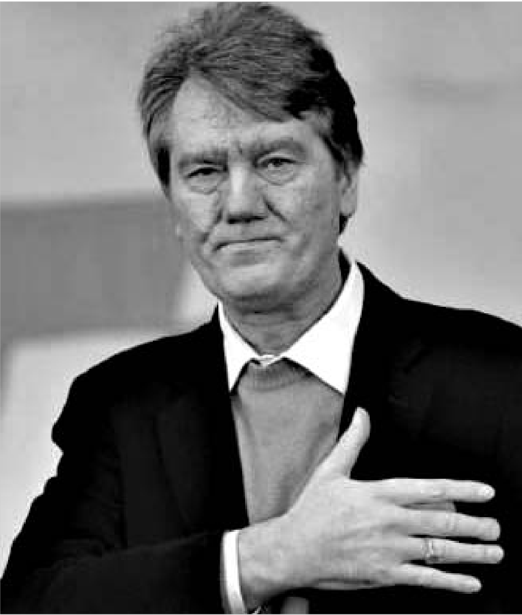
“ნარინჯისფერთა” ლიდერმა ვიქტორ იუშენკომ კიდევ ერთი ნაბიჯი გადადგა პრეზიდენტობისკენ

უკრაინის ცენტრალურმა საარჩევნო კომისიამ, როგორც იქნა დაასრულა საარჩევნო ოლქებიდან მიღებული ოქმების შეჯამება და კანონით დადგენილი ვადის ვასვლამდე რამდენიმე საათით ადრე, 31 ოქტომბერს ჩატარებული არჩევნების საბოლოო შედეგები გამოაცხადა. მართალია, ოპოზიციის ლიდერმა ვიქტორ იუშენკომ პირველ ტურში გაიმარჯვა, მაგრამ, როგორც მოსალოდნელი იყო, უკრაინის მომავალი პრეზიდენტის ვინაობის გასარკვევად მეორე ტურის ჩატარება ვახდება აუცილებელი. მხარეებმა აღიარეს ცესკო-ს მონაცემები და ახლა 21 ნოემბრისთვის ემზადებიან.