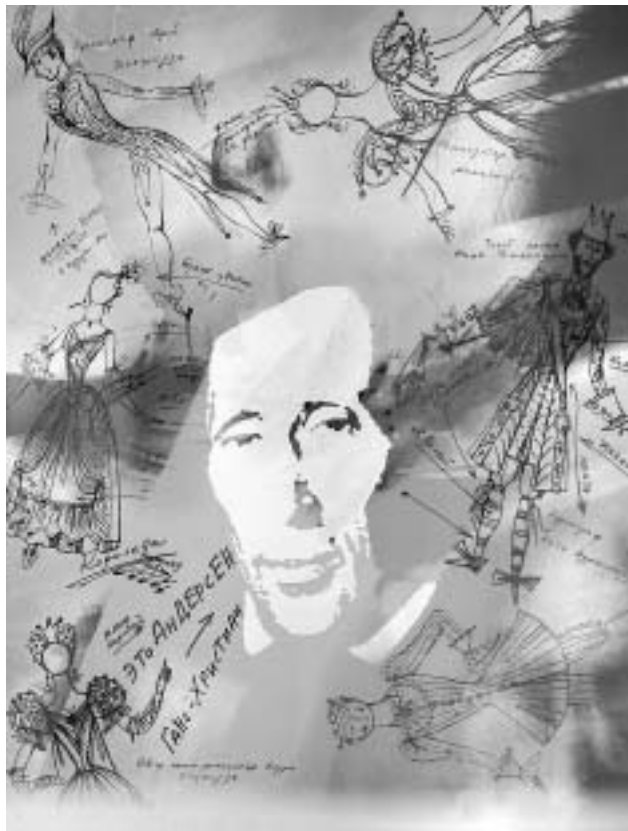
ანდერსენის საიუბილეოდ დაგეგმილი სპექტაკლის პლაკატი.

... ყმაწვილობისას ანდერსენი სიამოვნებით კერავდა ტანსაცმელს თავისი თოჯინების თეატრისთვის. ამის შემყურე დედა, შვილის ქალაქის პირველ თერაპიულ-დეგნდა, მაგრამ პატარა დანიური ქალაქის - ოდენსეს მენალის ვაჟი არ დაემორჩილა რჩევა-დარიგებებს და თავად შეეცადა საკუთარი ბედის წარმართვას. ჰუმანისტი და ფილოსოფოსი ჰანს ქრისტიანი იშვიათი პოეტური ნიჭითაც იყო დაჯილდოებული. მან შექმნა 150-ზე მეტი ზღაპარი. მისი წიგნები 32 ენაზეა გამოცემული. მაღალ შეფასებას აძლევდა ან-