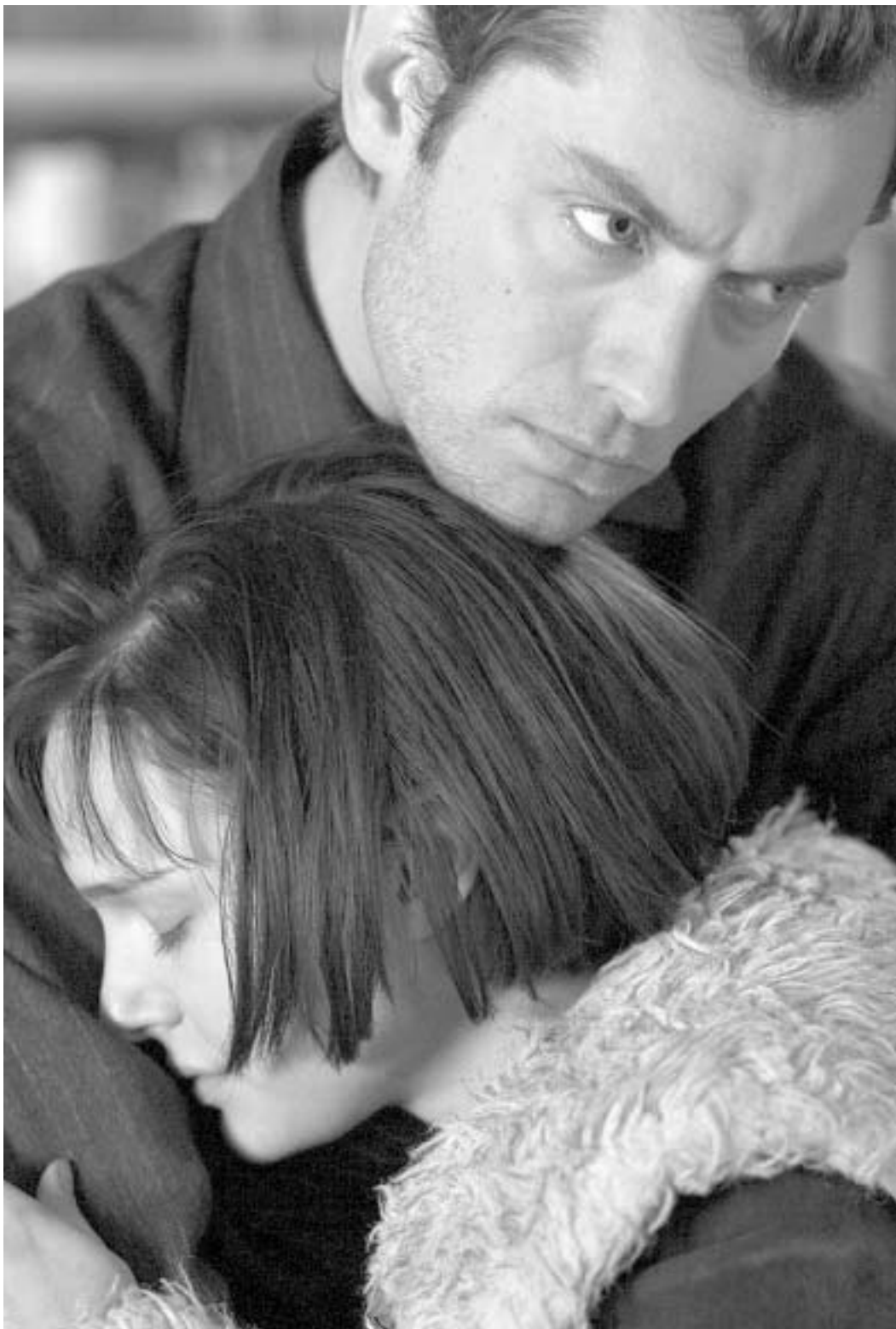
ნატალი პორტმანი პირველ "ზრდასრულ" როლში. დეკემბრის ყველაზე საინტერესო კომედიაში მას პარტნიორობას ქუდ ლოუ და პულია რობერტი უწევენ.

თუმცა, შეიძლება ეს ცუდი სულაც არ არის. შეიძლება, რეჟისორის ჩანაწერიც ასეთია - შექმნას გოგონას სახე, რომელიც ეგზოტიკურ ცეკვებს მხოლოდ იმიტომ ცეკვავს, რომ უზარმაზარ ღონდონში