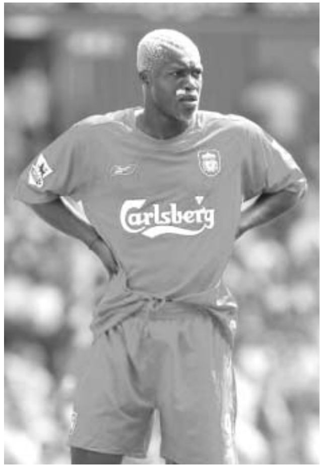
"ლივერპულში" სისეს სადებიუტო სეზონი უკვე დასრულდა.

"ხშირად გამოგონია, რომ ჩვენ ცალმხრივი ფორვარდები ვართ, მაგრამ, მეჩვენებთ, ასე არ არის, - ამტკიცებს სისე, - ჩვენ კარგ ფეხბურთელებად ვჩვენებთ და ამან შედეგი უნდა გამოიღოს". ახალ კლუბში, სადაც სისე ფერარ ულიეს წასვლის წინ მივიდა (ადრე მასთან ფეხბურთელი ორი წლის განმავლობაში თამაშობდა), მას მოუხდა, თავისი რეპუტაცია რაფაელ ბენიტესისთვის დაემტკიცებინა.