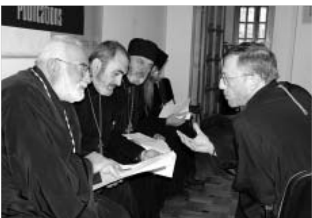
მარცხნივ: აკადემიის ხელმძღვანელი, მარჯვნივ: სტუდენტები

8 ნოემბერს “24 საათში” გამოქვეყნდა სასულიერო სემინარიისა და აკადემიის სტუდენტთა წარუბრები, სადაც ისინი საქართველოს საპატრიარქოში არსებულ პრობლემებზე ლიად საუბრობენ. წერილის ხელს 23 სტუდენტი აწერს. ისინი ამბობენ, რომ მათ დამოკიდებულებას სტუდენტებისა და პედაგოგების, აგრეთვე, მათთვის ცნობილი სასულიერო პირების უმრავლესობა იზიარებს. თუმცა, სხვადასხვა მიზეზით ისინი დღეობს არჩევენ. “ჩვეტც დიდხანს ვდუმდით, - წერენ ისინი, - მაგრამ, ჩვენი აზრით, წლების მანძილზე წაყრუებისა და დუმების პოლიტიკამ გერანაირად გაამართლა და ამ წერილზე ხელმოწერის პირად პასუხისმგებლობას ვგრძნობთ ეკლესიაში დღესდღეობით არსებული კრიზისის გამო.”