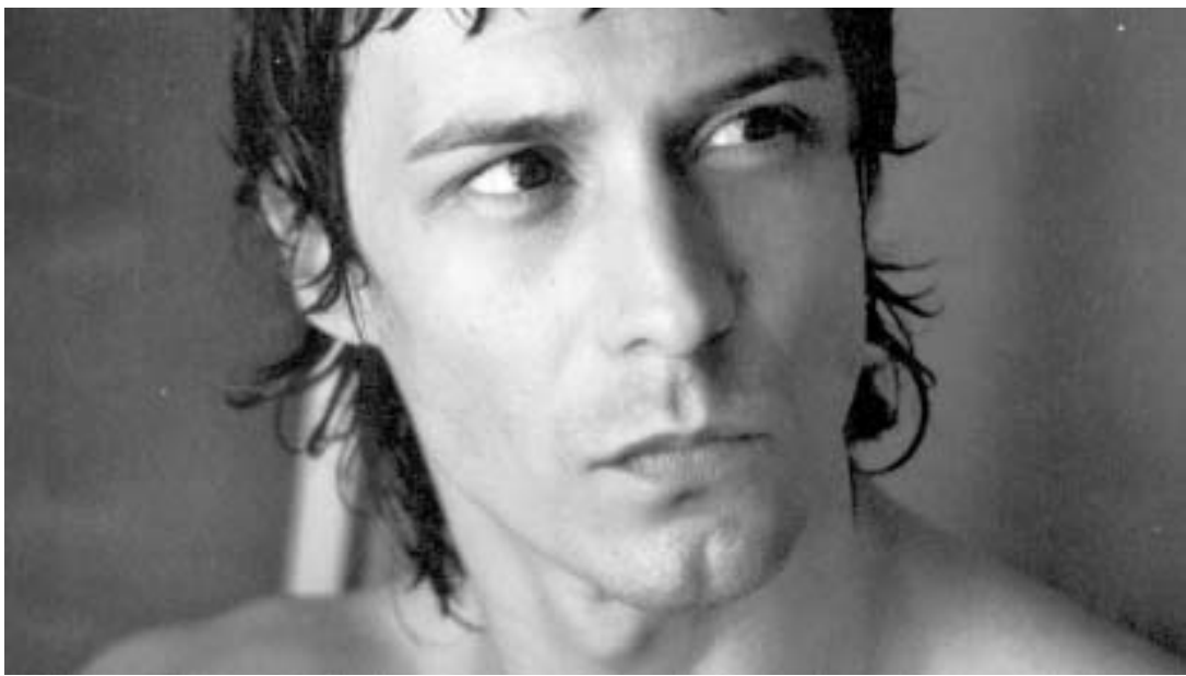
ალმოდოვარის "ცუდი ალზრდა".

გამოცხადდა 2004 წლის ევროპის კინოაკადემიის ჯილდოს ნომინანტთა სია. ჯილდოს ძირითადი პრეტენდენტები არიან: ალმადოვარის "ცუდი ალზრდა" და მაიკლის "ვერა დრეიკის საიდუმლო". სხვადასხვა ნომინანტში კი დასახელებულია: ფატიპ აკინის Head-On და ალექსანდრო ამენაბარის The Sea Inside.