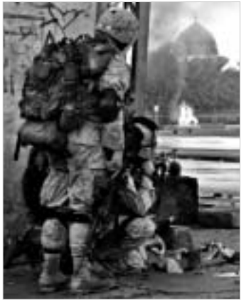
ამერიკელი თქმით, ქალაქის პრაქტიკულად ყველა რაიონი მათი კონტროლის ქვეშ იმყოფება.

„აღ-ფაღაჯა დაქვა“ - აფხაზეთში აშერიკელები