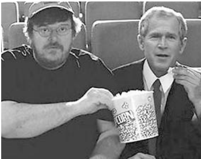
მური და ბუში პოპკორნით ერთობიან კინოში.

"ამერიკელთა 51 პროცენტი წინასწარჩვენო კამპანიების დროს ინფორმაციის ნაკლებობას განიცდის და სიმაართეს მათ არავენ ეუბნება. ჩვენ გვსურს, რომ ამის შესახებ საზოგადოებას ამომწურავი მას-