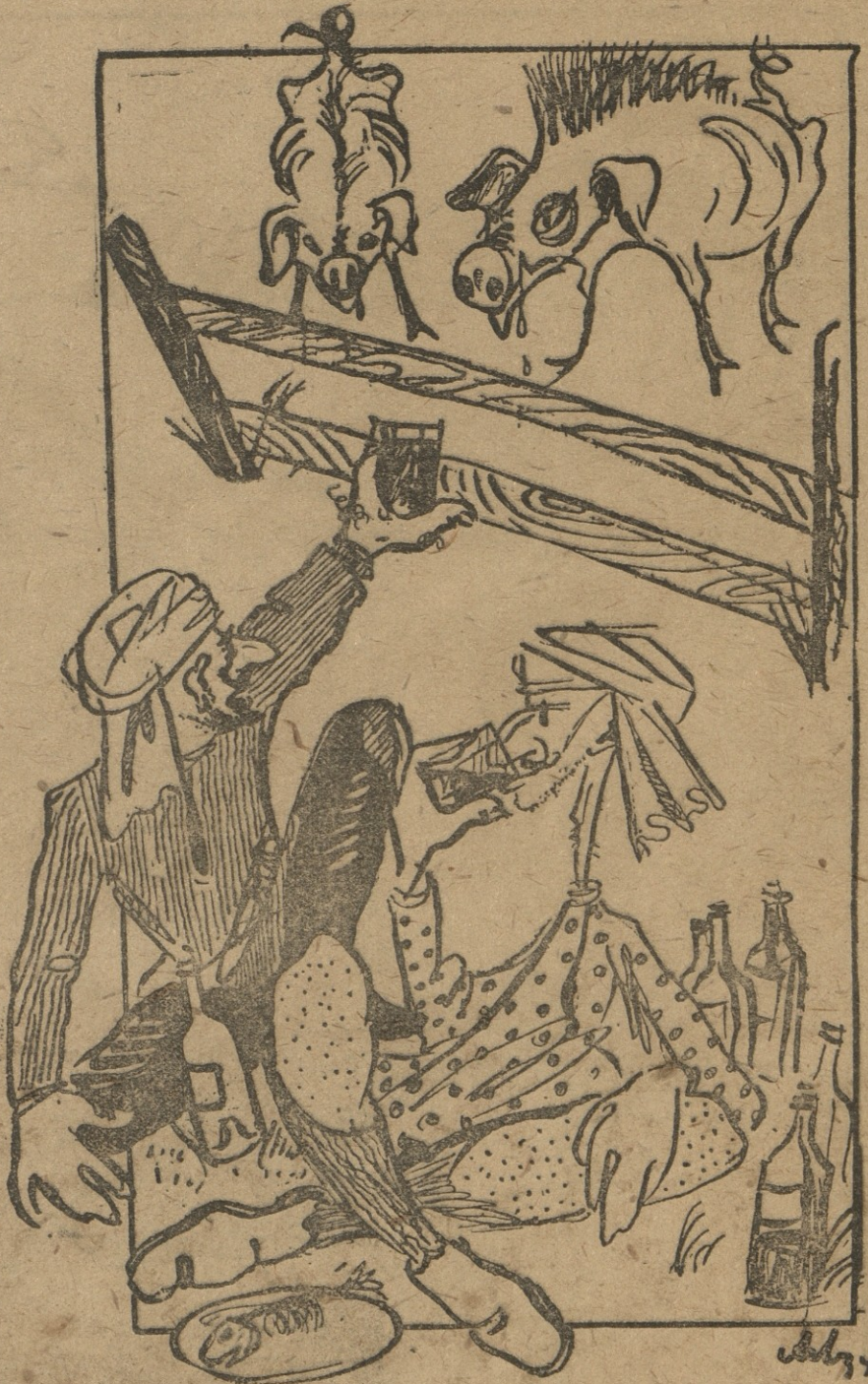
— გაგიმარჯოს ღოუტუნიაჲ! რასდაღონებულხარ, ხომ უყურებ არ გივიწყებთ და შენს სადღეგრძელოს ვსვამთ.

ძვ. სენაკის საბჭ. მულრნობაში ღო- რებს 15 დღის განმავლობაში არქო- ნებით ნოყიერი საკვები.