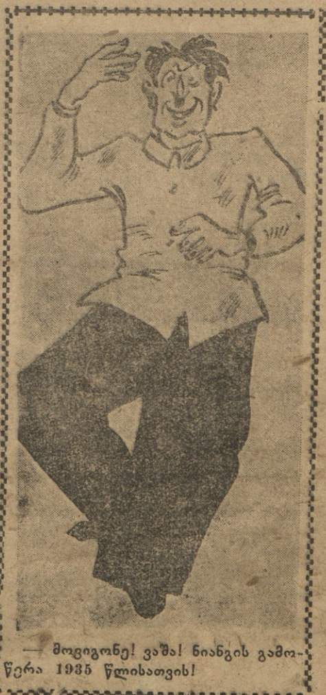
— მოვიგონე! ვაშა! ნიანგის გამოწერა 1935 წლისათვის!

გჭირია კიდევ ერთი! — (ისემაც შეეწიოს საშას ყოფილი ღმერთი).