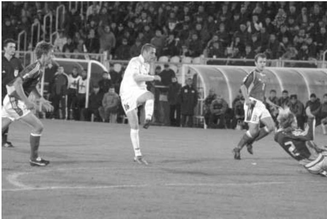
მრჩობა აპაჩიას ფოტოში

ეროვნული ნაკრების ძალა და ყველაზე, გულში თუ საჯაროდ, დიდი მადლობა გადაუხადა ასეთი კარგი