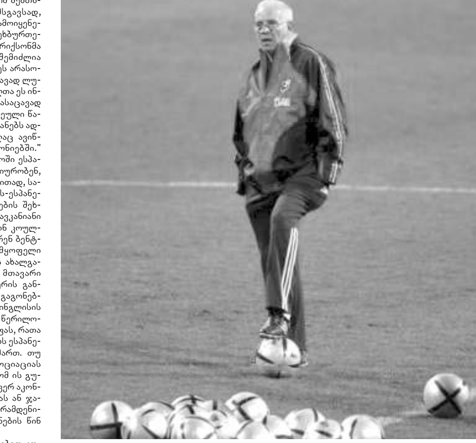
ლუის არაგონესი ესპანელ ფეხბურთელს ცუდ მაგალითს აძლევს

ამ კამპანიის მიზანია რასიზმის ნებისმიერი გამოვლენაზეც კი, როგორც ეს ლუის არაგონესის შემთხვევაში მოხდა, სამუდამოდ აღმოფხვრას მსოფლიო ფეხბურთის სამყაროდან, განაცხადა ბრიტანეთის ანტირასიზმული ჯგუფის წარმომადგენელმა ლიონ მანმა.