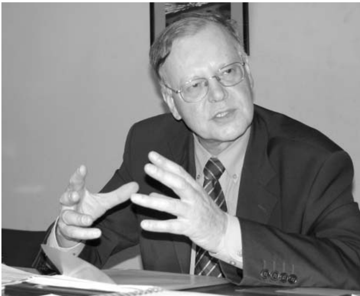
"საქართველო არ არის მესამე მსოფლიოს ქვეყანა. აქ ძალიან გონებაგახსნილი და ნიჭიერი ხალხი ცხოვრობს, თითოეული ადამიანი ინდივიდია. პიროვნება."