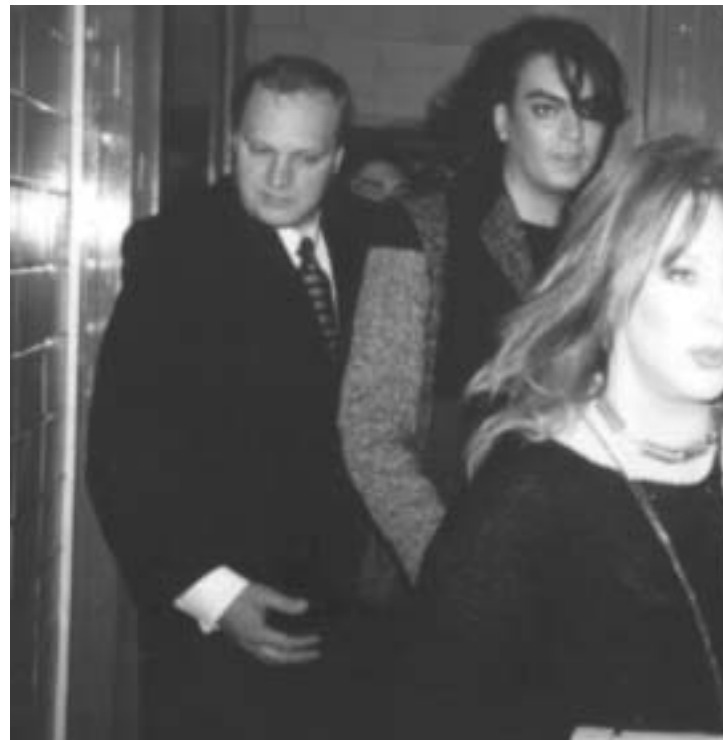
იგორ პოლნიკოვი ფილმი კორკოვი და ალა პუგაჩოვა

ინფორმაცია პუგაჩოვას წასვლის შესახებ მომღერლის პრესსამსახურმაც დაადასტურა, ვარსკვლავის სამომავლო გეგმების შესახებ კი კატეგორიულად არ საუბრობენ. თუმცა, არავისთვის საიდუმლო არ არის, რომ 55 წლის პრინადა, რომელსაც ჯერჯერობით ვერაინც შეაყვინოებს, არც ფიზიკურად და არც ვოკალის მხრივ ფორმაში აღარ არის. იგი სულ უფრო ხშირად დალილი გამოიყურება. კანტიკულტად გამაოგნელ