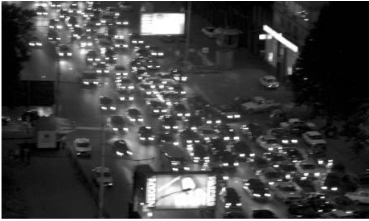
ქალაქის ზოგიერთ უბანში, მიუხედავად იმისა, დღეა თუ ღამე, ტრანსპორტის მოძრაობა ჭირს.

ნელობა იმედოვნებს, რომ ექსპერიმენტი გაამართლებს. თუ მერიას შეუძლია ქუჩები დახაზოს, "პარკინგი" განსაზღვროს, "მარშრუტკების" რაოდენობა შეამციროს, ორმოცი ამოავსოს (სხვათა შორის, ეს ღონისძიებები გაცილებით ნაკლებად ხარჯიანია) ან გაკეთოს რამიმე ისეთი, რაც ნორმალურ მოძრაობას შეუწყობს ხელს, მაშინ რა საჭირო იყო ეს მოუხერხებელი და უაზრო