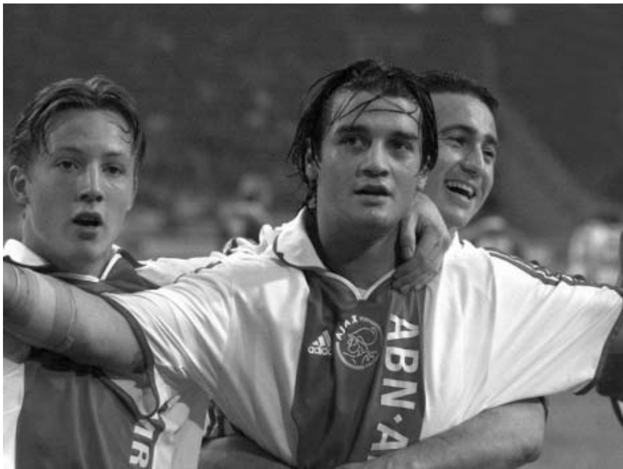
ამსტერდამის "აიასი" ევროთასებზე საიუბილეო 250-ე შეხვედრას ტურინში "იუვენტუსის" წინააღმდეგ გამართავს.

B ჯგუფში უაღრესად საინტერესო ვითარება შეიქმნა. "რეალს", "ლევერკუზენს" და კიევის "დინამოს" ქულების ერთნაირი რაოდენობა (7-7) და, აქედან გამომდინარე, შემდეგ ეტაპზე გასვლის ერთნაირი შანსი აქვთ. იტალიური "რომას" კი მხოლოდ ერთი ქულა აქვს და უფეა-ს თასის საგზურის მოპოვების მანსიც კი მიუწვდომელია მისთვის. მადრიდის "რეალი" დღეს ლევერკუზენის "ბაიერს" უმასპინძლებს და, ცხადია, ამ გუნდთან პირველ შეხვედრაში განცდილი მარცხისთვის (0:3) შურისძიებას შეეცდება. გარდა ამისა, სამეფო კლუბი ესპანეთის ჩემპიონატის უკანასკნელ ტურში ბარსელონაში დამარცხდა და საკუთარი გულშემოტყვიერის წინაშე რეაბილიტაცია მართებს. ბურთების უკეთესი შეფარდე-