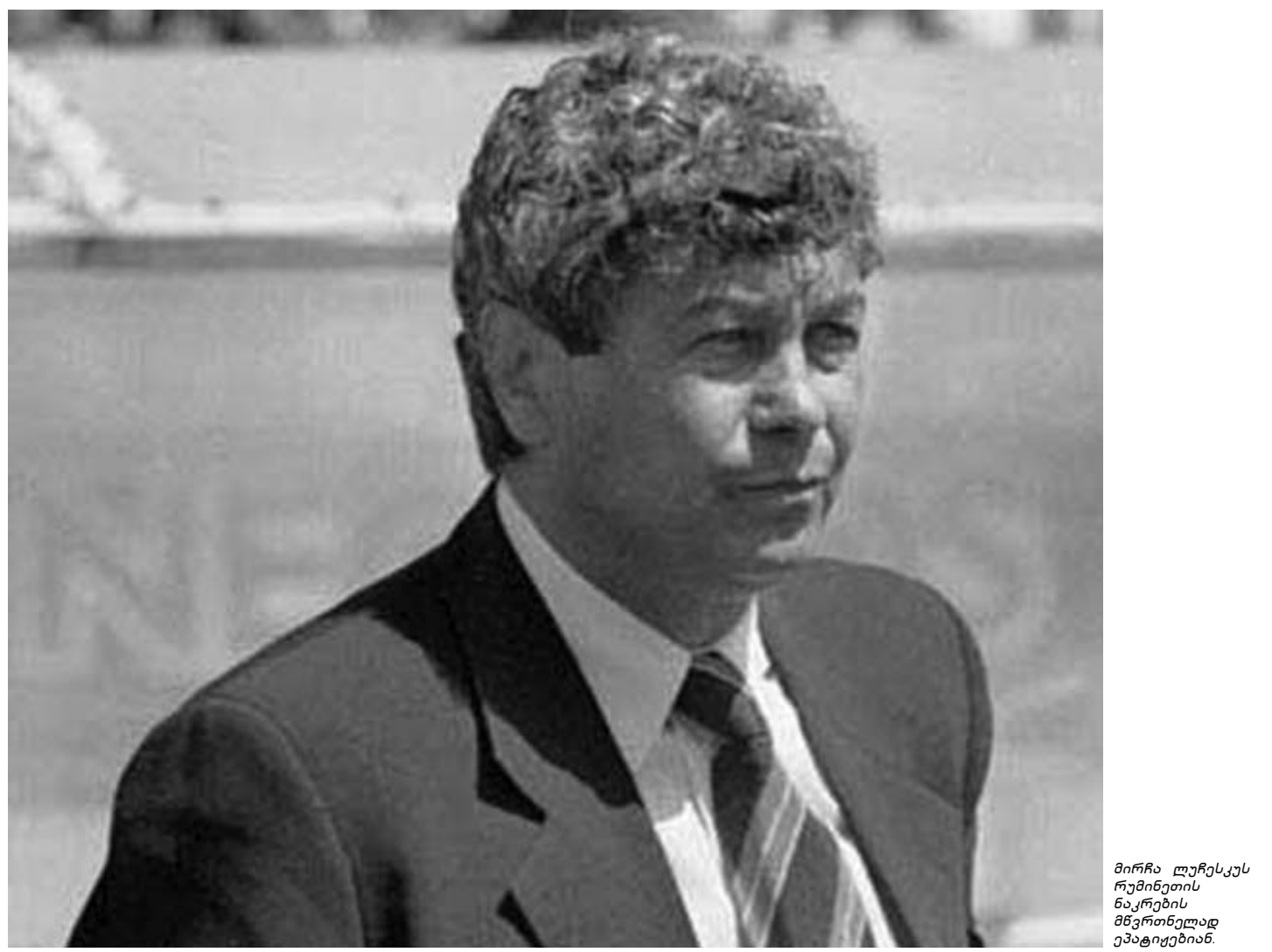
მიჩრა ლურესკუს რუმინეთის ნაკრების მწვრთნელად ეპატივებიან.

მიჩრა ლურესკუს კი შეიძლება თამაშად ეწოდის ყველაზე წარმატებული უცხოელი მწვრთნელი დონეციკის "შახტარის" ისტორიაში. მართალია, რუმინელმა, ნევიოსკალასი არ იყო, ვერ მოიგო უკ-