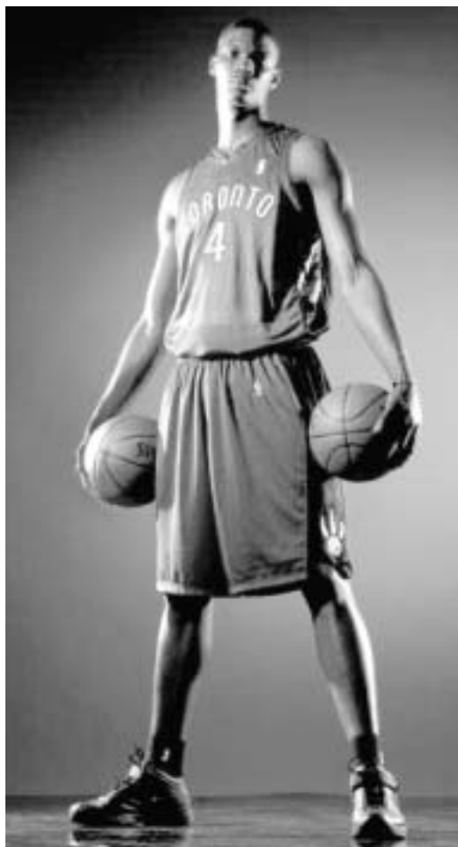
22 წლის ბოშმა “სან-ანტონიოს” 20 ქულა ჩაუყარა.

ასევე ოცი ქულა ჩაუყარა ტენსალებს რაფერ ალსტონმა. ჩლიქების შემადგენლობაში ყველაზე მაგარი ჩლიქი აღმოჩნდა ტიმ და-