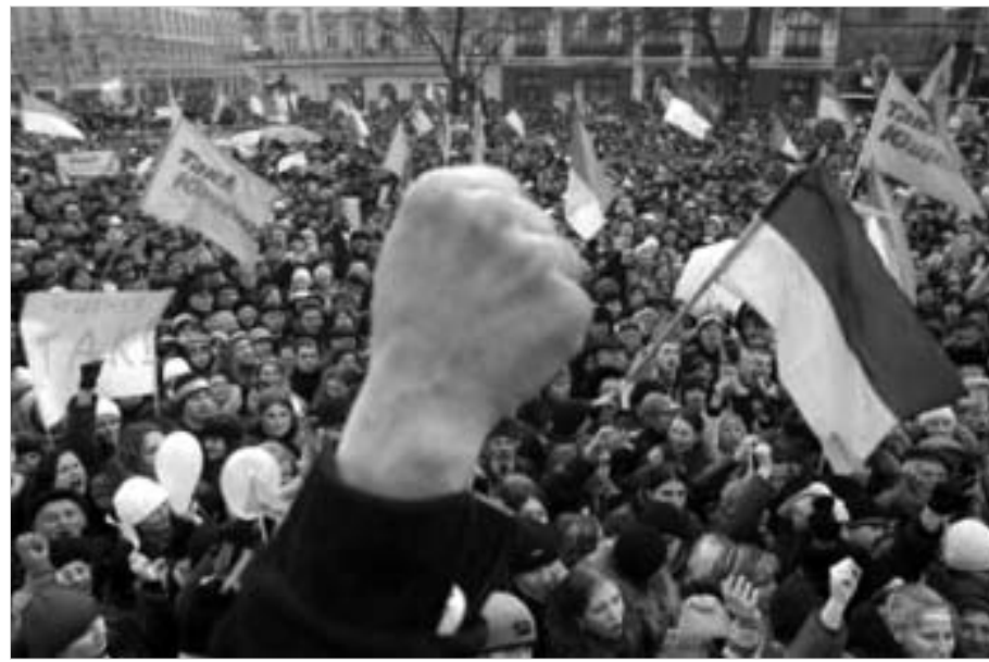
კიევის ცენტრში დამოუკიდებლობის მოედანზე იუშენკოს მხარდამჭერთა გრანდიოზული აქცია მიმდინარეობს.

ლომლის მომგვრელი იყო რუსეთის სახელმწიფო სათათბირო სპიკერის ბორის გრიზლოვის უკრაინის არ-