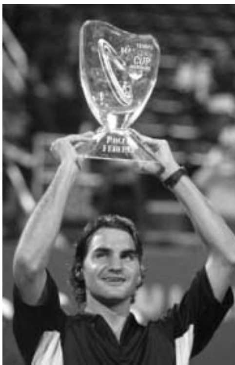
როყე ფედერაზა პიუსტონში წელს შე-11 ტურნირი მოიგო.

შვეიცარიელმა როყე ფედერერმა მოიგო წლის უკანასკნელი მასტარსი, რომლის საპრიზო ფონდი 4,45 მილიონი დოლარი იყო. ამერიკის ქალაქ პიუსტონში ფედერერმა დაამარცხა ტურნირის ორგანიზატორი ჯეიმს ლი. ანტონიო დი პაოლი - 6:3, 6:2. აშშ-ის კორტებზე გამარჯვებისთვის ფედერერმა 1,52 მილიონი დოლარი მიიღო, ამასთან, შვეიცარიელის ხელში გადავიდა ახალი "მერსედეს-ბენცის" მარკის მანქანა. ფინალური მატჩი დაეგმილზე სამი საათით ადრე დაიწყო. თავისი კორექტივები ტურნირის ორგანიზატორთან გეგმებში წვიმამ შეიტანა. თუმცა, ამან ფინალის ფაირობი როყე ფედერერი ვერ დათარგუნა. თამაშის დაწყებიდან უკვე 27 წუთში ფედერერი - 5:2-ს იგებდა. წვიმამ კი ფინალის მონაწილეებს კვლავ შეახსენა თავი და თამაში ამჯერად ერთი საათით შეწყდა. თუმცა, ამ იძულებითი შესვენების შემდეგაც მატჩის ხასიათი და მსვლელობა არ შეცვლილა. ათენის ოლიმპიურ თამაშებზე შვეიცარიის მედროვე დამაჯერებლად იგებდა გვიმს გეიმზე და პირველ სეტში მან ექვსი უიის ჩაგდება მოახერხა. მეორე სეტში ფედერერი გადამწყვეტ შეტევაზე გადავიდა და უფინალში პიუსტონში წააგო და უფინალის ხაზიდან უფორესი დარტყმებით. 4:1-ის შემდეგ შვეიცარიელმა უპირატესობა ხელდასა და გარკვეულად მატჩი პირდაპირ წააგო და უფინალის ხაზიდან უფორესი დარტყმებით. 4:1-ის შემდეგ შვეიცარიელმა უპირატესობა ხელდასა და გარკვეულად მატჩი პირდაპირ წააგო და უფინალის ხაზიდან უფორესი დარტყმებით.