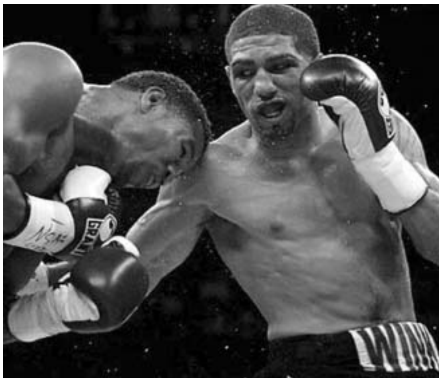
“ვინკის” მარჯვენამ საქმე გამარჯვებამდე მოიყვანა.

ხედავთ, რაითს უკვე ასარჩევად აქვს საქმე. მაგრამ ამგვარი უპირატესობა, ანუ კრივის ელიტაში გარევა იოლი სულაც არ ყოფილა. შეინ მოსლისთან თანაბარ ჩხუბში მარჯვებამდე ზღვარი სულ რაღაც ორი ქულა აღმოჩნდა. ორმა მსაჯმა 115-113 რაითის სასარგებლოდ დაითვალა. ერთმა კი ვერც ერთს ვერ მიანიჭა უპირატესობა - 114-114.