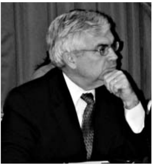
ჯორჯ ტილორი ქვეყანაში არსებული მაკროეკონომიკური ვითარებით დაინტერესდა.

გრძელდება ამერიკის შეერთებული შტატების ფინანსთა მინისტრის მოადგილის ჯორჯ ტილორის ვიზიტი საქართველოში. გუშინ ის ეროვნული ბანკის ხელმძღვანელობას შეხვდა და ბანკის მუშაობა დადებითად შეაფასა.