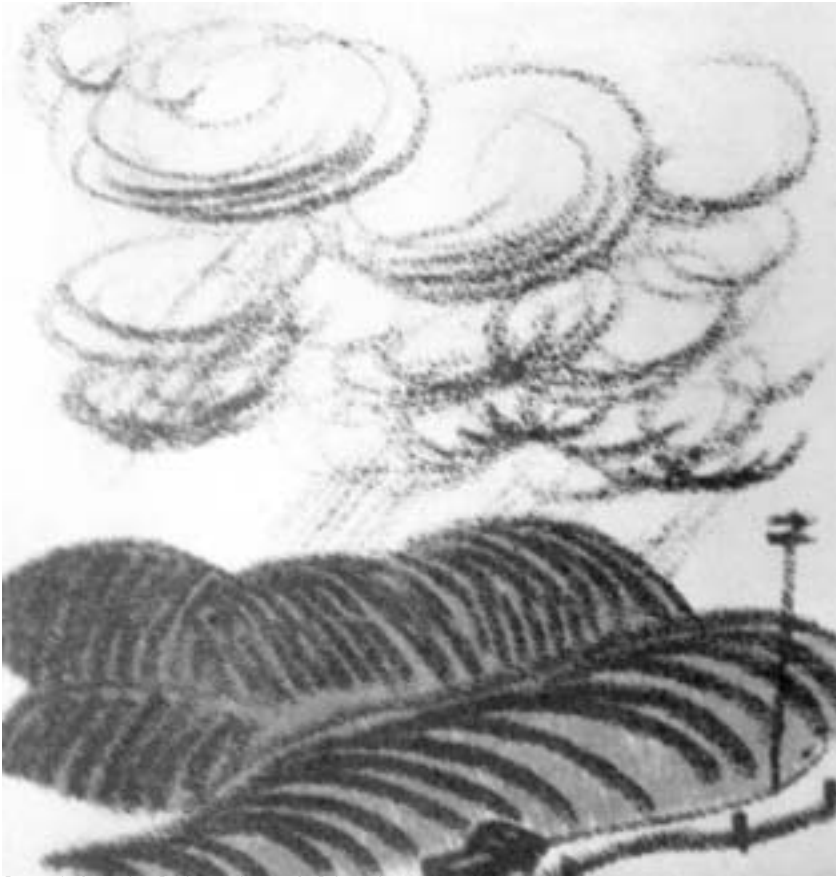
ნოდარ მალაზონიას გურული ჩანახატი.