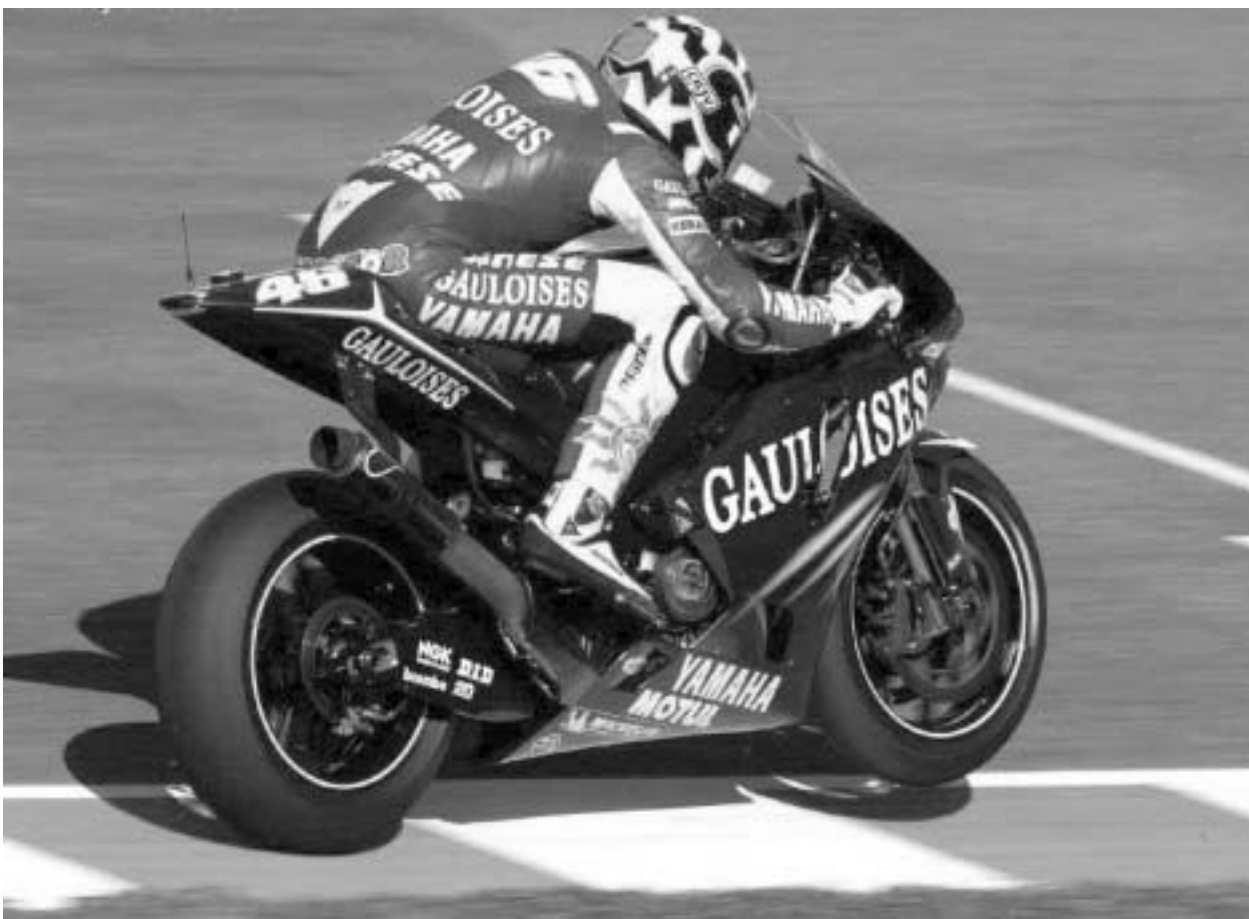
ვალენტინო როსის ქერ კიდევ დიდი გზა ჰქონია გასავლელი.

- რიდას "იაპაპი" გადახვედით, რას ელოდით? - არ ვიცოდი, რას მიმზადებდა ბედი, რა შეიძლებოდა მომხდარიყო. მხოლოდ ის ვიცოდი, რომ ავტოტელევი იყო, რაღაც შემეცვალა, რომ ახალი გამორჩევა მჭირდებოდა. უბრალოდ, მშენიერია, რომ "ოჯაპა" ჩემს ყველა ტექნიკურ მოთხოვნაზე მოახდინა რეაგირება. ეგეც არ იყოს, მოტო-