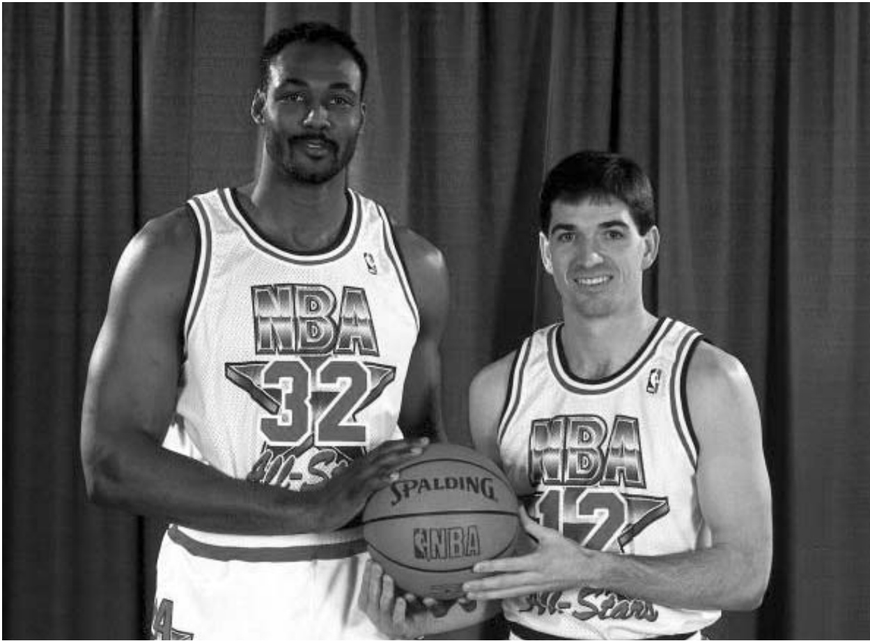
ორი დიდი სალაბურთელი - კარლ მელონი და ჯონ სტოქტონი.

მიუხედავად იმისა, რომ “იუტა ჯაზის” უკლებლივ ყველა კალათბურთელი თამაში ჩაატარა, ჯონი ანდრეი კორლენკოს მხრებზე გადატყდა. საქმე ის არის, რომ მატჩის დამთავრებამდე 4,4 წამი იყო დარჩენილი, როცა ანდრეი კორლენკომ ორი საჯარო ვერ გამოიყენა. მეორე ტყორცის შემდეგ ბურთი იუტელებმა მოხსნეს ფარდან, გორდონ გირჩიკმა ტყორცხა, მაგრამ მისი სროლა და სა-