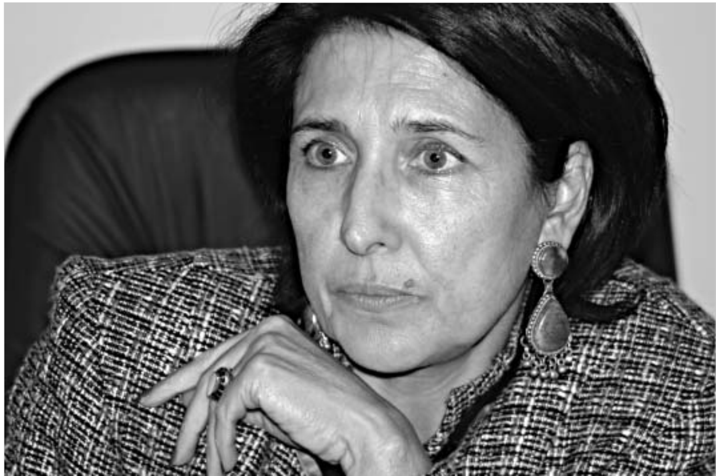
ბაი ბაზრქალაბა ფოტო