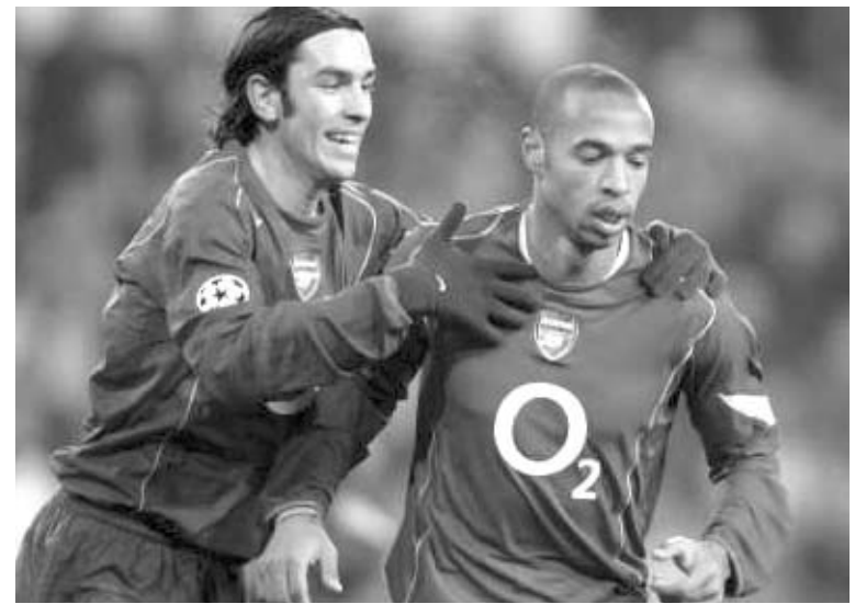
რიცხოვრივი უმცირესობის მიუხედავად, "არსენალმა" ფრე მიიღო გახეხვისა.