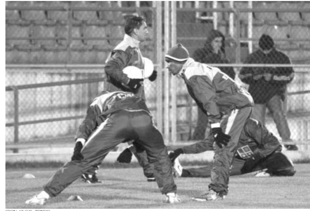
"სპორტინგმა" გუშინ ლოკომოტივზე იგარკიშა.