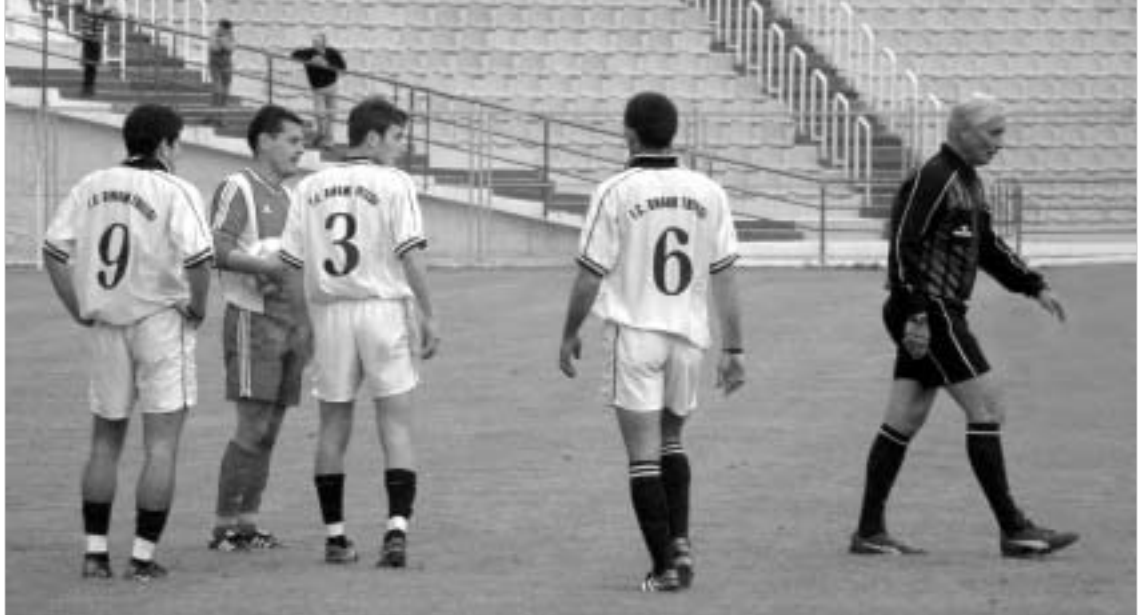
მსახიბი ფეხბურთელებს მეტ თავისუფლებას მისცემენ.

რამდენიმე დღის წინათ გამართული პრეზენტაციის შემდეგ საქართველოს პროფესიული ლიგა თავის ყოველდღიურ საქმიანობას დაუბრუნდა და საკმაოდ პრინციპულ ნაბიჯებსაც გადას. ლიგის ხელმძღვანელობამ საქართველოს ჩემპიონატის მატჩებში მსახიბთა იმსჯელება დასაყენებელიც გააკეთა. სამსახიბო-საინსპექტორ კომიტეტს რეკომენდაცია მიეცა, რომ საქართველოს ჩემპიონატში დაკავებულმა მსახიბებმა შეტი სიხისტიკა და ბრძოლისუნარიანობის გამოვლენის საშუალება მისცენ გუნდებს მოედანზე. "ასეთი სტილით მსახიბთა დიდი ხანია აპრობირებულია მთელ მსოფლიოში. აქედან გამომდინარე, უცხოელი მსახიბების გამოცდილების გაზიარება საგრძობლად გაზრდის ქართული ფეხბურთის განვითარების დონეს. სამსახიბო მსახიბის ის ფორმა, რომელიც აქამდე გვაქვს საქართველოში, როდესაც არბიტრი ნებისმიერ პატივს შესცხვებდა ანერჯის თამაშს, საგრძობლად ავდებს თამაშს ტემპს, შედეგად კი უფერულდება მთლიანად მატჩის საერთო სურათი. ყოველივე ეს ნათლად აისახება ევრო-ტურნირებზე ქართული კლუბების ასპარეზობისას", - ნათქვამია საქართველოს პროფესიული ლიგის განცხადებაში.