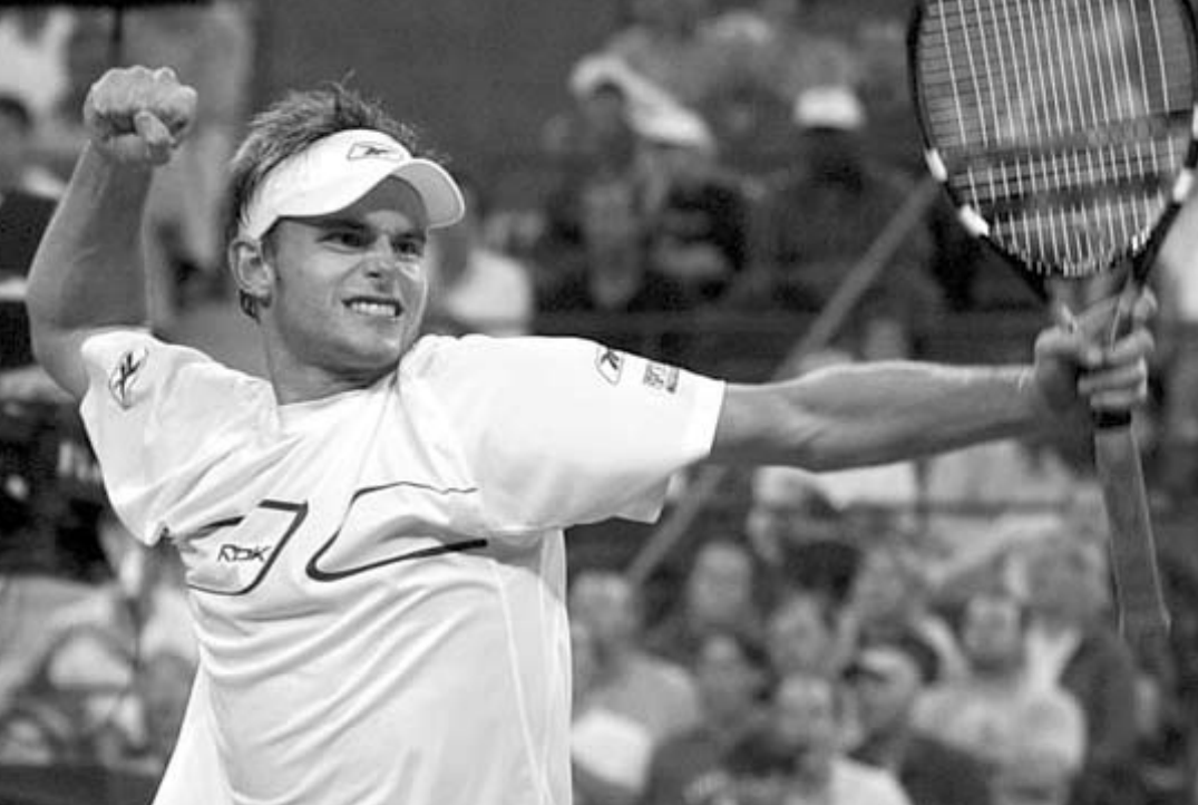
როდისკა ისევ პირველობა.