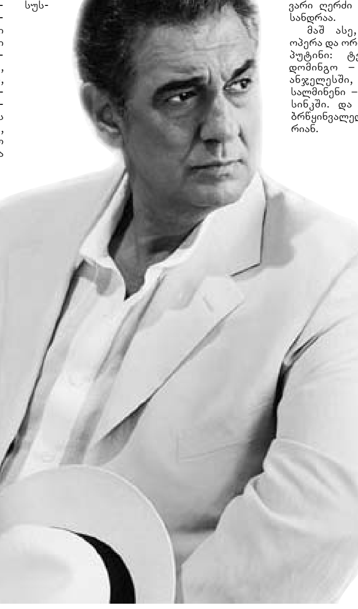
დომინგო - რასპუტინი.

ად აქცევდა“. მოკლედ, დემორადრეტულმა, დომინგოს გამო, თავისი პრინციპები დათმო. რასპუტინი მან მეორე აქტის ბოლოს „მოკლა“. ამიტომ მესამე, დასკვნით აქტში რასპუტინი სცენაზე აღარ დგას. „სულელი ხომ არა ვარ. მესამე აქტი ყველაზე მოკლე გააკეთებ“, - აღიარა ოპერის ავტორმა.