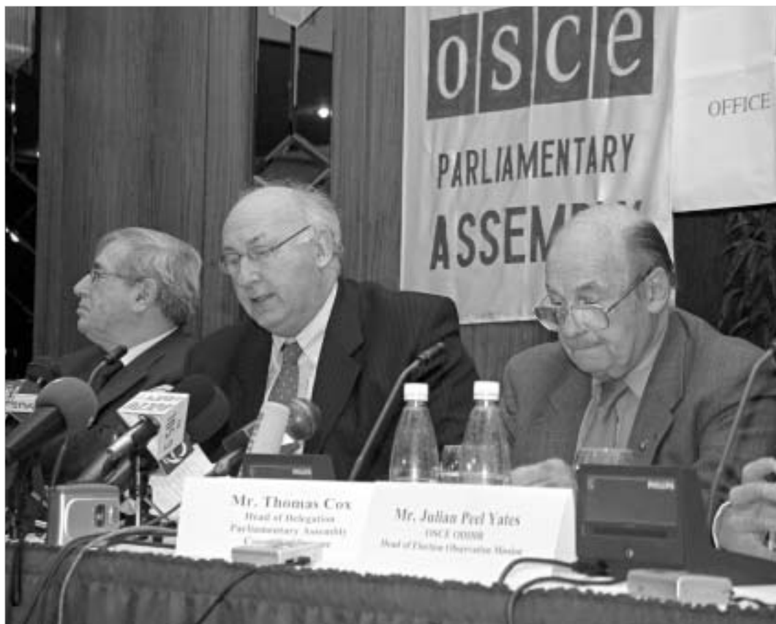
უცხოელი დამკვირვებლების აზრით ქართველი ამომრჩეველი უკეთეს არჩევნებს იმსახურებს. ბთან დაკავშირებული პრობლე-მების მიცემის უფლება წაერთვა, უცხოელები სიტყვიერ თანაგრძ-ბარს განკარგულებების გამო, ხმის მიცემის უფლება წაერთვა, უცხოელები სიტყვიერ თანაგრძ-

საერთაშორისო დამკვირვე-ბელთა მისია ერთ თვეში გამოაქ-ვეყნებს ყოვლისმომცველ ანგა-რიშს 2 ნოემბრის არჩევნებთან დაკავშირებით. მანამდე უცხოე-ლები აცხადებენ, რომ საქარ-თველოს ხელისუფლებამ დღევან-დელ შეცდომებზე უნდა ისწავლო-ს. უცხოელ დამკვირვებელთა მისია მადლიერებას და პატივის-ცემას გამოხატავს ქართველი ამომრჩეველისადმი, რომელმაც 2 ნოემბერს მოქალაქეობრივი აქ-ტიულობა, "კოლექტიური სული" გამოაჩინა. ხოლო ამომრჩევე-ლთა იმ ნაწილს, რომელსაც სიე-