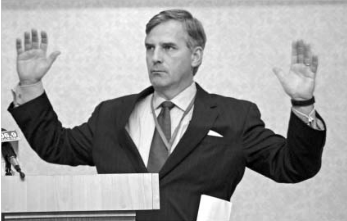
ინსაულის თუ არა ჭკას ეს ქვეყანა და მისი მთავრობა გაუმნდელი დღის შემდეგ?