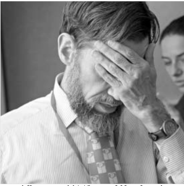
ყველა უბანზე იყო გაყალბების სრულიად გამიზნული მცდელობა.

ეს, შეიძლება, არ ეხება არჩევნებს, მაგრამ უნდა ვთქვა, რომ საქართველო სერიოზულად უნდა დაფიქრდეს იმაზე, რამდენად ვრცელდება მისი სუვერენიტეტი ამ ადგილებზე. ძირითად საარჩევნო უბანზე, მარნეულის გაყალბების შემთხვევის შემთხვევაში, ამაზედა აზერბაიჯანის ცენტრალური საარჩევნო კომისიის წევრი, ზოგიერთ საარჩევნო უბანზე აზერბაიჯანის დროშა ფრიალებდა და აზერბაიჯანის ეროვნული ჰიმნი ისმოდა. ქართული დროშები ბევრგან არ ყოფილა.“