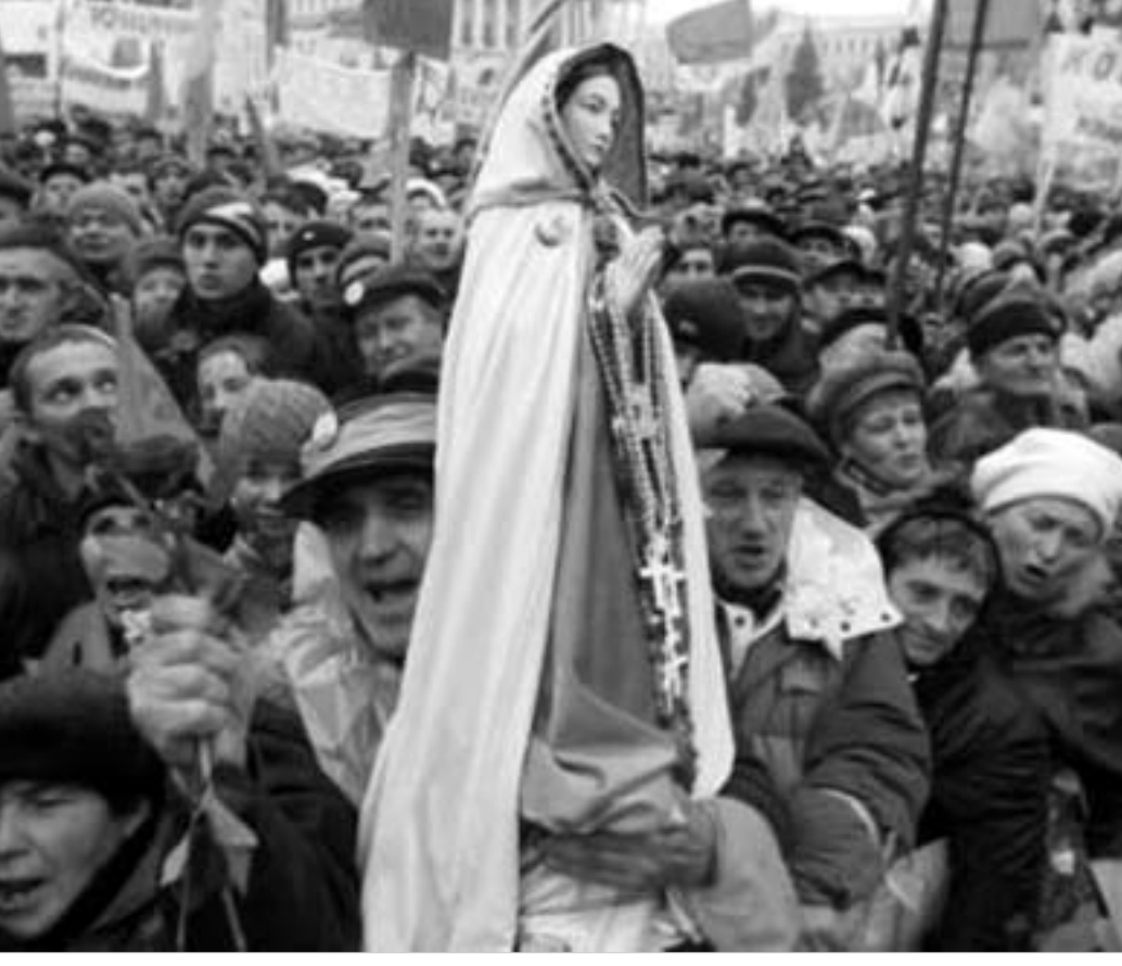
უკრაინაში დემოკრატიული მოქმედებების შედეგად ხალხი იღებს.

საქართველოში განხორციელებული მშვიდობიანი რევოლუცია მართლაც მაგალითის მიმცემი გახდა იმ ადამიანებისათვის, რომელთაც აქამდე არ სჯეროდათ, რომ მათ ხმა და ნება შეიძლება რამე შეეცვალოს.