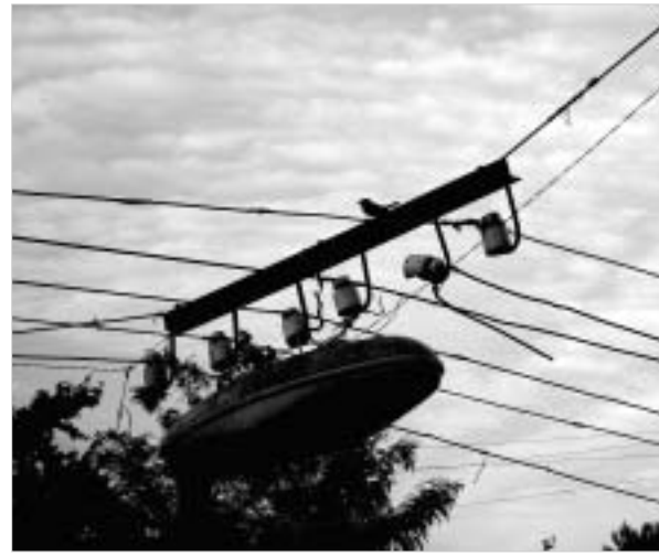
თუკი "თელასი" ესაფუძვლიოდ გადაიკირით ელექტროსადენებს, გასსოფვით, ოცენის უფლებებს ოციკალიური დოკუმენტების მითელი რიგი იკავს.

შრომის, ჯანმრთელობისა და სოციალური დაცვის სამინისტროს, ფინანსა სამინისტროს და სახელმწიფო ფონდის ერთობლივი გადნწვეტილებით, 2005 წლიდან აღნიშნული პროგრამა ფონდში აღარ იქნება. უშუქო ადამიანი