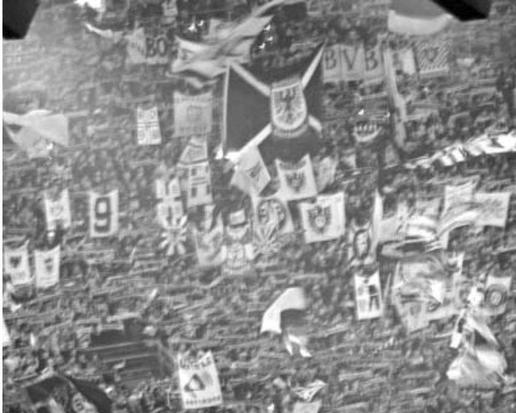
დორტმუნდელი გულშემატკივრები გუნდისკენ მხოლოდ გამარჯვებას მოითხოვენ.

მი დღით ადრე დატოვა, კლუბის საერთო ვალმა 118,9 მილიონ ევროს მიაღწია, ხოლო ბოლო ფინანსურ წელს ოპერატიულმა დანაკარგმა 68 მილიონი შეადგინა. ფინანსური წარუმატებლობა გუნდის წარუმატებელმა თამაშმა განაპირობა. ერთ დროს თითქმის დაბეჭეული ჩემპიონთა ლიგის საგზური ინტერტოტოს საგზურით შეიცვალა, ხოლო გერმანიის ჩემპიონატში გუნდი გათამაშების ცხრილის ფსკერისკენ დაეშვა. დორტმუნდელებმა ვერც გერმანიის თასის გათამაშებაში გამოიჩინეს თავი. გიომ ვარმიუს, ნორვეგიელი ბერგდოლმოსა და დანიის ნაკრების ფეხბურთელის ნიკლას იენსენის შექენამ არ გაამართლა. დაბნეული დაცვის ხელმძღვანელობა კვლავ გერმანიის ეროვნული ნაკრების ვეტერანს კრისტიან ვიორნსს და სებასტიან კელის უწევთ. ხოლო შეტევაში იან კოლერსა და ტომას როსიცკის პარტნიორთა მხრიდან მხარდაჭერა აკლიათ. ვან მარვეიკმა ამ სირთულეების წინაშე ქედი არ მოიხარა და მედგარი ხასიათი გამოავლინა. "ჩვენ ვადგებულნი ვართ, გადავრჩეთ და ამას გავაკეთებთ კიდევ", - განაცხადა მრტერინდამის "ფეინორდის" ექს-მწვრთნელმა. თუმცა, ბრძოლისუნარიანი გუნდის ჩამოყალიბება ხელმძღვანელობის მხრიდან ასეთი გაუგებრობის პირობებში მარვეიკს ძალიან გაუჭირდება.