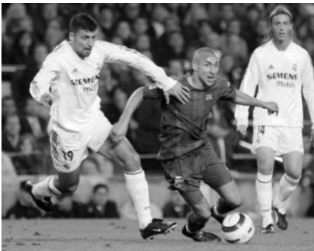
ჰენრიკ ლარსონი შედეგით ბოლო 50 წლის საუკეთესო ფეხბურთელად აღიარეს.

გუნდში. მომდევნო სეზონში ის პოლანდის "ფეინორდში" გადავიდა, ხოლო ერთი წლის შემდეგ კი შედეგის ეროვნულ ნაკრებს აშშ-ის მსოფლიო პირველობაში მესამე ადგილის დაკავებაში დაეხმარა. მესამე ადგილისთვის მატჩში მან ოთხიდან ერთ-ერთი გოლი გაუტანა ბულგარელებს, ხოლო მეოთხედფინალში, პენალტების სერიაში მან რუმინეთის ნაკრების კარში გადაწყვეტი დარტყმა გამოიყენა. აშშ-ის მსოფლიო ჩემპიონატზე ლარსონს თბილი მოგონებები დარჩა. მაშინ მას გადაწყვეტი თერთმეტმეტრიანის დარტყმა მიანიჭეს. არადა, საერთაშორისო არენაზე თამაშის არცთუ ისე დიდი გამოცდილება ჰქონდა. "მე 23 წლის ვიყავი და არაფრის დარდი არ მქონდა, - ილიმება ლარსონი, - პატრიკმა (ნაკრების კაპიტანი პატრიკ ანდერსონი) მითხრა, რომ მე მეექვსე პენალტს დავარტყამდი. დაეთანხმდი. მაშინ ახალგაზრდა ვიყავი და მიამიტი. ვერც კი წარმოემდგინა, თუ რაოდენ მნიშვნელოვანი იყო ეს დარტყმა". 1998 წელს ლარსონმა გლაზგოს მიაშურა და იქ შეიძინა სეზონის განმავლობაში დარჩა. მაღალმა შედეგაინობამ, შემართებამ, შრომისუნარიანობამ და საქმისადმი სერიოზულმა მიდგომამ ლარსონს "სელტიკის" გულშემატკივართა დიდი სიყვარული მოუტანა. შედეგად, შოტლანდიის ჩემპიონატში გამართულ 221 შეხვედრაში ლარ-