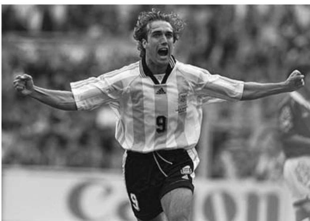
გაბრიელ ბატისტუტა: "ფიორენტინა" ჩემი მშობლიური გუნდია."

მდეგ, ზაფხულში, დიდი პაუზისა და ხანგრძლივი სარეაბილიტაციო ეტაპის გავლა მომიხდა. სამწუხაროდ, მინდორზე დაბრუნების შემდეგ იძულებული ვიყავი, ხელმეორედ შემევენა, რამაც რიტმიდან ამომაგდო. - მას შემდეგ, რაც ოპერაცია გაიკეთო, რეგულარულად ვრცელდებოდა ინფორმაცია იმის შესახებ, რომ თქვენ ყატარს მიატოვებდით. მართლა აპირებდით გუნდის შეცვლას? - არა. სარეაბილიტაციო პერიოდი არგენტინაში, "სან ლორენცოში" გავიარე. ოპერაციის შემდეგ სწორედ ამ გუნდთან ერთად ვეარჯიშობდი ფორმის აღდგენის მიზნით. ამან ბევრი ეჭვი და მითქმა-მოთქმა გამოიწვია, თუმცა, სინამდვილეში "ალ-არაბიდან" ნასვლაზე არც მიფიქრია. - მაგრამ მას შემდეგ, რაც "ფიორენტინა" სერია A-ში დაბრუნდა, თქვენს სახელს ამ გუნდსაც უკავშირებდნენ. - მართალია. ამ გუნდის ამბებს დიდი ყურადღებით და სიხარულით ვადევნებდი თვალს. "ფიორენტინა" ჩემი მშობლიური გუნდია. - იქაურობა გენატრება? - რა თქმა უნდა. ამ გუნდში ჩემი კარიერის ულამაზესი, ყველაზე წარმატებული წლები გავატარე. მათ რომ ჩემთვის მოემართათ, უარს ნამდვილად ვერ ვეტყვოდი. - გამოდის, რომ კარიერის დამ-