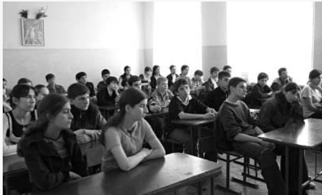
ბაიასა კანონიკური კულტურის ფოტოები

მეოთხე და უმთავრესი არის ის, რომ მაღაზიებში იყიდება დანები. ე.წ. "ბაზოჩკები". მე ვფიქ-რობ, რომ ეს დანები არ უნდა მიჰყიდონ არასრულწლოვნებს და საერთოდ არ უნდა იყიდებოდეს. ამ დანების მსხვერპლი არა ერთი ბიჭი გამხდარა. არავის არ უნდა ვინმე მოკლას, მაგრამ ეს შე-მთხვევით ხდება.