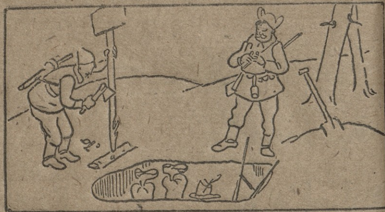
— ეხლა ჩაიბარე მიწის მულშივი სარგებლობის აქტი.