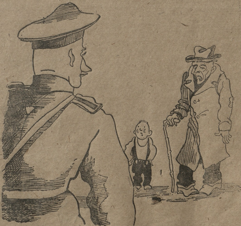
გაბუა — მოგვიყვანეს მე და ჩემი უვილწევილი ფიურერის არმიის შესახებზედა.