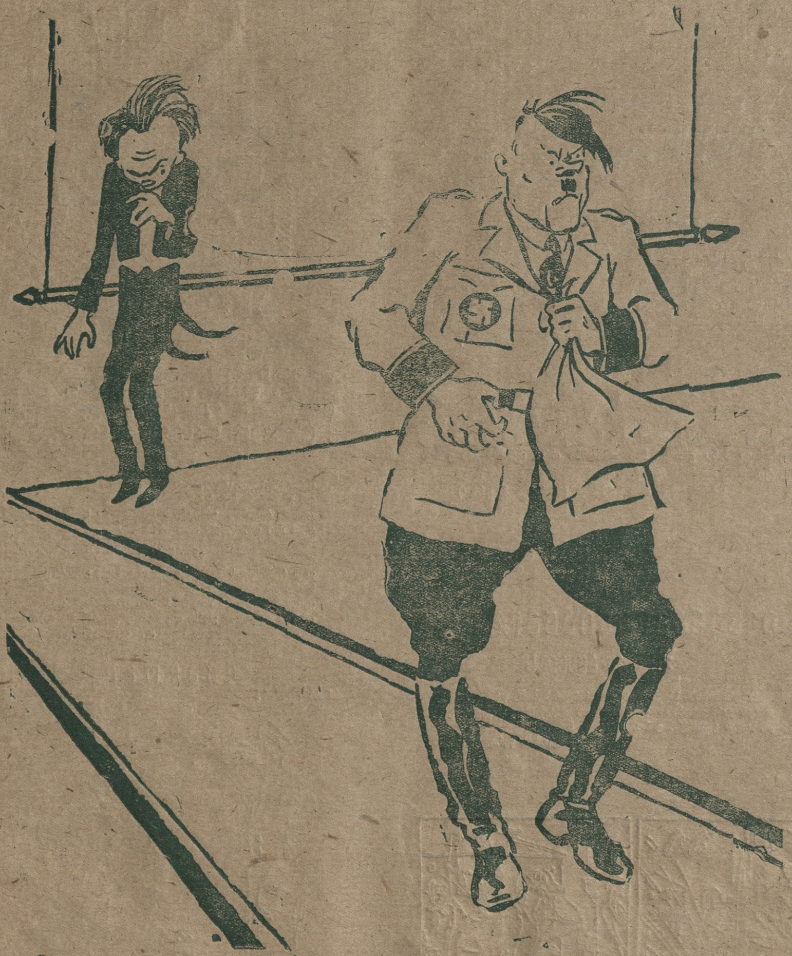
— მე წითელი ჯარის თვალის სახსვევად უარყვავი ჩვენ მიერ შეტევაზე გადახდის ფაქტი და ჩემი გენერლები კი წართლაც თავდაცვაზე გადავიდნენ და... ველარც ის მოახერხეს.