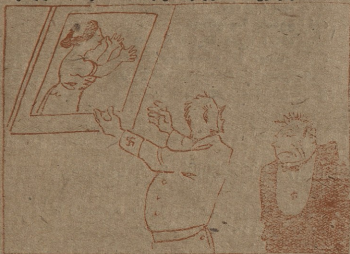
3. — ვიცი, ვიცი მხატვრობის უკვდავ ძეგლებსაქვენ არის მიმართული.. აი ჩემი არიელი მხატვრის ახალი ნიმუში. „არიელი ქალი უარს ეუბნება არაარიელ ხაქმაროს“. ხომ ჩინებულია?