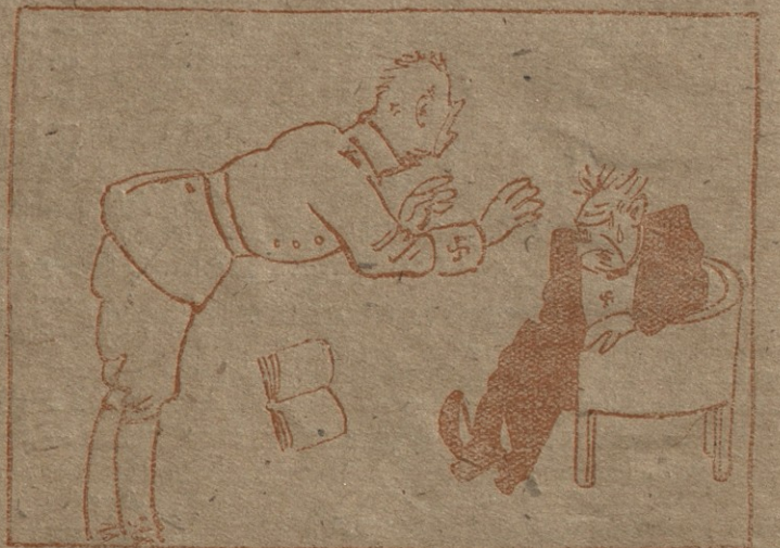
6. — რა? რა სთქვით... ღმერთო!.. რა გეშარებოთ... თქვენ მტკად მოქანცული სართ... თავის ტკივილიც გემჩნევათ... მოისვენეთ და შემდეგ განვაგრძობთ საუბარს ჰაეზიისა და ხელფანების შესახებ.