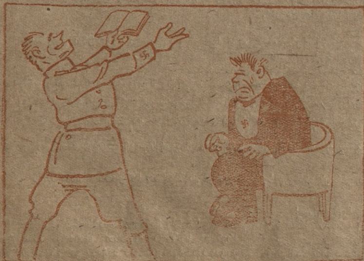
5. — მივხვდით, მივხვდით, სამხედრო მოქმედების ასახვ. თანამედროვე არიულ პლუზიაში. აი ჩემგან შექმნილი ნიმუში დასტებით