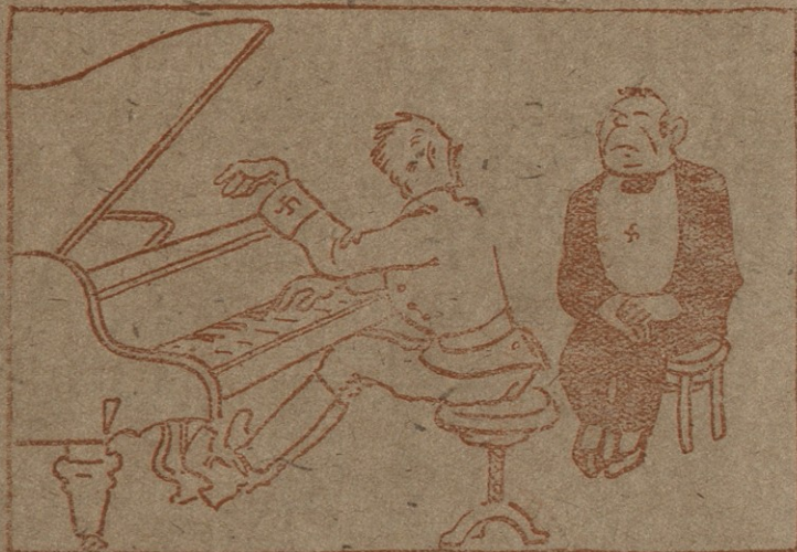
1. —ვერ წარმოიდგენთ როგორ ხასიათდებოდა შერ, თქვენი მობრძანება, არ ვიცის რით გამოვხატო ჩემი აღტაცება. დავფურავ თქვენი ქვეყნის განთქმულ კომპოზიტორის მუსიკას „შეხვედრას“.