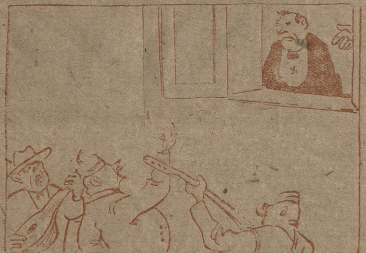
4. — ვიცი, ვიცი მუსიკა, ხამლერებით! აი, მოისმინეთ! ისინი მთელ დღეს ასე გამღერავენ ღვთაებრივ ჰიმნებს ღერძის სახელმწიფოების მტკიცე კავშირის საღიღებლად.