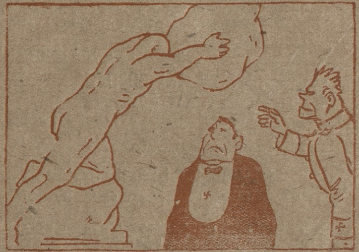
2 — ვიცი, ვიცი იტალია სამშობლოა ხელფანებისა. თქვენ აღბად ქანდაკება გაინტერესებთ. აი, ინებეთ! ეს არის ახალი ქანდაკება „გაღვიძებულ იტალიას“ ნუ მორცხვობთ, ახლახ გასინჯეთ.