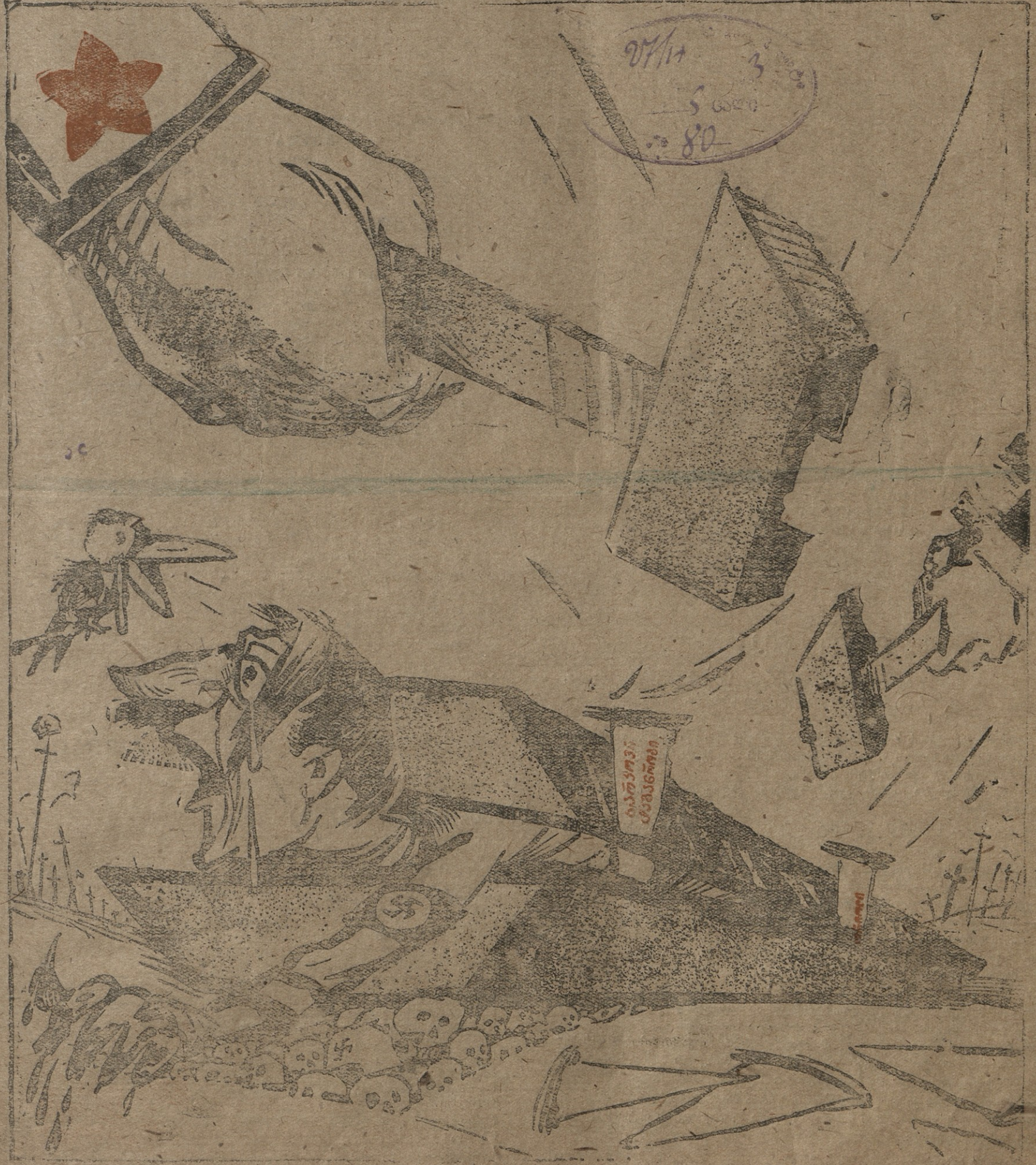
ყმაზი (შიტლერს)—ადოღვ, ნუ ღრიალებ, შენ თუ თავს დასტირი, ჩემიც იკითხე: იმედი მქონდა სასრჩობელაზე ავიყვანდნენ და შენი ლეშით გამოვძლებოდი. ასლა კ კუბოში ჩაჭედული შენ ვასდები მხოლოდ ჭია-ღუების კერძი...

„წითელი ჯარის ორიოლთან გამარჯვება ეს არის კიდევ ერთი დიდი ლურსმანი შიტლერის კუბოში ჩაჭედული...“ („დიდი სკეტჩი“)