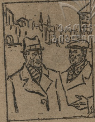
— რაბი ვამბს ახე მხიარული სხეზე — იმიტომ, რომ შეგერა საბალოთი ვამარჯებებო... — მას გუფლიად არ ჩაუვლია ვეწებლის პრამა- განდაბ? — არა, მე შეგერა, რომ ვამარჯებებს სხიარულე და ფაშისმი დებობი.