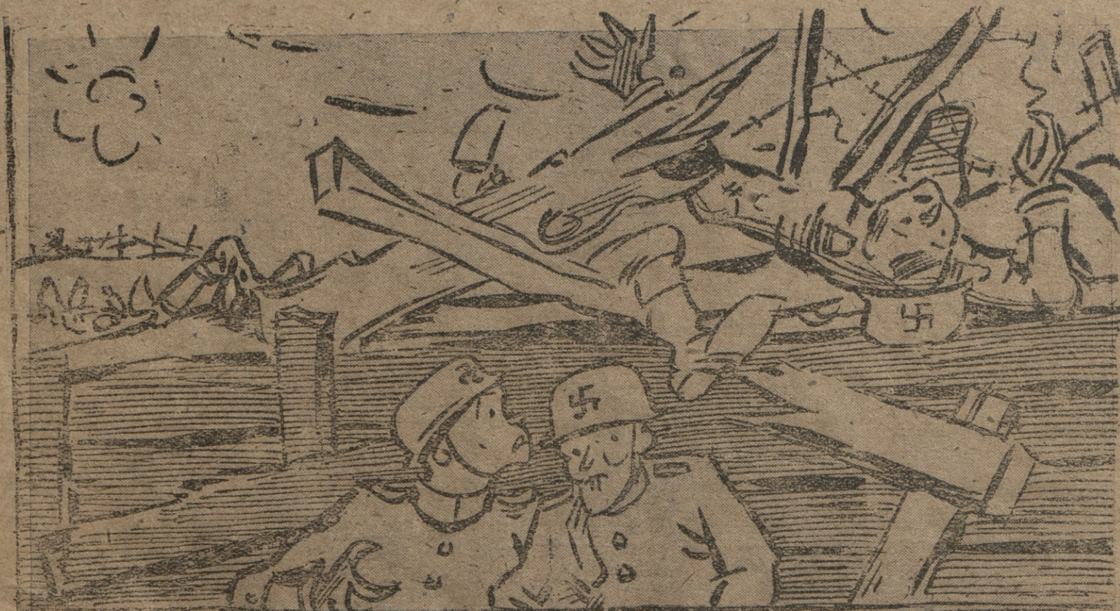
— რუმინეთში ბრძოლით არაფერი გამოდის. ჩვენი მატალიონიდან ხუთაოდე ჯარისკაცი დაფრხოთ. ჩვენც აღმათ მალე ჩავგაბაღებენ. — იმეღს ნუ კარგავ მანს, ჩქარა უნდა გამოგვეცვაღონ. — ხანამ გამოგვეცვლიღენ ჩვენც ვაღავეცვღებოთ.