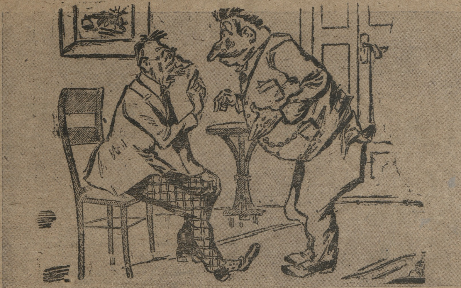
— ჩემი აზრით ეს ხაკიბი... ხომ არაგინ გვუფერავს? — მთელა, ჯერ კარი დავბურთო, ფანჯრებიც... ჩავაქრათ სინამდღე.