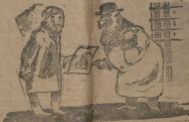
მამლდინი—აი ბატონო, ამ კონკრა სახლს, რომელიც მდებარეობს სხამოლის ვანაპირა უბანში, ვავაფორმებთ შქვეწმწახსებზე.

სახლს პატრონი—შეგდართოდლინი სახლი ამ ქუჩის ვადაცდელაო მამლდინი—აროვარც ვიჭირდებ, ისე ვიღირ-დესო—ჩაბეგინა,—სანავიტირად იქ უმეზრად იქნებო.