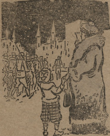
ღმდა: — ჩედავ, ბაპუკო სტუდენტები მიყავთ. — უნივერსიტეტში? — არა, კონცხანაკში.