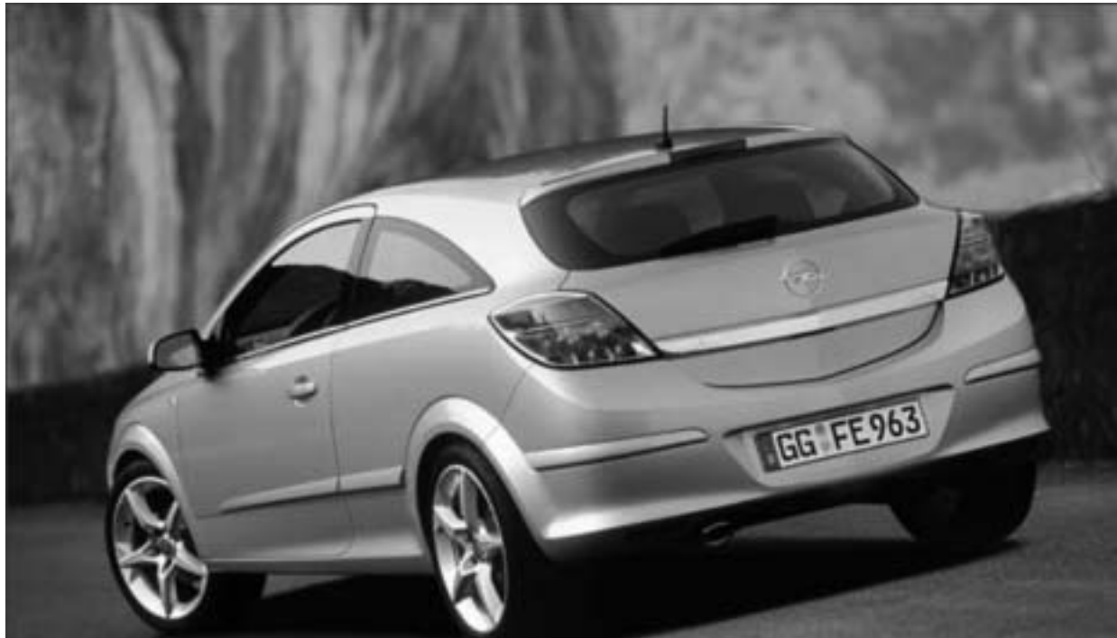
სიახლე!!! OPEL ASTRA უკვე თბილისშია

სია კეისი და 80-იანების კერპი - პრინცი. კატეგორიის - "საუკეთესო სასაუბრო ალბომის" პრეტენდენტია ბილ კლინტონის ნიგინსი - "ჩემი ცხოვრების" ხმოვანი ვერსია. შეგახსენებთ, შეერთებული შტატების ყოფილი პრეზიდენტი მიხეილ გორბაჩოვთან და მსახიობ სოფი ლორენთან ერთად შარშან "გრემის" მფლობელი გახდა სერგეი პროკოფიევის მუსიკალური ზღაპრების ჩანაწერში მონაწილეობისთვის.