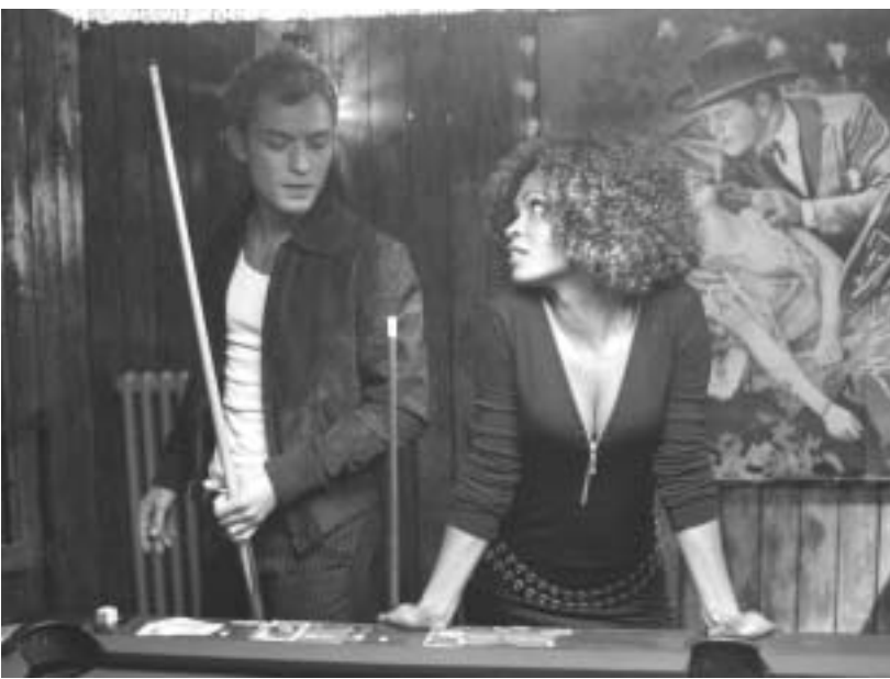
კადრები ფილმიდან: "სიახლოვე". "კინსი" და "ალფი"

შეიყვარე, მაგრამ არ შეგეშინდეს მორიგი სიყვარულის. როცა სხვა სიყვარული მოვა, გაბედულად უღალატე ძველს, ოღონდ თქვი კიდევ ამის შესახებ, რადგან გამჟღავნებული სიმართლე თავის გამართლებას ჰგავს. გამჟღავნებული სიმართლე დაგარწმუნებს, რომ არც ისე ცუდი ხარ. დაახლოებით ასეთია თანამედროვე ფილოსოფია ქალისა და კაცის ურთიერთობაში, რომელიც "ნიუ იორკ ტაიმსის" ჟურნალისტმა ბოლო ორ თვეში გამოცემულ სამ სხვადასხვა ფილმში აღმოაჩინა.