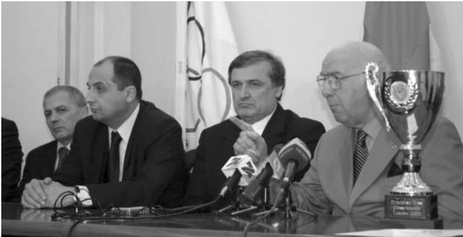
პროფ. ანატოლი შოტო