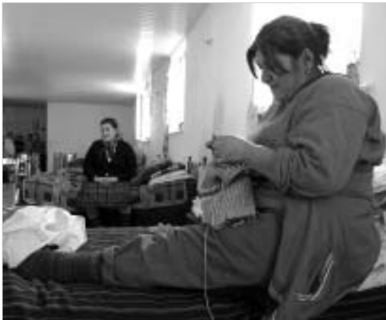
ექვსი წელია, ვზივარ. ჩემს სამ შვილს ბებია ზრდის", - ამბობს პატიმარი ქალი.

თავისუფლებააყრილი დედაბი და უდავოდ დარჩენილი გვიღებენ