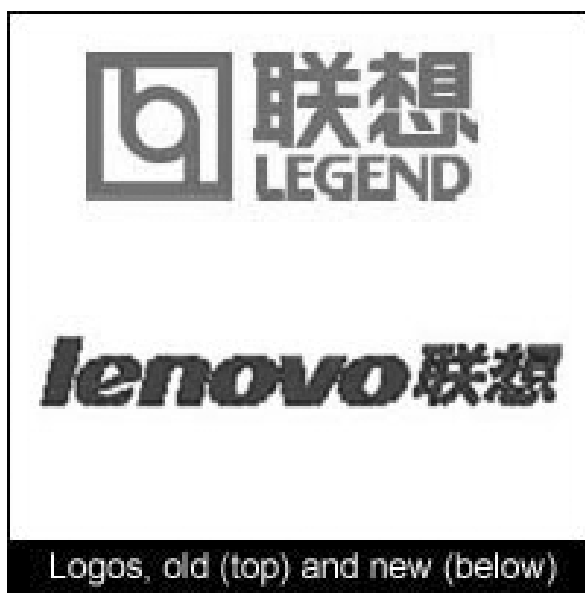
Logos, old (top) and new (below)

პერსონალური კომპიუტერების პიონერი "აიბიემი" ამერიკიდან კომპიუტერებს აღარ გამოუშვებს. კომპანიამ პერსონალური კომპიუტერების ბიზნესი ჩინეთის უმსხვილეს კომპიუტერების მწარმოებელს, "ლენოვოს" მიჰყიდა. გარიგება 1,75 მილიარდ დოლარად შეფასებული და მის შედეგად "ლენოვო" მსოფლიოს სიდიდით მესამე კომპიუტერების მწარმოებლად იქცევა. ეს კომპანია რამდენიმე წელი ცდილობდა თავისი მარკის მსოფლიო ბაზარზე გატანას და "აიბიემის" განყოფილების შესყიდვის შემდეგ ეს ნამდვილად აღარ გაუჭირდება. თავად "აიბიემი" კი ყურადღებას სხვა საქმიანობებზე გადაიტანს. გარიგების შედეგად "აიბიემი" ნაღდ ფულად 650 მილიონ დოლარს მიიღებს და, ამის გარდა, კონტროლს დაამყარებს "ლენოვოს" (ყოფილი "ლევანდ") 18,9-პროცენტთან ნილზე. გარდა ამისა, "ლენოვოს" პერსონალური კომპიუტერების მთავარი ოფისი პეკინიდან ნიუ იორკში გადავა. გაერთიანებული