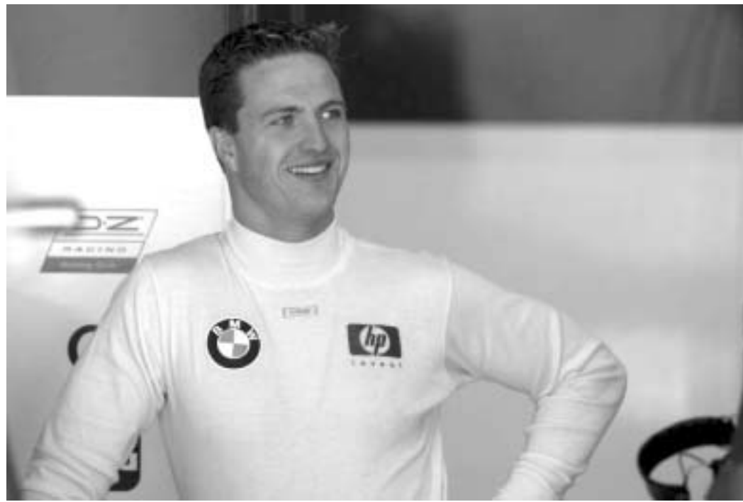
რალფ შუმახერი სექს-ბიზნესის წამოწყებას აპირებს.

რალფ შუმახერმა, რომელსაც ფორმულა 1-ის ფანატები დიდი ჩემპიონის მძად მოიხსენიებენ, ნოემბრის მიწურულს სექს-ბიზნესის წამოწყების თაობაზე ამცნო ქვეყანას. თითქოს საქმეც დაიძრა. გერმანულ ფორმას Beate Ushe-ს სლოვენიაში რვა სექს-შოფისგან შემდგარი ქსელის გახსნაც მოჰყვება. Beate Ushe-ს სლოვენიაში რვა სექს-შოფისგან შემდგარი ქსელის გახსნაც მოჰყვება. Beate Ushe-ს სლოვენიაში რვა სექს-შოფისგან შემდგარი ქსელის გახსნაც მოჰყვება. Beate Ushe-ს სლოვენიაში რვა სექს-შოფისგან შემდგარი ქსელის გახსნაც მოჰყვება.