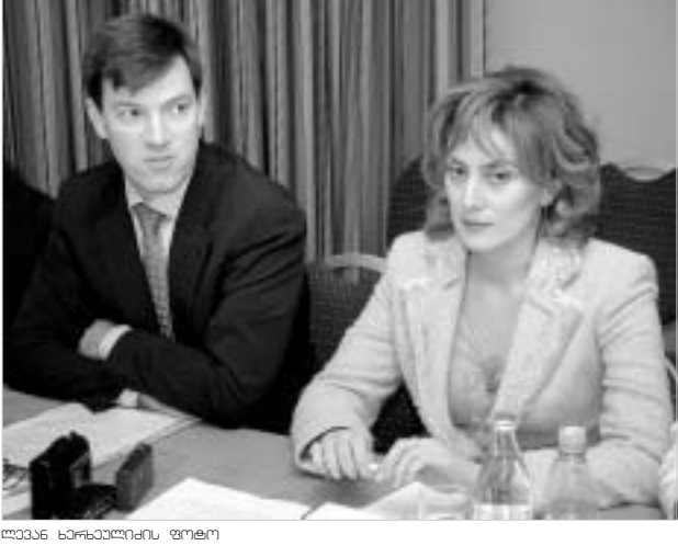
"IFC-ის კვლევის შედეგებში მართლაც მძიმე სურათი აჩვენა. აშკარაა, რომ პრობლემები ყველა მიმართულებით არსებობს."

კორპორაციული მართვის კულტურა ქართულ საწარმოებში ძალიან დაბალი დონეზეა, - ასეთი იყო დასკვნა, რომელიც საერთაშორისო საფინანსო კორპორაციის (IFC) მიერ საქართველოში კორპორაციული მართვის შესახებ ჩატარებული კვლევის შედეგებზე დაყრდნობით გაკეთდა. კვლევის შედეგების პრეზენტაცია გუშინ სასტუმრო "არაოტო ქორთბინადში" გაიმართა.