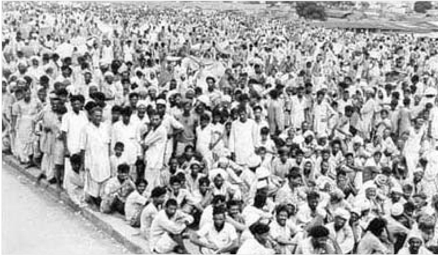
სამოქალაქო დაუმორჩილებლობა ისე, როგორც განდიმ განსწავლა

კი დაიჯერონ, რომ ასეთი ადამიანი ამქვეყნად არსებობდა."