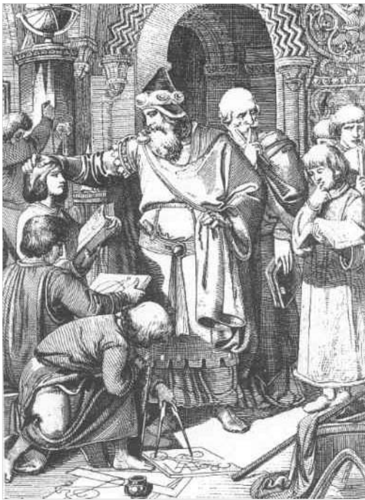
სენიორი მოვიდა სამონასტრო სკოლის დასათავლიერებლად

ლათინური ენის ხარისხიანი შესწავლისა და გონების ჩამოსაყალიბებლად შეუცვლელი იყო რომის რესპუბლიკის პერიოდისა და ავგუსტუს კეისრის ხანის ავტორთა შესწავლა. მაგრამ ამ ტექსტებს ერთი სულიერი ხიფათიც ახლდა: ავტორთათვის სანიშნუში ზნეობა და ფილოსოფია, მათ მიერ გამოყენებული გრძობიერი მსატრუელი სახეები. ქრისტიანებმა მალე იპოვეს კომპრომისული კომენტარის საშუალება, რის შედეგად შეისწავლებული გახდა კლასიკოსთა ერთგვარი აღორძინება კარლოს დიდის დროს. მაგრამ კლუნის მონასტრის და სამონასტრო მოძრაობა სწორედ იმ მიზნით დაარსდა, რომ გარკვეულად დაპირისპირებულიყო ავტორთა შესწავლასთან.