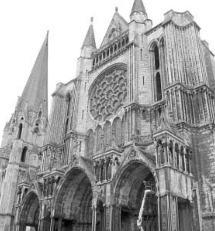
შარტრის საკათედრო ტაძრის ფასადი

მრავალწლიანი შემქმნველი მოღვაწეობა ამაოდ არ დაკარგულა : ახალი დროის გარბრაჟზე სწორედ მეფეთა და სხვა დიდგვაროვანი ფეოდალთა კარზე წარმომოპოლი განათლების კულტა და რთული ეტიკეტი გახდებდა ცივილიზაციის იმ პროცესის პირველ მაშობრავებელ ძალად, რომელიც ცხოვრების ევროპულ წესს მსოფლიო კულტურული და ეკონომიკური ბატონობისკენ გაუხსნის გზას.