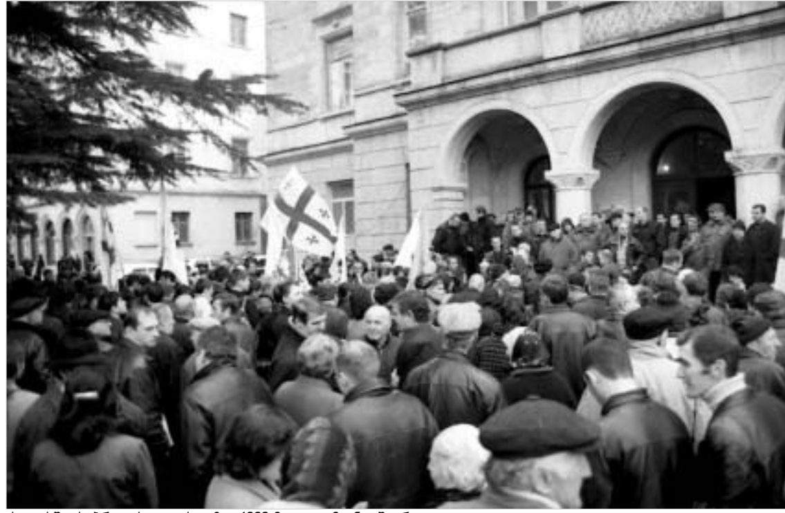
ქუთაისში საპროტესტო აქციაზე 1000-მდე ადამიანი შეკროდა.