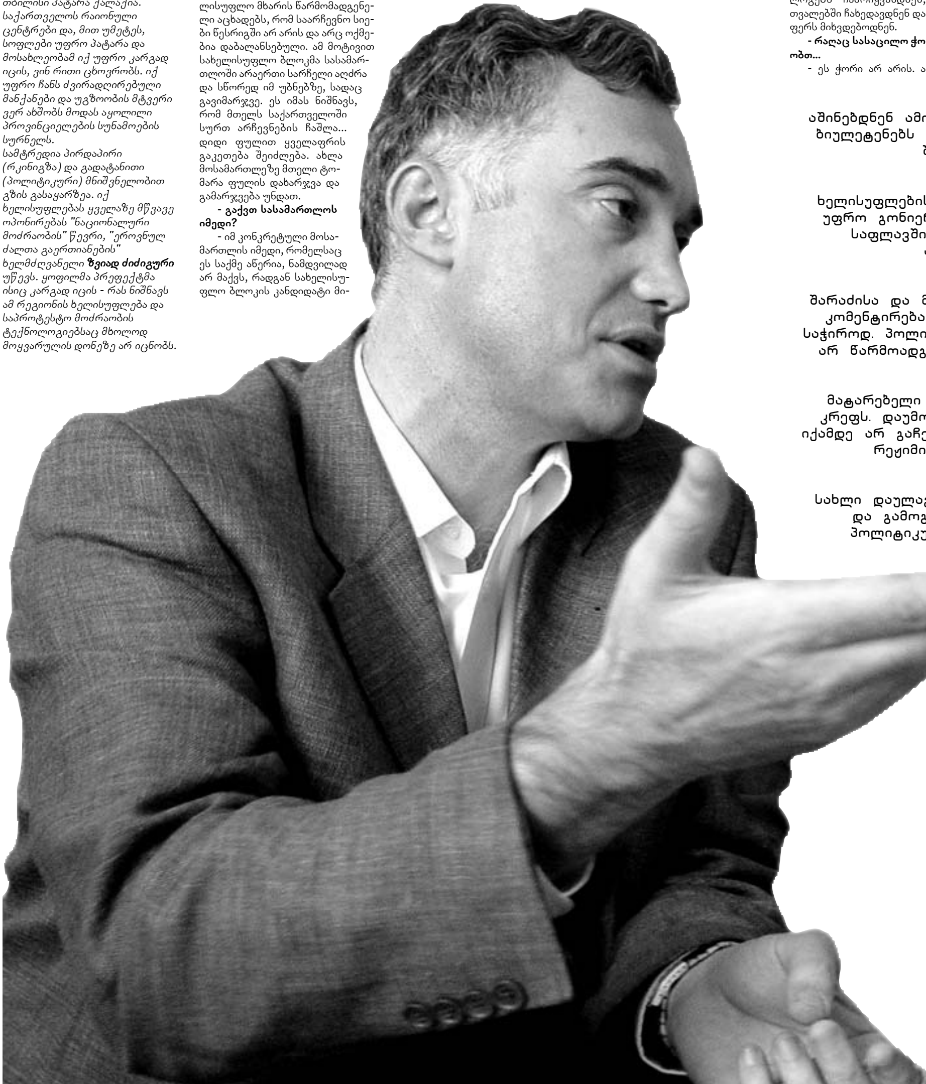
რამ აქვს დასაკარგი, მაგრამ ყველა და მათ შორის, მისი გუნდის წევრები ხდებიან, რომ ხელისუფლების დღეები დათვლილია და უფრო გონივრული განხორციელება საფლავში ჩაყოფას - ნასვლას ამჯობინებენ... - ხალხმრავალი მიტინგი რომ დაგჭირდეთ, დაახლოებით რა რესურსია სამტრედიისში? - სამტრედიისში 1000-1500 ადამიანის ორგანიზება უკვე კარგია. მოსახლეობის აქტიურობა ქალაქში დიდია. სოფლებიდან ხალხის პროცესებში ჩართვა ცოტა ჭირს, რადგან მოსავლის აღების პერიოდია, როგორც იქნა, ამინდები გამოვიდა, ხალხი ყანაშია... მაგრამ, განსმუნებთ, რომ ყანაში მომუშავე გლეხსაც მსგავსი სულსკეობა აქვს. - პრეფექტობის ვამს, მთავარ შეცდომად რკინიგზის გადაკეტვა ჩაითვალოს. მსგავსი რამ ახლაც ხომ არ არის მოსალოდნელი? - მაშინ სრულიად შეგნებულად ავრცელებდნენ დეზინფორმაციას. 1991 წელს სამტრედიისში არავითარი რკინიგზა არ გადაკეტვია. საბჭოთა იმპერია იესევე არსებობდა და სამაჩაბლოსთან დაკავშირებული პრობლემების გამო საქართველოს მთელი რკინიგზა გაიფიცა. მაშინ სამტრედიის პრეფექტი ვიყავი. პიკეტაჟები კი 1990 წელს, მრავალ