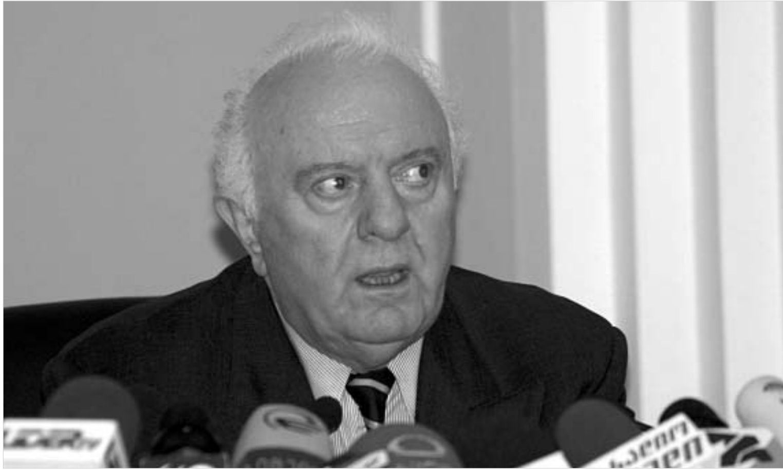
ერთ მხარეს არის ხალხი. მეორე მხარეს კი "კოლექტიური შევარდნაძე". რომლის უკან პიროვნული ამბიციები-ინტერესები გარდა არც არაფერი დგას.