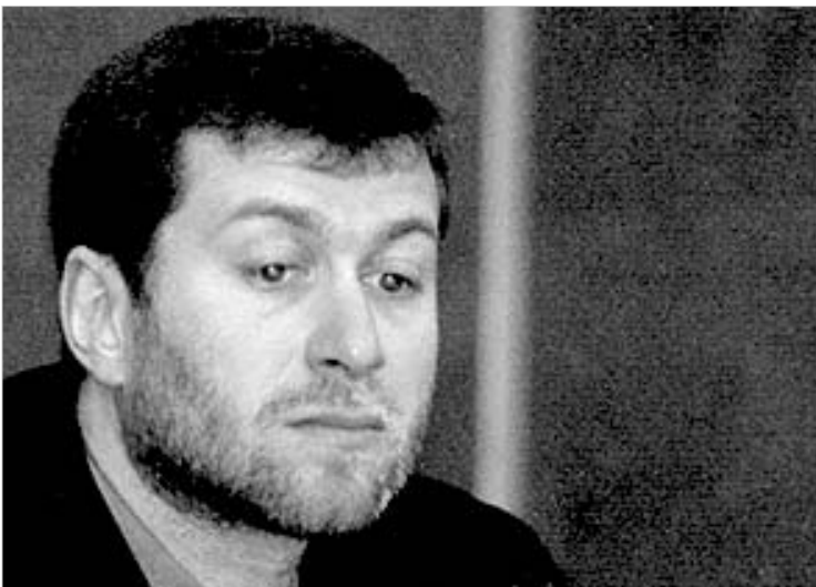
აბრამოვიჩი "ჩელსის" არ დატოვებს