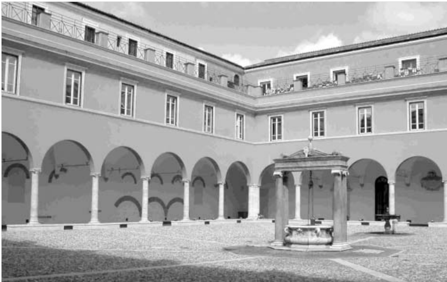
მონასტრის შიდა ეზო. სადაც განლაგებული იყო სკოლა