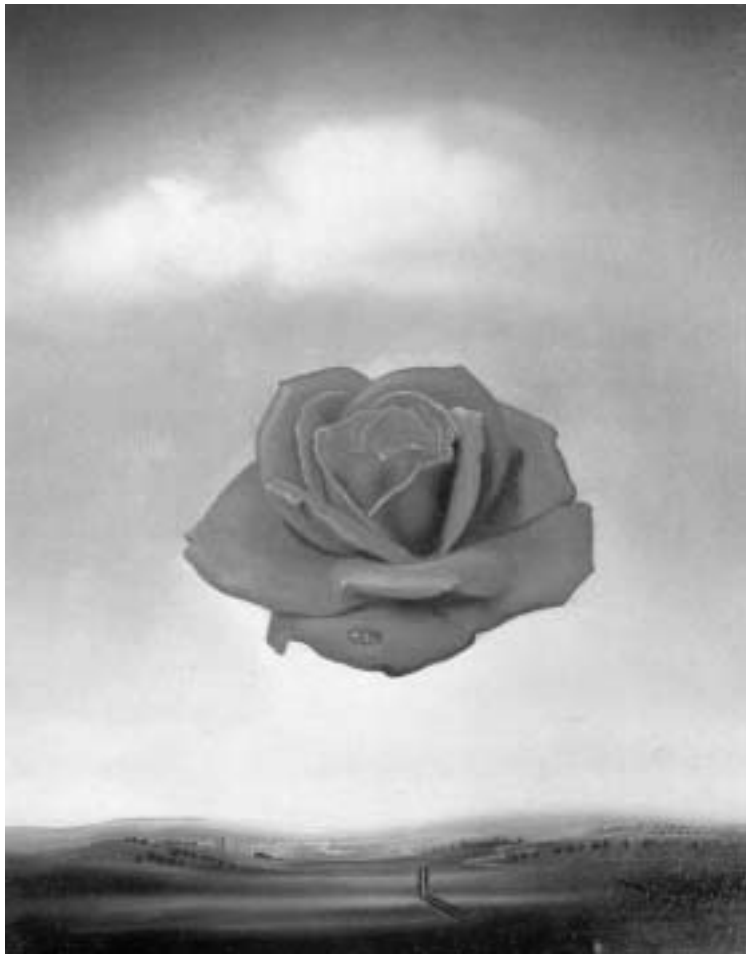
წიგნის ყდა სალვადორ დალის ნახატი არის გაფორმებული