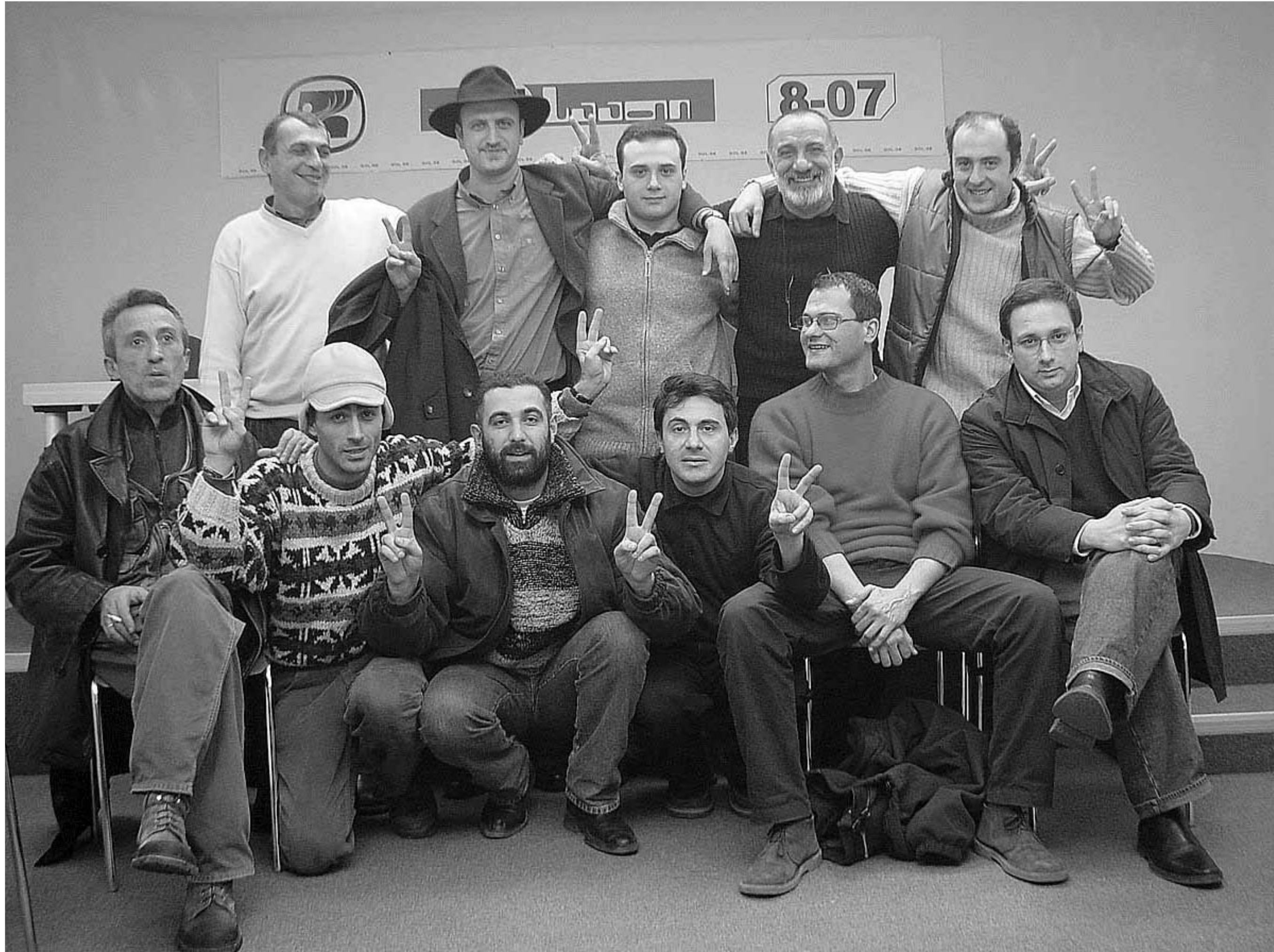
დევით თქვა. დღეს თუ ერთ ღოყაში გაგვარდნამდ. მეორეს მივუგებო... ამ ფოტოს "ნანამ ღოყები მთელი გვაქვს" - ჭკია.