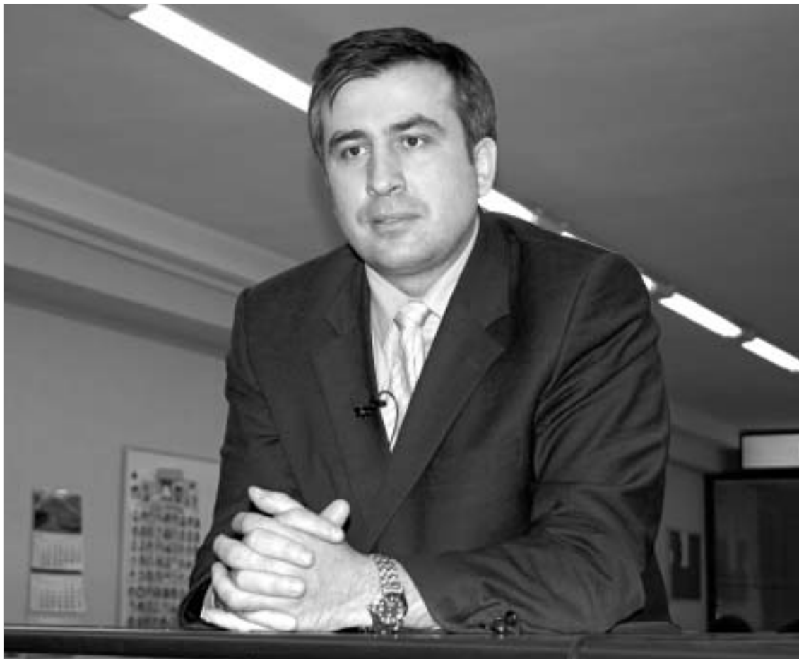
შევარდნაძისთვის ღირსების გადაიჩნა ჩვენი ქვეყნის ღირსების გადაიჩნა.

- თქვენი და ზურაბ ჟვანიას გამომეტყველებით, რჩეულობა მთაბედილება, რომ დიდი ემოციური მთაბედილებს ქვეშ იყავით. რა მოხდა იმ ოთახში, როგორი პრეზიდენტი დაგხვდა? - პრეზიდენტი უკიდურესად ღირსეულად იქცეოდა. ამდენი დანიშნობის, ურთიერთლანდღვის და ბრალდებების მერც ის იყო ადამიანი, რომელსაც ვერც ბოლშა, ვერც გალიზანება ვერ შევატყვეს იყო ადამიანი, რომელიც თავის მომავალს ისტორიული გადასახედიდან უყურებდა. მან თავადვე თქვა და ძალიან სწორადაც, რომ