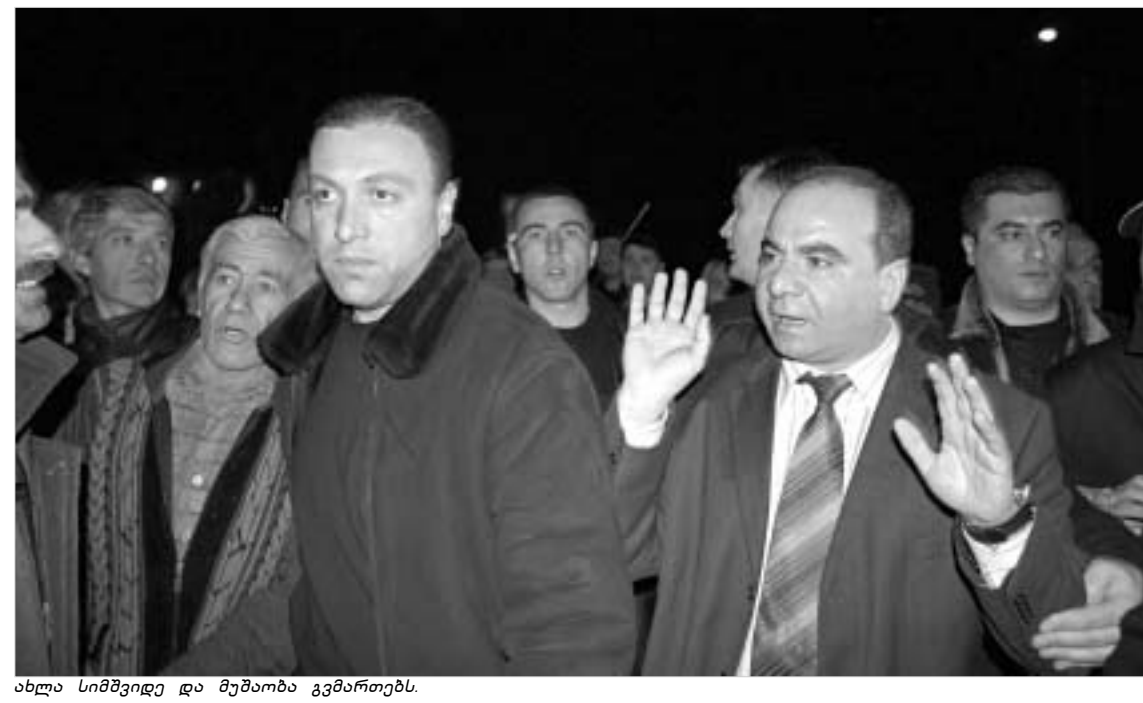
ახლა სიმშვიდე და მუშაობა გვმართებს.