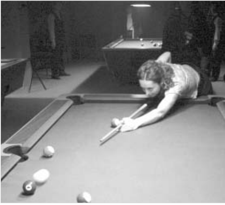
არ დამიწყებთ ახლა, რა დროს ბილიარდიო. მით უმეტეს, უადგილოა ანდაზა, კოლეგებ რომ მომპაძაბა, "ქვეყანა იქცეოდა და ტურა ქორწილს იხდიდაო". ახლა ქვეყანა კი არ იქცევა, პირიქით, ახლა, ქვეყნის შენება იწყება და ბილიარდის დროც დადგა.