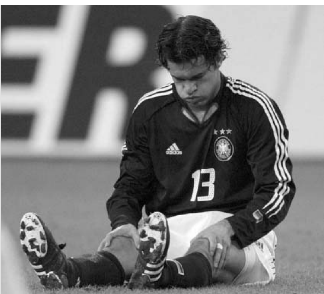
ბალაკი ჰიონესს აკრიტიკებს.

დე ვიბრძვი. თუ მეხუთე ფიქრობს, რომ ფიზიკურად კარგ ფორმაში არ ვარ, გამოსავლის მოძებნას უნდა შევეცადო. მე არ ვარ ის დამიანი, რომელთანაც დიალოგი შეუძლებელია. ხომ შეიძლება, შვიდიდ და დავილაპარაკო ყველაფერზე?