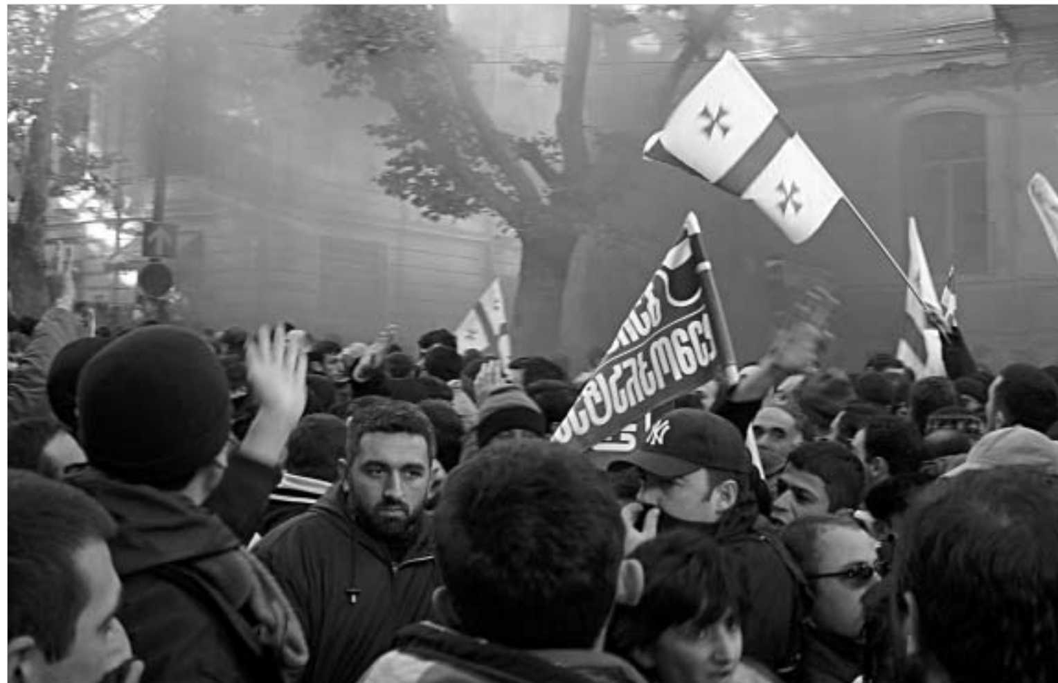
თბილისი, საქართველო, 2003 წელი