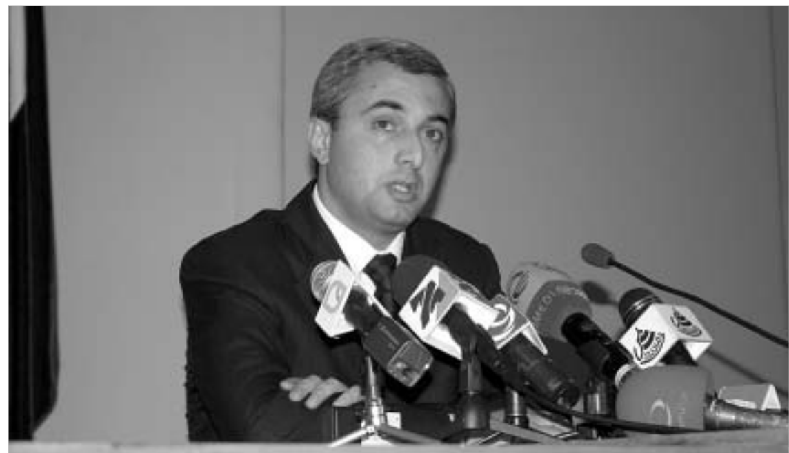
კობა ნარჩემაშვილი მესამედ მიღებული გადაწყვეტილება საბოლოოდ გამოაცხადა.

ჯერჯერობით, შს მინისტრის საგარეო ცარიელია. კანონით, მინისტრის მოვალეობის შესრულება პირველ მოადგილეს, ამ შემთხვევაში, შოთა ასათიანს უნდა დაეკავოს. "კანონი, მინისტრის არყოფნის შემთხვევაში, მის