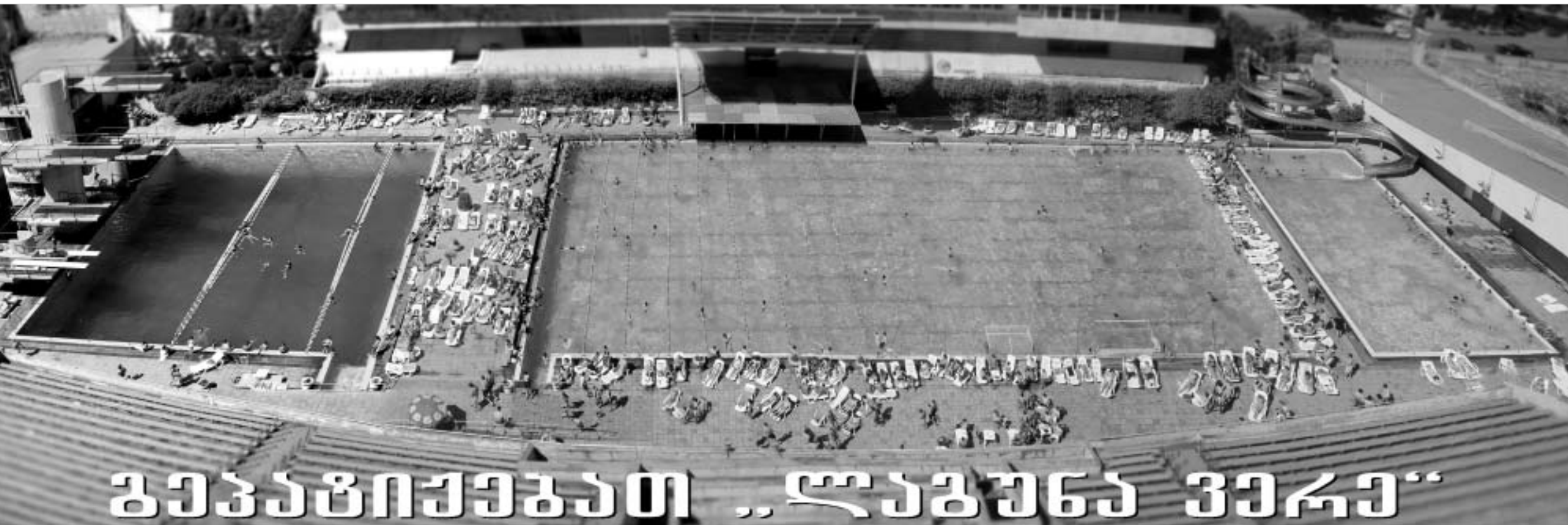
გეგმათიშეგებათ „ლაგუნა ვეჩა“

ფეხბურთი. ლატვიის ნაკრების ყოფილმა მწვრთნელმა გარი ჯონსონმა დაადასტურა ინფორმაცია, რომ შემდეგაც არსენალი ფორვარდ მარსელის ვერნაკოუსკით დაინტერესდა. ჯონსონმა, რომელიც "სკონტოს" კონსულტანტის თანამდებობაზე მუშაობს, განაცხადა: "არსენალის" სპეცტიკი ვერნაკოუსკის თურქმენთან ორივე მატჩში დააკვირდნენ და ფეხბურთელი ლონდონში მიიწვიეს. მარისი კარგი ფეხბურთელია". ევროპისკუვიით, რომელიც ავგისტომი "ვულფერ-სემპტონმა" დაიწვია, იტალიური "რომა" დაინტერესდა.