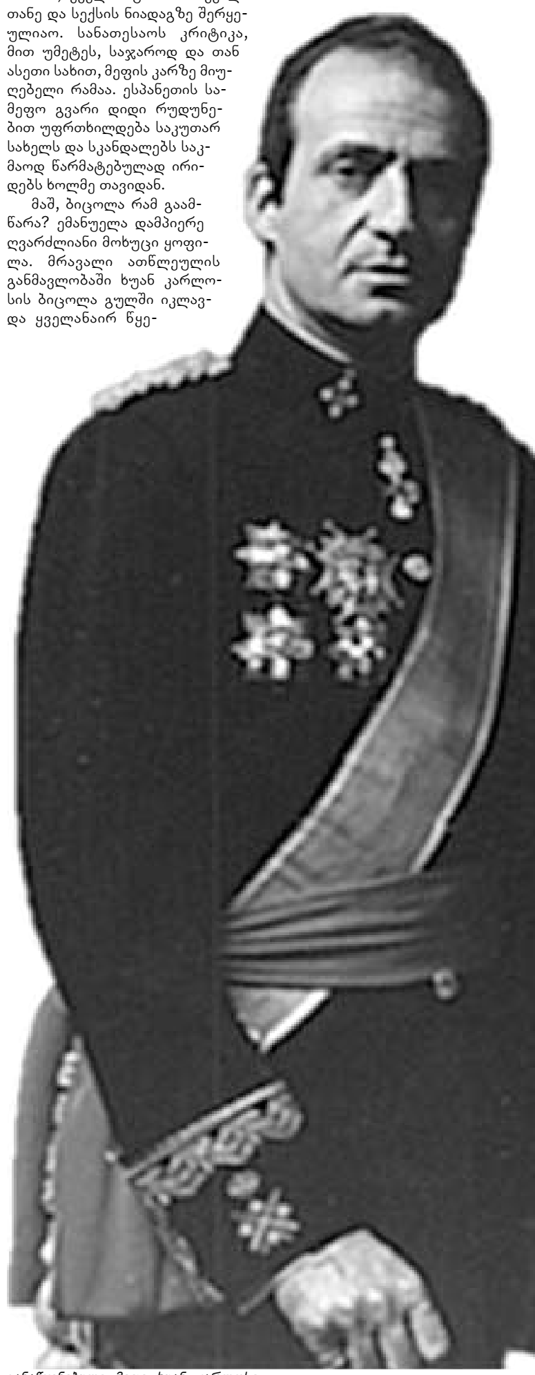
განწყენებული მეფე ხუან კარლოსი