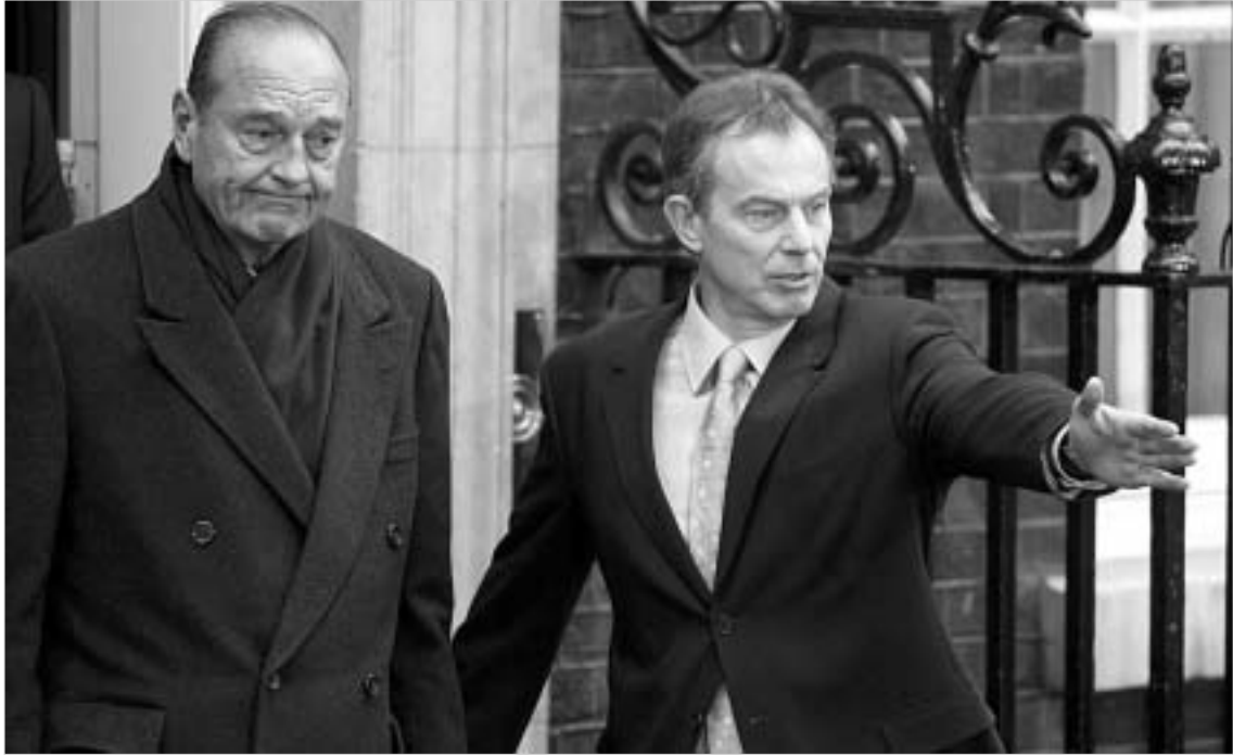
ქვეყნის ლიდერები იმ ურთიერთობის გაუმჯობესებას შეუცდებიან, რომელიც ერის ომის დაწყებამ გააუარესა.

ყოველივე ამის მიუხედავად, პარიზი და ლონდონი (ვილიობენ, ერთმანეთში უფრო მეტი საერთო გამოწახონ, ვიდრე განსხვავება. ჟაკ შირაკის ვიზიტი ლონდონში ამის უდავო დადასტურებაა.