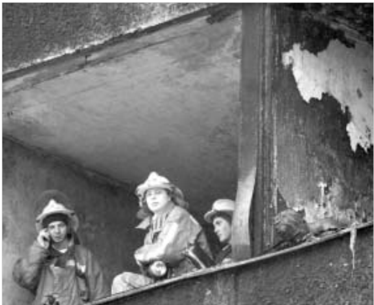
ხანძარმა 32 ადამიანის სიცოცხლე შეინარა.

როგორც ცნობილი გახდა, ხანძარი საერთო საცხოვრებელში მოსკოვის დროით ლამის სამ საათზე გაჩნდა. შენობა საკმაოდ ძველი იყო და ცეცხლი სწრაფად გავრცელდა. ცეცხლის აღმი გაეხვია მეორე და მესამე სართული. საბოლოოდ, ხანძრის საერთო ფართობმა ათას კვადრატულ მეტრზე მეტი მოიცვა. სტატისტიკური მონაცემების თანახმად, უკანასკნელ წლებში მოსკოვში ასეთი მასშტაბური ხანძარი არ ყოფილა. როდესაც შეხანძრეთა რაზმი შემთხვევის ადგილზე მივიდა, შენობა უკვე თითქმის მთლიანად ცეცხლში იყო გახვეული.