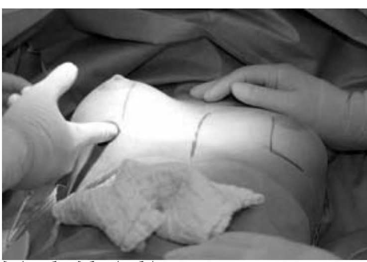
პლასტიკური ოპერაციის დროს

რა შეიძლება კაცმა ლოტოში მოიგოს? მანქანა, სახლი, საგზურა... ერთმა ბელგიურმა რადიომ განსაკუთრებით ორიგინალური ჯილდო დაანება: ახალი ცხვირი ან მკერდი. ბრიუსელში რადიო და ტელე-შოუ "თეთრი და შავი" (Zwart of Wit) გამარჯვებული პლასტიკურ ოპერაციას უფასოდ გაიკეთებს. არჩევანი მისია: ან კოხტა ცხვირს შეიძენს, ან ლამაზ მკერდს. რამდენადაც ხალხი აღტკინებულია, იმდენად აღშფოთებული ბრძანდება პარლამენტის წევრი მაგდა დე მეიერი: განა გარეგნობაა მთავარი? გარდა ამისა, პლასტიკური ოპერაციები მას "ზანა-ლურად" მიაჩნია, და თვლის, რომ მსგავსი მასხარაობა კატეგორიულად უნდა აიკრძალოს. შოუს მესვეურები ძალიან კმაყოფილი არიან: მთავარი ხომ მითქმა-მითქმაა, და სკანდალი საუკეთესო რეკლამა შეიძლება იყოს. SMS-ის მეშვეობით უკვე 380-მა ადამიანმა განაცხადა, რომ შოუში მონაწილეობა სურს - უმრავლესობა მკერდის გაზრდისთვის იბრძვის. ზოგიერთ მამაკაცს მოგება თავის სატრფოს მკერდის ხაზით უნდა. იმედია, მათ სატრფოებსაც არაფერი აქვთ საწინააღმდეგო.