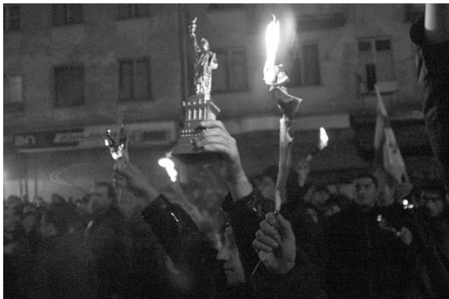
თბილისი, საქართველო, 2003 წელი