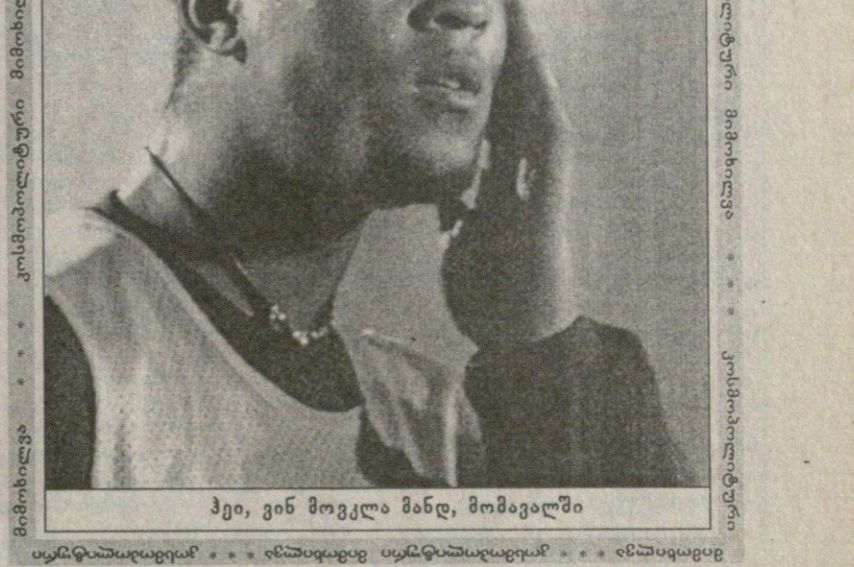
პეი, ვინ მოგვლა მანდ, მომავალში

იტალიის ნაკრები ევროპის ჩემპიონი იმიტომ ვერ გახდება, რომ ვერ ერთი ფეხბურთის თამაში არ იცის — ისტორიაში ყველაზე დიდი მოგება 10 აქვს, სხვა თამაშებში იგებს ძელით ნოლს, ორი კუთხურით ერთ კუთხურს და სამი აუტით ორ აუტს — მეორეც ყველაზე დიდი ვარსკვლავი, დელ პიერო მხოლოდ პენალტის დარტყმაში ვარგა და თუ გავითვალისწინებთ, რომ პენალტი საშუალოდ რვა ტურში ერთხელ ინიშნება, შეუძლია შეიღმატჩიან ევროპის ჩემპიონატზე სულ არ ჩავიდეს, მესამეც მთავარმა ბომბარდირმა, ფილიპო ინძაგამ თავის კატეგორიაშიც კი ვერ მიიღო მსოფლიოს საუკეთესო ფეხბურთელის წოდება — საუკეთესო, თუ არ ვცდებით, მიაკრემლინგი თუ მიშელ აკერსი გახდა, მეოთხეც და რაც მთავარია, ანჯელო დი ლივიო დაბერდა და ასე შემდეგ.