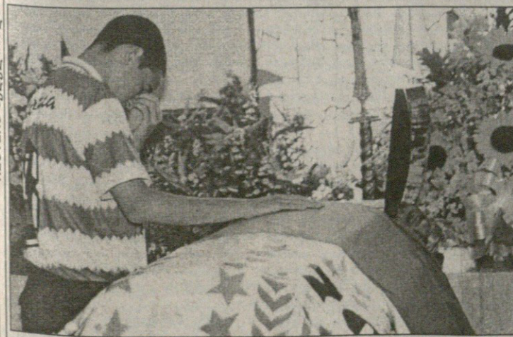
კოლუმბიელი ფანი არტურო ბუსტამენტეს ცხედარს დასტირის

მედელინი ქალაქია კოლუმბიაში, რომელმაც გახმაურებული მკვლევარობებით გაითქვა სახელი. სწორედ იქ მოკლეს ანდრეს ესკობარი, კოლუმბიის ნაკრების ფეხბურთელი.