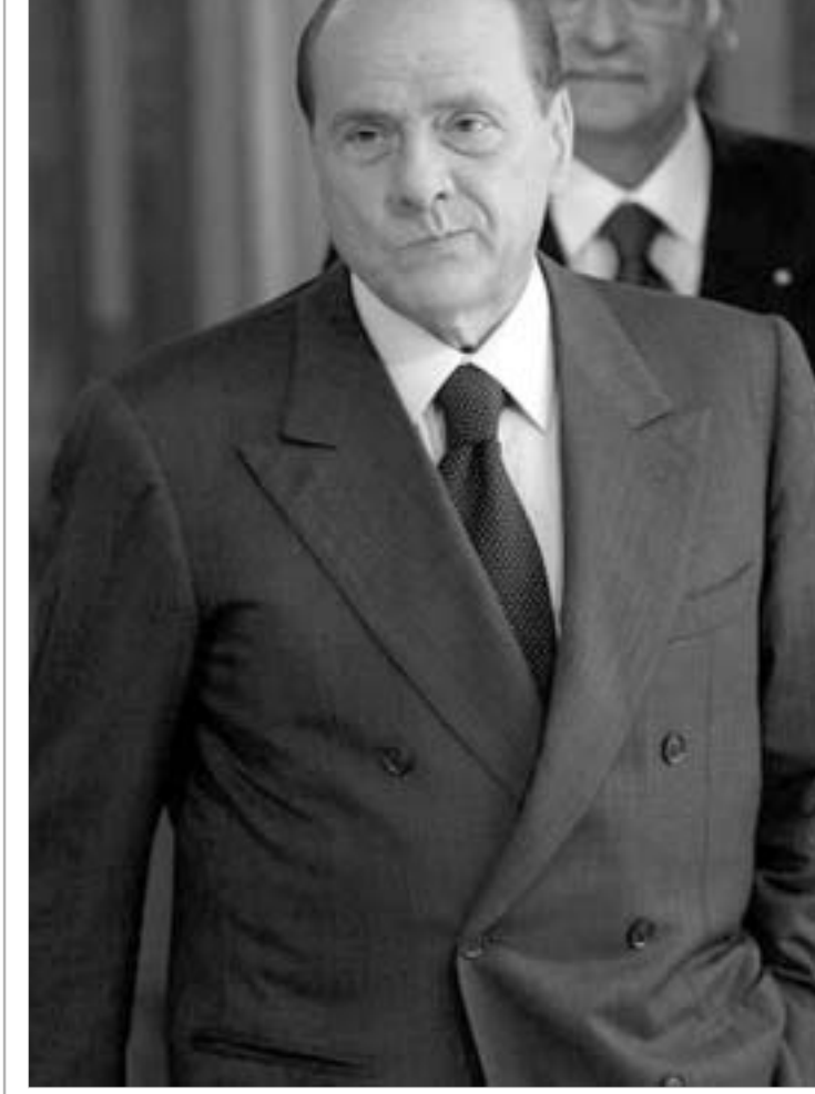
სილვიო ბერლუსკონი ახალი კანონით კამაყოფილია

იტალიის საკანონმდებლო ორგანომ მასობრივი საინფორმაციო საშუალებების შესახებ ახალი კანონპროექტი მიიღო. დამკვირვებელთა და ექსპერტთა შეფასებით კანონი მრავალწინააღმდეგობას შეიცავს, რაც, საბოლოო ჯამში, იტალიაში სიტყვის თავისუფლების და პლურალიზმის სავრნობლად ზღუდავს.