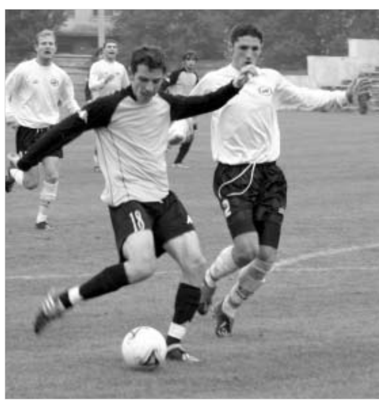
"თბილისელი" განვიხილავთ და "ვიტ ჯორჯია" იმედაშვილის ორთაბრძოლა

აბის ბოლოს დაკარგული 3, რეალურად კი 1,5 ქულის ნაცვლად ჩემპიონატის დასკვნით ეტაპზე 6 მნიშვნელოვან ქულას მიითვლიდა. აი, ასეთი ართიმეტყია იყო ამ თამაშებში, მაგრამ, ქართული ფეხბურთისა და მისი გულშემატყეობისთვის საბუნდირად, ვარაუდებზე არც ერთი გუნდი არ ნახულა. ამ თხიხ გუნდის საქციელი კი იმის გარანტიაა, რომ საქართველოს ჩემპიონატი ფეხბურთში ძალიან მაღალ დიპტერულად ატორტავს და ნაღვს. ალბა, რაც შეეხება სხელებულ და