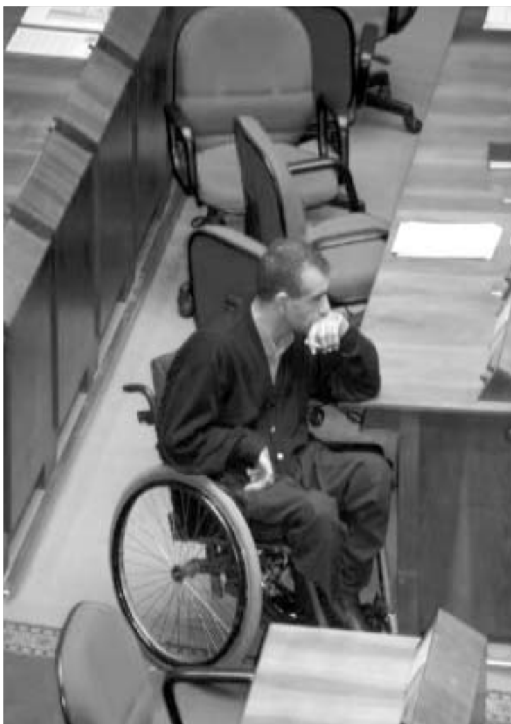
პარტეზობით, დავპირდნენ, რომ ინვალიდებს მდგომარეობა არსებულზე უარესი არ იქნება. - აცხადებს პარლამენტარი გიორგი კობრიძე.

"ნებისმიერ რევილუციას, ვარდების იქნება ის, თუ არა, უკანსვლა მოჰყვება. ჯერჯერობით, დავეპირდნენ, რომ ჩვენი მდგომარეობა არსებულზე უარესი არ იქნება," - აცხადებს პარლამენტარი გიორგი კობრიძე, - ძველი სისტემის დასასრული ლოგიკური იყო. სისტემა, რომელიც, ფაქტობრივად, სიცოცხლის ქურდობას აიძულებდა ადამიანს, დიდხანს ვერ გაძლებდა. ჩვენ ბევრ რამეზე ვჭეუდებოდით, მთავრობის ყურადღება რომ მიგვეყარო, პარლამენტში საკუთარი წარმომადგენლის ყოფილი ვადლოვებით, ჩვენთვის სისხლბორცვილი საკითხების ლობირება რომ მოგვეხდინა. იმედია, სისტემა შეიცვლება და ახალი ხელისუფლება ამ "ტრადიციას" არ გაიზიარებს. ამის დიდი იმედი გვაქვს, რადგან ამ ხალხს ჩვენი პრობლემები ისევე ესმოდა, როგორც ჩვენ."