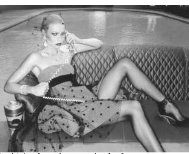
მაღონა სტილში გადამწყვეტილი გვინეტ პელტროუ

მაღონა და გვინეტ პელტროუ კარგი მეგობრები იყვნენ. მოდების წვეწვანზე ერთად დადიოდნენ, და მაღონა იმხანად გვინეტის ახალი შეყვარებულის, მომღერალ კრის მარტიუს დიდებას გალობდა. მაგრამ, როგორც ჩანს, მაღონას ერთ დღეს ყელში ამოუვიდა მსახიობი ქალი, რომელიც მის ჩაცმის სტილს მეტისმეტად დაუფარავად ბაძავდა და გადამწყვეტილი, რომ მასთან მეგობრობაც აღარ უნდა. დასკვნის სახით პელტროუმ მაღონას კინოში როლიც წაართვა, რამაც მათი მეგობრობის გამყარებას არაფრით შეუწყო ხელი.