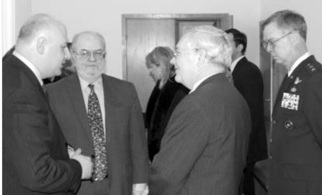
ამერიკელი “დესანტი” საქართველოს ყველა მიმართულებით შეისწავლის.

საქართველოს ახალი ხელისუფლებას ამერიკიდან ძველი ნაცნობები ესტუმრნენ. 2 ნოემბრის საპარლამენტო არჩევნებიდან სულ რამდენიმე დღეში საქართველოს ამერიკის შეერთებული შტატების სახელმწიფო მდივნის მოადგილე ლინ პასკო ეწვია. პასკო, რომელიც, ამავდროს, ევრაზიის საკითხთა ბიუროს ხელმძღვანელიც არის, წინასწარმოდგინებული მითითებებისა და პოლიტიკური პარტიების წარმომადგენლებს არჩევნების შემდგომი მდგომარეობის გასაცნობად შეხვდებოდა. ახლა პასკო რეკლამაციის შემდგომ და საქართველოს არჩევნების წინა მდგომარეობის გასაცნობად ეწვია საქართველოს.