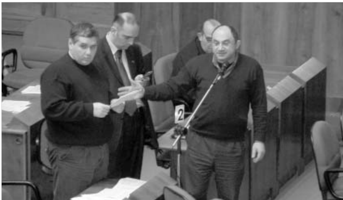
პარლამენტში ისევ გაგრძელდა კვირების პრობლემა.