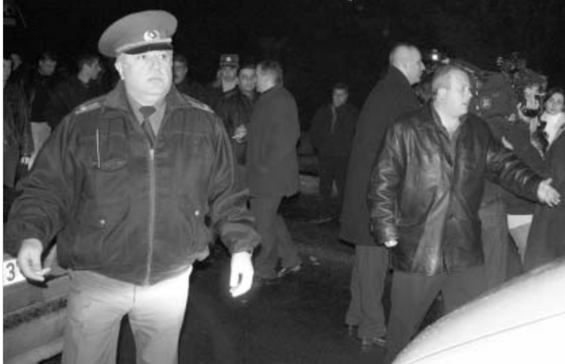
შემთხვევის ადგილზე მისული სამართალდამცველები მომხდარს ზუსტ შეფასებას ვერ აძლევდნენ.

გუშინ, როდესაც პრეზიდენტობის მოვალეობის შემსრულებელი ნინო ბურჯანაძე კომენტარს უკეთებდა ბორის ბერეზოვსკის თბილისში ვიზიტს, “ლამის კურირის” ეთერიდან მძლავრი აფეთქების ხმა გაისმო. როგორც მოგვიანებით გაირკვა, აფეთქება “ლამის კურირის” საეთერი სტუდიიდან ორმოციოდ მეტრის მოშორებით, სახელმწიფო ტელევიზიის შენობასთან მოხდა. სავარაუდოდ, აფეთქებული ნივთიერება ტელევიზიის კედელს მიდგომულ კომერციულ ჯიხურში, ან მის გვერდით, იმ ნიშაში იყო ჩადებული, სადაც წყალსადენი მილები გადის. ტელევიზიის თანამშრომელთა თქმით, ეს ჯიხური ზავიანობით მუშაობს, წლის დანარჩენ დროს კი დაკეტულია. აფეთქების შედეგად ჩამოსხვრა ჯიხურის თავზე განლაგებული ფანჯრების მიწები და გასკდა წყალსადენი მილი.