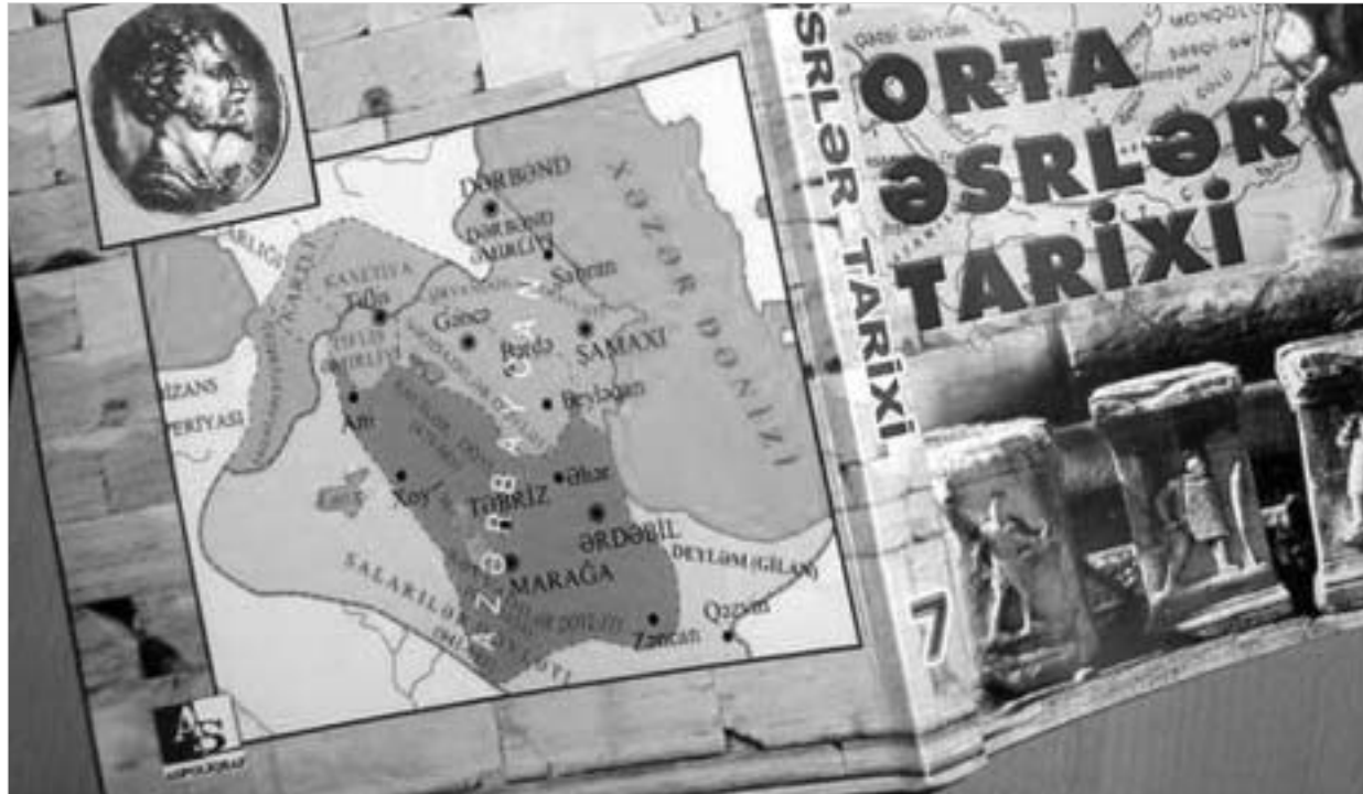
მან მუსაბაილი ფოტო

აზერბაიჯანული ისტორიის სახელმძღვანელოს ყდაზე განთავსებული რუკა, რომლის მიხედვითაც თბილისიც კი აზერბაიჯანის ტერიტორიაზეა მოქცეული.