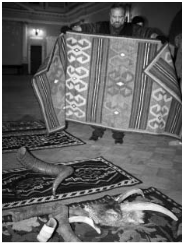
ფართო საზოგადოება დღეს ეროვნული ბიბლიოთეკის კედლებში იხილავს. რა სახით შემოვარდა ტრადიციული ხელოვნება.

ყველაფერი ძალიან ადრე დაიწყო, როდესაც მესამე სექტორის ფონდი "ჰორიზონტი" რეგიონებში მუშაობით დაინტერესდა. რეგიონებში ჩვენი მუშაობის მთავარი მიზანი ადგილობრივი მოქალაქეების გააქტიურება იყო. ცვდილობდით, ამ ხალხისთვის დაგვებრუნებინა