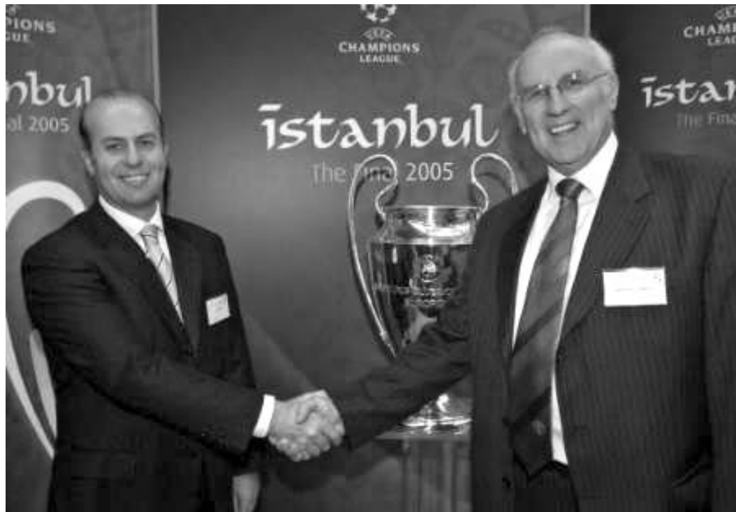
კენჭისყრის დასრულების შემდეგ „მილანის“ და „მანჩესტერ იუნაიტედის“ წარმომადგენლებმა ერთმანეთს ხელი ჩამოართვეს.

თუმცა, ეს თურმე მხოლოდ დასაწყისი იყო. ასეთი „ვადამდელი