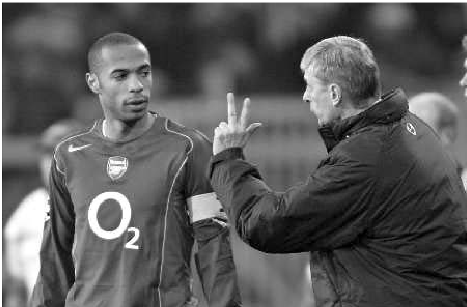
ვენბერის ჯარის სახით 15 ათას ფუნტს გადაიხდის.