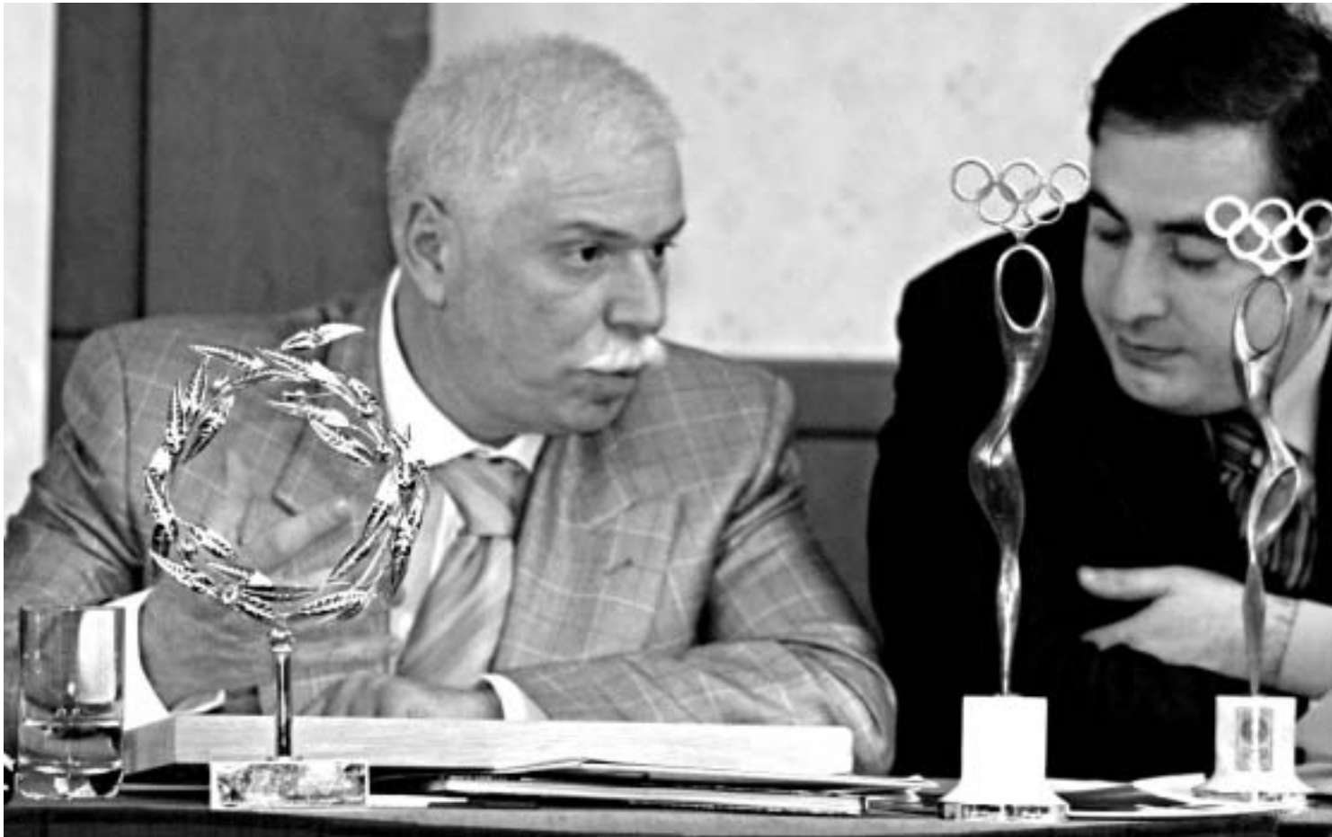
პატარკაციშვილს პრეზიდენტის პოსტი უბრძოლველად ერგო.

ახლა ორი სიტყვით იმაზე, რაც არჩევნებამდე მოხდა. თუმცა სათქმელიც ბევრი არაფერია, გარდა იმისა, რომ ნაშუადღევს დაწყებული სესიის დაჯილდოების ცერემონიაშია თითქმის ერთ საათს ვასტანა. ამ ხნის განმავლობაში დაფასდა ყველა ის ადამიანი, ვისაც განსაკუთრებული წვლილი მიუძღვის ქართული სპორტის წარმატებაში. ჯერ ათენის ოლიმპიური თამაშების პრიზორები დააჯილდოეს საერთაშორისო ოლიმპიური კომიტეტის ნიშნებით, სეოკ-ის უმაღლესი ჯილდოთი - "ოლიმპიური ორდენით". დააჯილდოეს სეოკ-ის სპეციალური პრიზითაც - კერძოდ, ლევან ვარდოსანიძის სკულპტურული ნამუშევრით (ზურაბ ზვიადაძური მოსკოვშია და ერთ-ერთ ტურნირ-