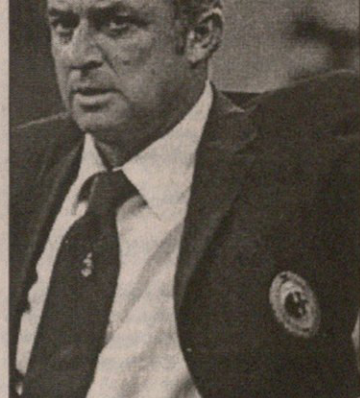
ფათაბ თერიში „ფიორენტინას“ და კრიტიკოსებს აჯობა

ბერგამომი გამოჩნდა, რომ ტურინელ ფორვარდებს, დელ პიეროსა და ტრეპეგუს მაღრიდის „რეალში“ გაყიდული ზინედინ ზიდანის არაფერამ ფრთები მაინცდამაინც ვერ შეჰკვეცა. გეხსენებებოდა თუ მოსწონთ?