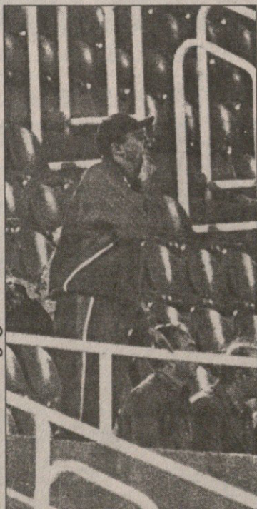
წინა ტურში გამევეებული ცხადამე „ლოკომოტივს“ ტრბიუნდან არივებდა

ლოკომოტივურ თემას ბარემ იმასაც დავუმატებოთ, რომ პირველ ტაძიმში მატ-