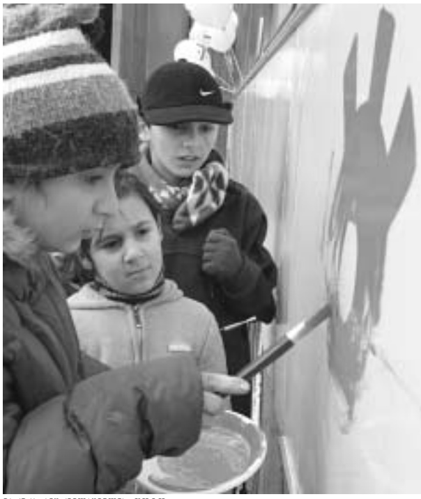
დღეიდან თბილისში ივლის ტროლეიბუსი, რომელიც თანაქალაქელებისთვის სპეციალურად შეზღუდული შესაძლებლობების მქონე ბავშვებმა მოხატეს.