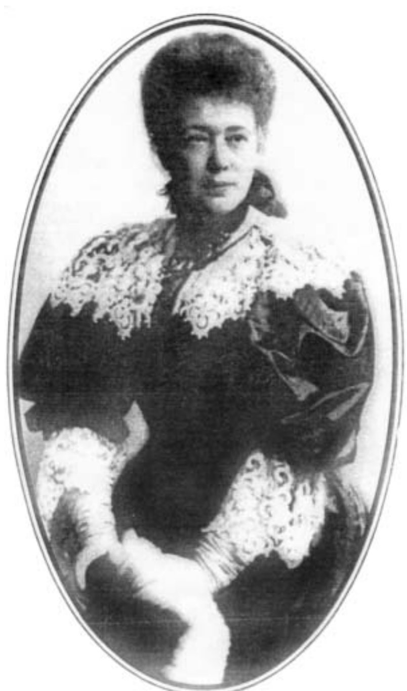
ბერტა ფონ ზუტნერი

1876 წლის გაზაფხულზე ვენის ერთ გაზეთში დაიბეჭდა განცხადება: საკმაოდ მდიდარი, განათლებული ხნოვანი ჯანტყმენი, რომელიც პარიზში ცხოვრობს, ინვეს-